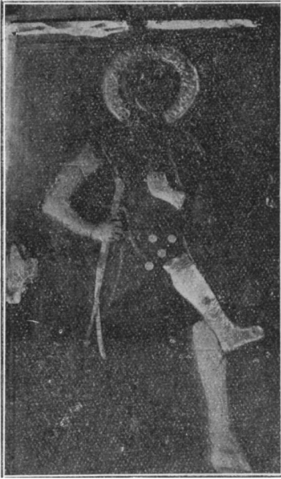
Εἰκ. 1. Ὁ Ἅγιος Γεώργιος, ὁ ἐπιλεγόμενος «Ἀράπης», ἐν Ἡρακλείᾳ.

Εἰκ. 4. Αὕτη παριστά τὸν Ἅγιον Γεώργιον τὸν ἐπιλεγόμενον «Ἀράπην» ἐν ἀναγλύφῳ εὕρισκομένῳ, ἐν Ἡρακλείᾳ (ἀρχ. Περίνθῳ) ἐντὸς ὁμωνύμου τοῦ Ἁγίου ναοῦ.