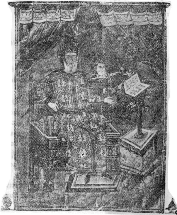
Ἀλέξιος Ἀπόκαυκος, ἐκ χειρογράφου τοῦ Ἱπποκράτου τῆς ἐν Παρισίοις Ἐθν. Βιβλιοθήκης.

τὸ ὁποῖον φαίνεται κρατῶν ἐν τῇ εἰκόνι φέρεται τὸ τοῦ Ἱπποκράτους :