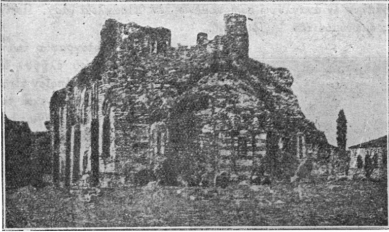
Είκ. 2. Ἡ μέχρι τοῦ 1878 κατάστασις τοῦ κατὰ τὸν 6 μ. Χ. αἰῶνα κτισθέντος ἐν Σηλυβρία ἱεροῦ Ναοῦ τοῦ Ἁγίου Σπυριδῶνος.