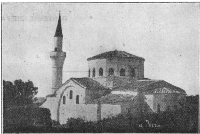
Εἰκ. 1 — Ναὸς τῆς Ἁγίας Σοφίας ἐν Βιζύῃ μεταβληθεὶς εἰς Τζαμίον.

Εἰκὼν 1). Ναὸς τῆς Ἁγίας Σοφίας ἐν Βιζύῃ μεταβληθεὶς εἰς Τζαμίον.