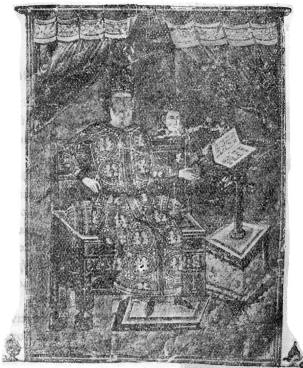
Ἀλέξιος Ἀπόκαυκος, ἐκ χειρογράφου τοῦ Ἱπποκράτου τῆς ἐν Παρισίοις Ἑθν. Βιβλιοθήκης.

τὸ ὁποῖον φαίνεται κρατῶν ἐν τῇ εἰκόνι φέρεται τὸ τοῦ Ἱπποκράτους :