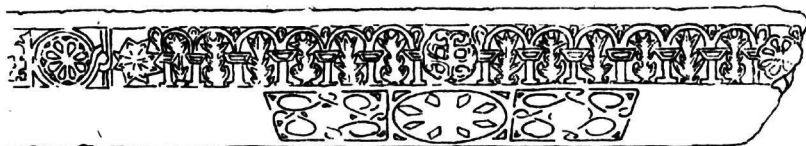
Εἰκ. 4. Ἐπιστύλιον τέμπλου ἐν Ἀγ. Παρασκευῇ Χαλκίδος.

Τὸ ἐν λόγῳ έπιστύλιον, προερχόμενον ἀσφαλῶς ἐκ τέμπλου, ὡς δεικνύει ἡ διακόσμησις τῆς κάτω πλευρᾶς αὐτοῦ, 2) φέρει ἐπὶ τῆς κυρίας