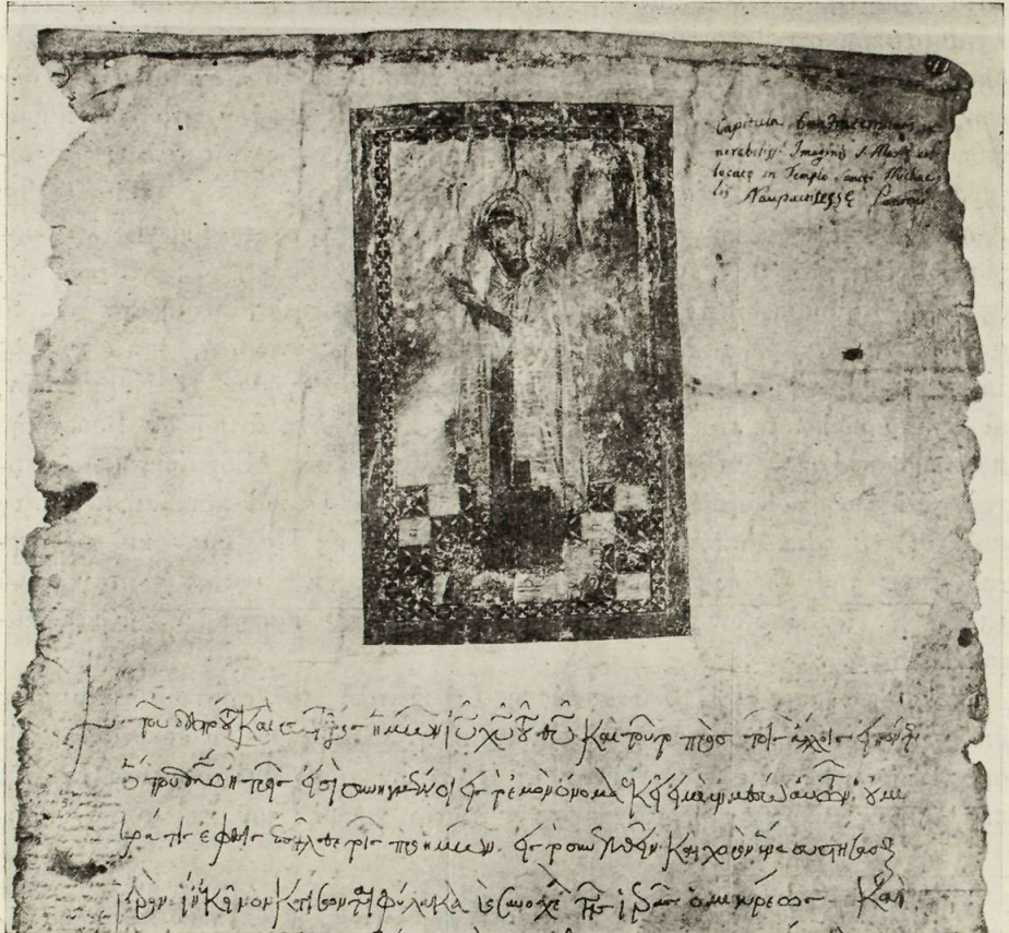
Πανομοιότυπον τῆς κεφαλίδος τοῦ Καταστατικοῦ τῆς Ἀδελφότητος τῆς Παναγίας Ναυπακτιωτίσσης.

χοντος κειμένου. Ἀντιθέτως μεταγενέστερον εἶναι τὸ ἐπὶ τῆς δεξιᾶς ἄνω γωνίας γεγραμμένον σημεῖωμα: «Capitula confraternitatis venerabilis imaginis S. Marie collocata in templo Sancti Michaelis Naupactitesses Panormi» 1) ,