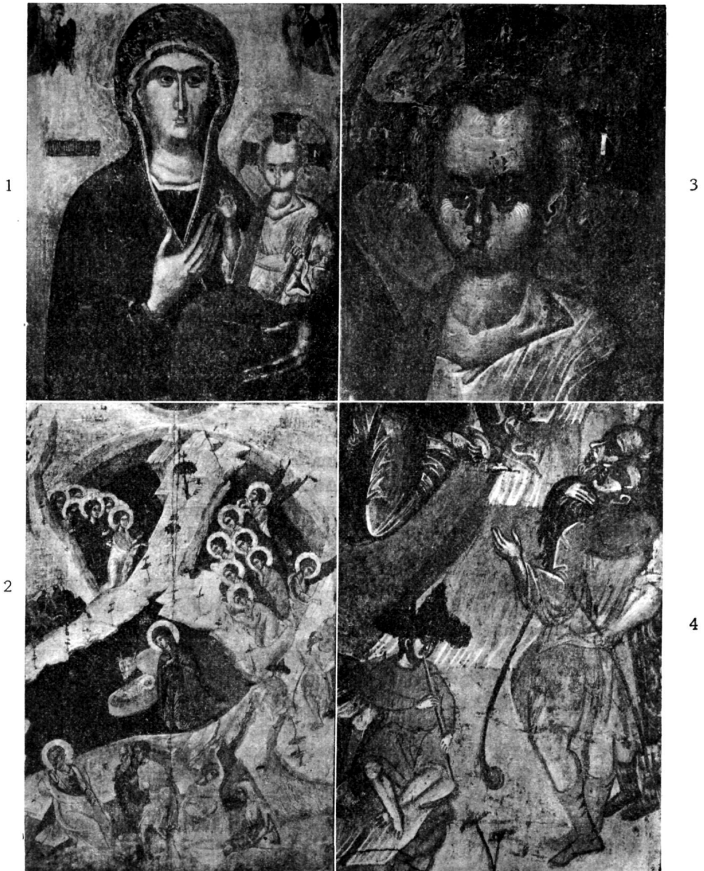
1—2. Εἰκὼν Θεοτόκου Ὁδηγητρίας ἐν προτομῇ.—Λεπτομέρεια τοῦ παιδίου Ἰησοῦ. 3—4. Εἰκὼν τῆς Γεννήσεως τοῦ Χριστοῦ.—Λεπτομέρεια τῶν ποιμένων.