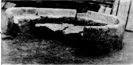
Εἰκὼν 5. Λεκάνη ἀγίασμοῦ(;) περισυλλεγεῖσα εἰς τεμάχια καὶ ἀποκειμένη νῦν εἰς τὴν πρὸ τοῦ Καθολικοῦ συλλογὴν τῶν γλυπτῶν.

“Ὡστε εἰς τὸν κεντρικὸν θάλαμον διωχετεύετο ψυχρὸν καθαρὸν ὕδωρ ἐκ τῆς δεξαμενῆς, ὅπερ ἤρχετο κατ’ εὐθείαν ἐκ τῆς πηγῆς. Τοῦτο θὰ ἐχύνετο εἰς τὸν κ ὀ λ υ μ β ο ν, εἶδος λεκάνης, ἐκ τῆς ὁποίας θὰ ἐλάμβανον τὸ ὕδωρ—ὡς εἰς τὰς φιάλας τῶν ναῶν.