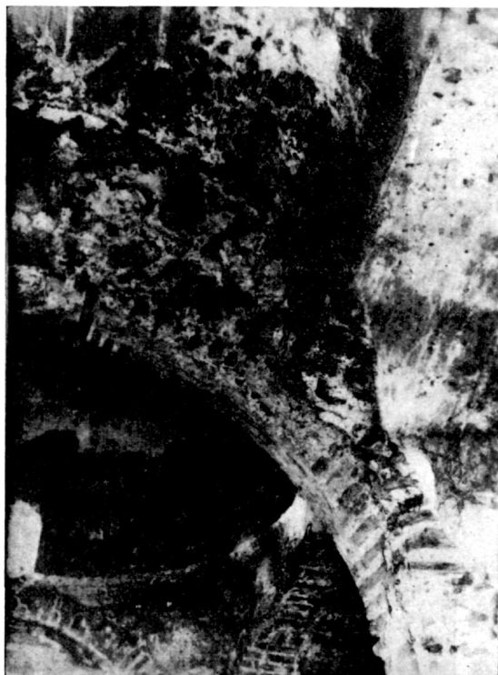
Εἰκὼν 3.— Ἐπιτομή τοῦ ἐσωτερικοῦ ἀγιάσματος τῆς Καισαριανῆς.

Φαίνεται ὅτι εἰς αὐτὰ δὲν ἐγίνετο μόνον πόσις ἀλλὰ καὶ συμβολικὴ λοῦσις ὀλοκλήρου τοῦ σώματος ἢ μερῶν αὐτοῦ (κεφαλῆς, χειρῶν