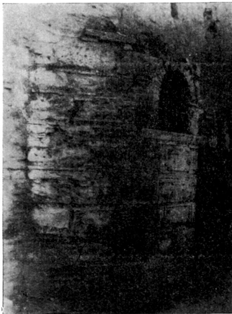
Εἰκὼν 4. Ἡ βορεία κόγχη τοῦ ἀγιάσματος ἐξωτερικῶς.

Ὁ Πορφυρογέννητος (Α. σ. 551), περιγράφων εἰς τὸ κεφ. τὸ ἐπιγραφόμενον «ὄσα δεῖ παραφυλάττειν τῶν δεσποτῶν ἀπιόντων λούσασθαι ἐν Βλαχέρναις» ἰδίᾳ κατὰ τὴν Μ. Παρασκευὴν, λέγει μεταξὺ ἄλλων: Μετὰ ταῦτα οἱ βασιλεῖς εἰσέρχονται εἰς τὸ ἀποδυτὸν (πρῶτη αἴθουσα) περιβάλλονται λέντια καὶ εἰσέρχονται εἰς τὸ ἅγιον Λουῖσμα (δευτέρα αἴθουσα-ὡς εἶδομεν-μὲ κόγχας ὡς τὸ caldarium), ὅπου ὁ κ ὀ λ υ μ β ο ς· δεξιὰ τοῦ κολύμβου ἴστανται οἱ πραιπόσιτοι μετὰ τῆς βασιλικῆς ἀκολουθίας· εἰσερχόμενοι ἄπτουσι κηροὺς καὶ προσκυνοῦσι τὰς ἀργυρᾶς εἰκόνας ἐν τῷ κολύμβῳ· εἶτα ἄπτουσι κηροὺς εἰς τὴν π ρ ὀ ς Α. κ ὀ γ χ η ν, ἐν ἧ καὶ ἡ εἰκὼν τῆς Θεοτόκου. Εἰσέρχονται τέλος εἰς τὸν ἄ γ. Φ ω τ ε ι ν ὸ ν