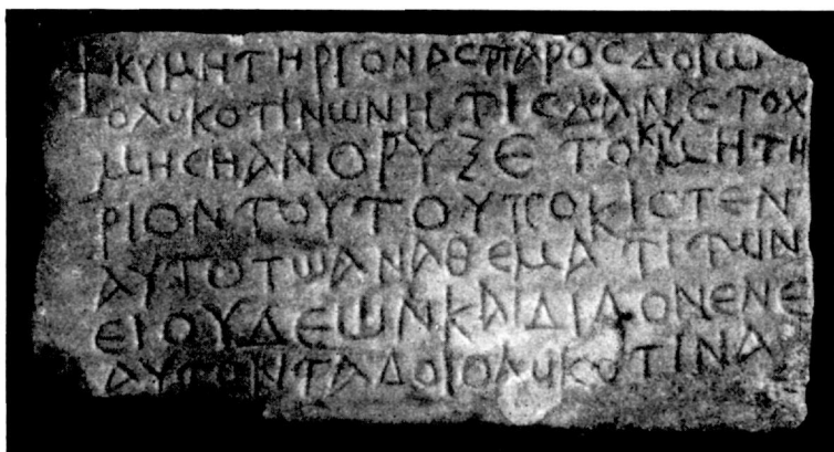
Εἰκ. 1. Χριστιανικὴ ἐπιγραφὴ ἐξ Ἄργους.

Ἡ ὀπισθία πλευρὰ τῆς πλακῶς εἶναι ἀκατέργαστος, ἐνῶ ἐπὶ τῆς προσθίας ἔχει χαραχθῆ ἡ κατωτέρω ἐπιγραφὴ, ἀναγομένη εἰς τὸν Ε΄ μ. Χ. αἰῶνα: