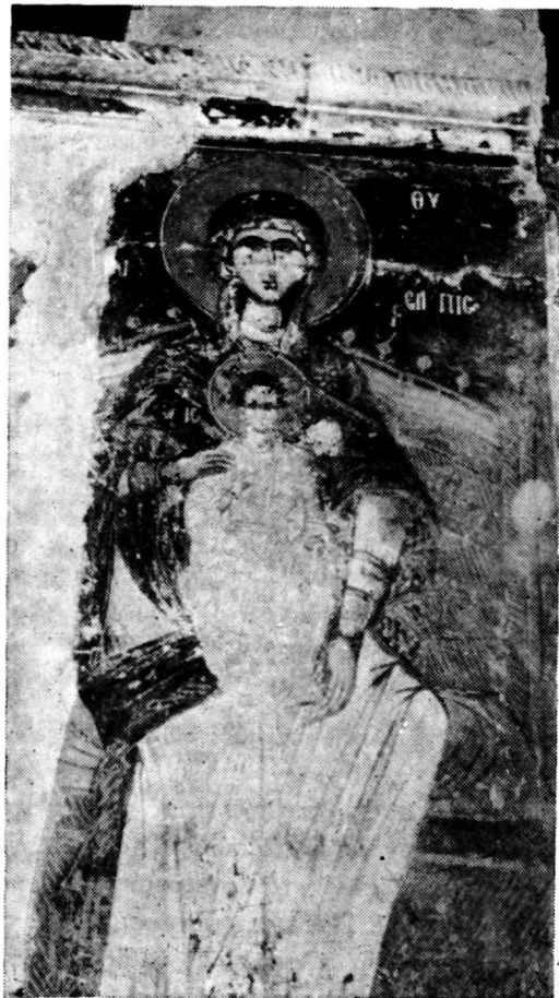
Εἰκὼν 3. Ἡ Παναγία τοῦ ναοῦ τῆς μονῆς Μαλεσίνας