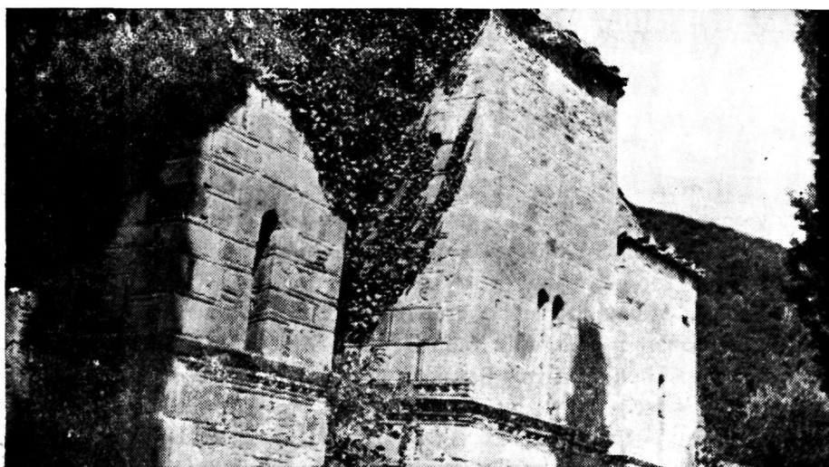
Εἰκὼν 4. Ἀνατολικὴ πλευρὰ τοῦ ναοῦ τῆς μονῆς Ἁγιάς

Ἐσωτερικόν. Ὁ ναὸς φέρει νάρθηκα ἔχοντα ἐπὶ τῆς Ν. καὶ Β. πλευρᾶς ἀνὰ μίαν καμαρωτὴν θύραν σήμερον τετειχισμένας. Ἡ στέγη του εἶναι καμαρωτὴ διακοπτομένη κατὰ τὸ μέσον διὰ σταυροθολίου μὲ ἰσχυρῶς προέχοντα βεργία. Ἐκ τοῦ νάρθηκος πρὸς τὸν κυρίως ναὸν φέρουν τρεῖς θύραι. Ἄνωθεν τῆς κεντρικῆς εἰκονίζεται ἡ Μεταμόρφωσις,