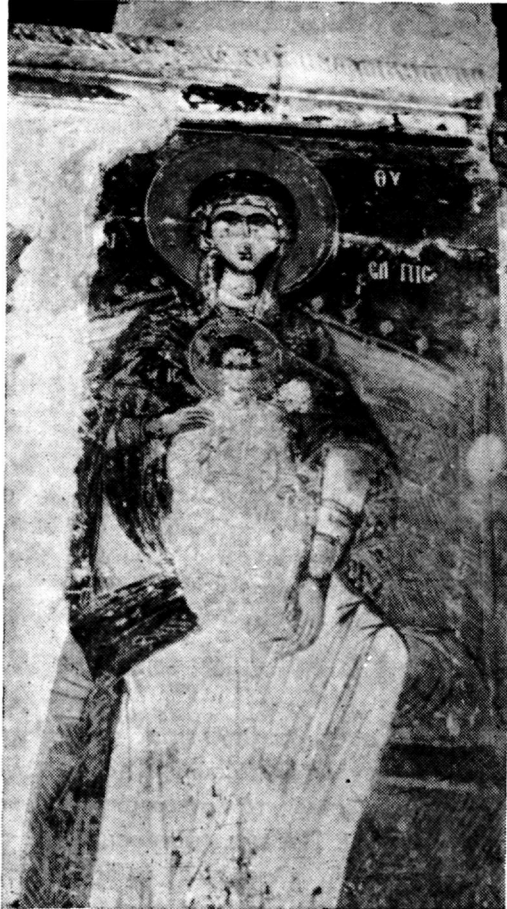
Εἰκὼν 3. Ἡ Παναγία τοῦ ναοῦ τῆς μονῆς Μαλεσίνας