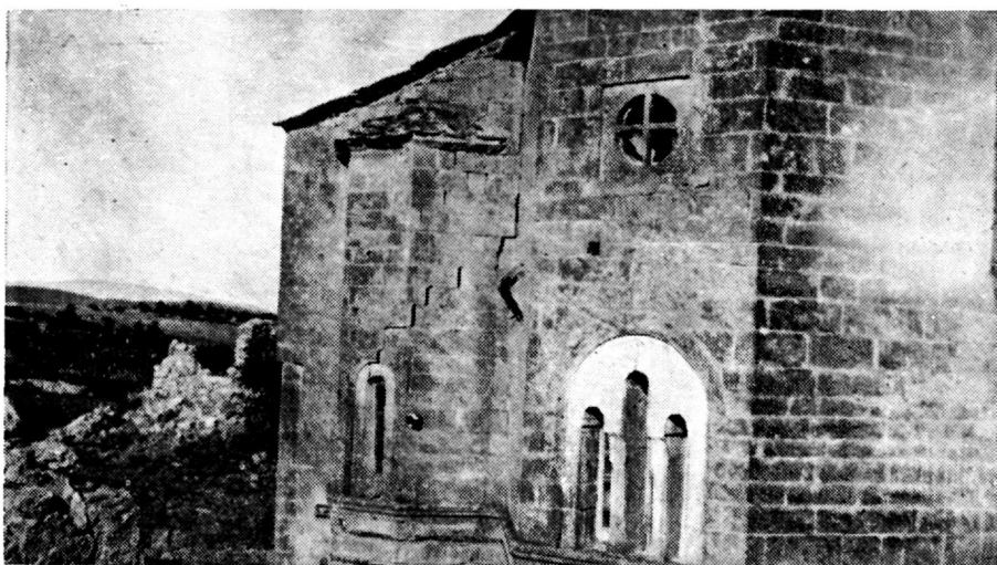
Εἰκὼν 2. Τμῆμα τῆς Ἀνατολικῆς πλευρᾶς τοῦ ναοῦ τῆς μονῆς Μαλεσίνας

ὑποφέρει συχνὰ ἐκ σεισμῶν, ὁ ναὸς ἐνισχύθη δι' ἀντηρίδων δύο ἐφ' ἐκάστης πλευρᾶς νοτίου καὶ βορείου. Αὗται ἐξέχουσι τόσον ἐπὶ τῆς ἐσωτερικῆς ἐπιφανείας τοῦ τοίχου ὅσον καὶ ἐπὶ τῆς ἐξωτερικῆς. Τὰ ἐξωτερικὰ τμήματα τούτων διατηροῦνται μόνον ἐπὶ τῆς Ν. πλευρᾶς. Ἡ οἰκοδομὴ τούτων ὡς καὶ ἀπὸ τῆς βάσεως τῶν παραθύρων τῆς ἀνατολικῆς πλευρᾶς καὶ ἄνω τμήματος εἶναι ἰσοδομικὴ. Εἰς τὴν κορυφὴν τῶν ἀντηρίδων τῆς Ν. πλευρᾶς διακρίνονται αἱ κοιλότητες εἰς ἃς εἶχον τοποθετηθῆ πινακία. Ἐπὶ τῆς πρὸς τὸ Ἱερὸν τῆς νοτίου πλευρᾶς ἀντηρίδος ὑפוῦται ὑπὲρ τὴν στέγην μικρὸν κωδωνοστάσιον. Ἄπασα ἡ ἀνατολικὴ πλευρὰ διατηρεῖται, ὡς ἐλέχθη, ἄκεραία· εἶναι δὲ αὐστηρῶς ἰσοδομικὴ, παρατη-