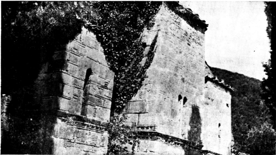
Εἰκὼν 4. Ἀνατολικὴ πλευρὰ τοῦ ναοῦ τῆς μονῆς Ἁγίας

Ἐσωτερικόν. Ὁ ναὸς φέρει νάρθηκα ἔχοντα ἐπὶ τῆς Ν. καὶ Β. πλευρᾶς ἀνὰ μίαν καμαρωτὴν θύραν σήμερον τετειχισμένας. Ἡ στέγη του εἶναι καμαρωτὴ διακοπτομένη κατὰ τὸ μέσον διὰ σταυροθολίου μὲ ἰσχυρῶς προέχοντα βεργία. Ἐκ τοῦ νάρθηκος πρὸς τὸν κυρίως ναὸν φέρουν τρεῖς θύραι. Ἄνωθεν τῆς κεντρικῆς εἰκονίζεται ἡ Μεταμόρφωσις,