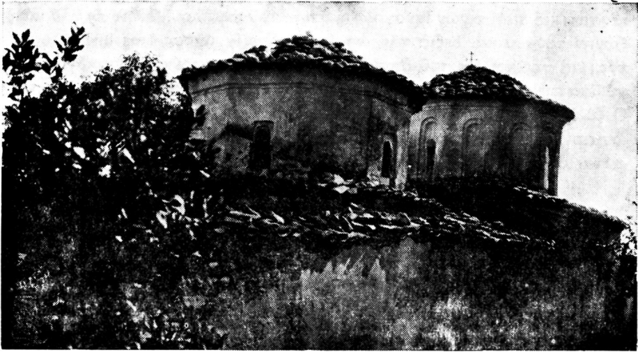
Εἰκὼν 5. Ν.Δ. ἄποψις τοῦ ναοῦ τῆς μονῆς Πανασσαρῆς

ταλαμβάνει ὀστεοφυλάκιον. Τοῦτο σχηματίζεται διὰ δύο μεγάλων πλακῶν μιᾶς καθέτου καὶ τῆς ἄλλης ἥτις χρησιμεύει ὡς κάλυμμα. Ἐπιπέδον δὲ φέρουσιν ἐξωτερικῶς ἀνάγλυφον διάκοσμον. Ἐπιπέδον τῆς ἀντιθέτου πλευρᾶς τοῦ νάρθηκος τῆς νοτίου ὑπάρχει ὁμοία ἀψίς, μικροτέρα ὅμως, καὶ τετράγωνος θύρα ἐντὸς ἄλλου ὁμοίου κοιλώματος. Ἐκ τοῦ νάρθηκος εἰσερχόμεθα διὰ ὀρθογωνίου θύρας εἰς τὸν κυρίως ναόν. Ὁ θόλος τοῦ κυρίου ναοῦ καταλαμβάνει ὅλην σχεδὸν τὴν στέγην. Εἶναι μεγαλύτερος καὶ ὑψηλότερος τοῦ θόλου τοῦ νάρθηκος. Στηρίζεται ὡς καὶ ὁ πρῶτος. Ἐπιπέδον Β. καὶ Ν. πλευρᾶς ἀνοίγονται ἀνὰ ἓν μονόλωρον παράθυρον. Ἀψίς ὑψομένη ἀνατολικῶς φέρει εἰς τὴν κόγχην τοῦ ἱεροῦ. Ἐπιπέδον τῆς