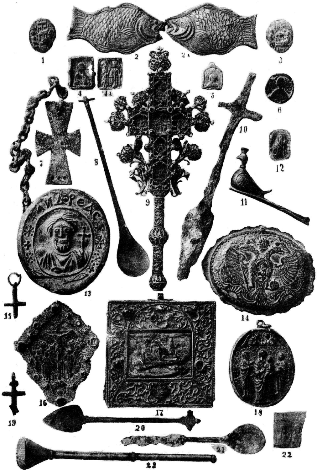
ΠΙΝΑΞ Α'.—Δελτίον Α'. Χριστιανικῆς Ἀρχαιολογικῆς Ἐταιρείας