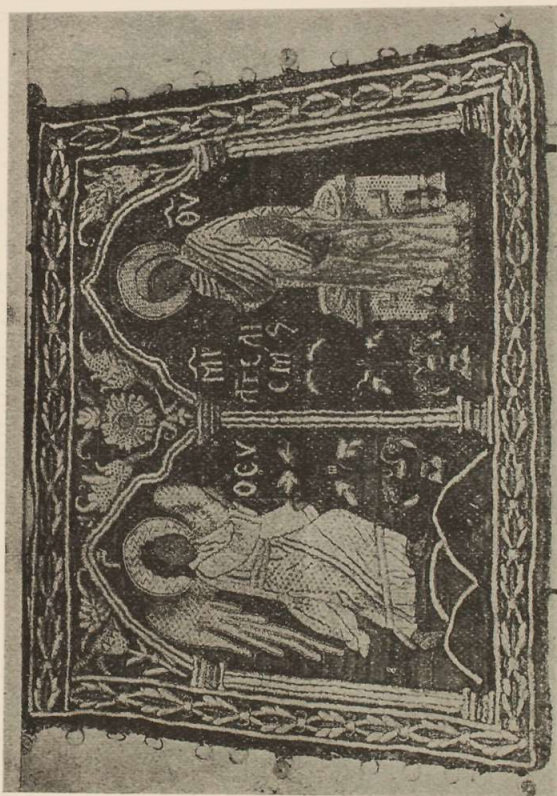
Εἰκ. 6. Λεξιὸν ζωοδόπουτον ὑπομάνικον τοῦ 1642 ἐν ᾧ ὁ Εὐαγγελιστὴς τῆς Θεοτόκου

Ὁ ὑπ' ἀριθ. 2195 ἀρχιερατικὸς σάκκος, οὗ χαρακτηριστικὴν λίαν αἰ βραχεῖαι χειρῖδες, κατὰ τὸν ἀρχαῖον τρόπον, ὅπως φαίνων-