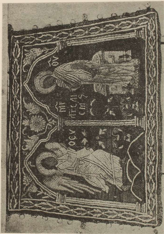
Εἰκ. 6. Λεξιὸν ζωοδόπουτον ὑπομάνικον τοῦ 1642 ἐν ᾧ ὁ Εὐαγγελιστὴς τῆς Θεοτόκου

Ὁ ὑπ' ἀριθ. 2195 ἀρχιερατικὸς σάκκος, οὗ χαρακτηριστικὴν λίαν αἰ βραχεῖαι χειρῖδες, κατὰ τὸν ἀρχαῖον τρόπον, ὅπως φαίνων-