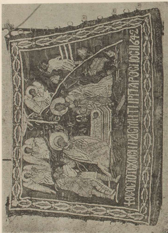
Εἰκ. 1. Ἁγιόπεδον τοῦ ἀποστόλου τοῦ 1642 ἐν ᾧ ἡ Γέννησις τοῦ Χριστοῦ

ἡμῖν μαρμαρίνη πλάξ ὕψ. 1,31 πλ. 0,75, ἐφ' ἧς ἀνάγλυφος παρίσταται Ἰωάννης ὁ Πρόδρομος ἰστάμενος ἐπὶ τριῶν μεσαιωνικῶν οἰκοσήμεων, τὴν μὲν δεξιὰν ἔχων πρὸς τὰ ἄνω (οἱ δάκτυλοι εἰσὶ κατεστραμμένοι), τῇ ἀριστερᾷ δὲ κρατῶν εἰλητάριον, ἐφ' οὗ ἀναγινώσκουμεν τὸ σύνθημα ρητὸν « Μετανοεῖτε.. κλ ».