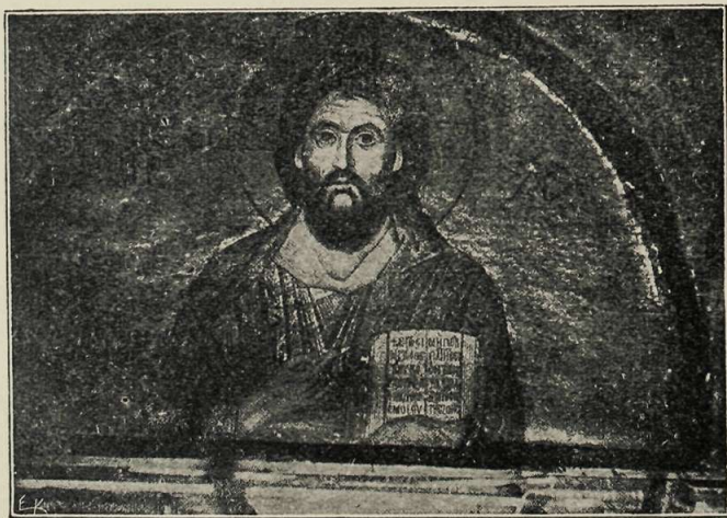
Εἰκὼν τοῦ Ἰησοῦ Χριστοῦ ἐκ μουσαϊακῶν ψηφίδων ἐν τῷ ναῷ τῆς ἐν Λεβαδείᾳ Μονῆς τοῦ Ὁσίου Λουκά.

Ἡ Α. Μ. ἡ Βασίλισσα Ὀλγα. Γύψινα ἀπότυπα τῶν ἐπὶ μαρμάρου ποικίλων κοσμημάτων τοῦ παρὰ τὴν Μητρόπολιν ναοῦ τοῦ Γοργοεπηκόου, νῦν τοῦ Ἀγ. Ἐλευθερίου (ἀρ. 2577—2641).