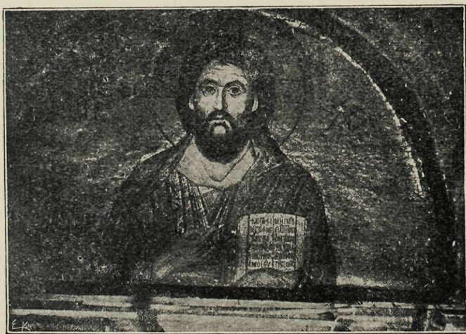
Εἰκὼν τοῦ Ἰησοῦ Χριστοῦ ἐκ μουσαϊακῶν ψηφίδων ἐν τῷ ναῷ τῆς ἐν Λεβαδείᾳ Μονῆς τοῦ Ὁσίου Λουκά.

Ἡ Α. Μ. ἡ Βασίλισσα Ὁλγα. Γύψινα ἀπότυπα τῶν ἐπὶ μαρμάρου ποικίλων κοσμημάτων τοῦ παρὰ τὴν Μητρόπολιν ναοῦ τοῦ Γοργοεπηκόου, νῦν τοῦ Ἀγ. Ἐλευθερίου (ἀρ. 2577—2641).