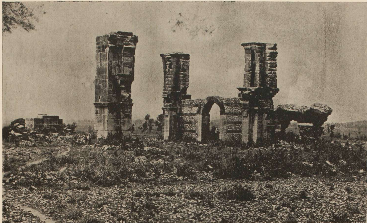
Είχ. 4. — Ρωμαϊκὴ ἀψὶς ἐν μέσῳ τῶν ἐρειπίων τῆς πόλεως Φιλίππων.