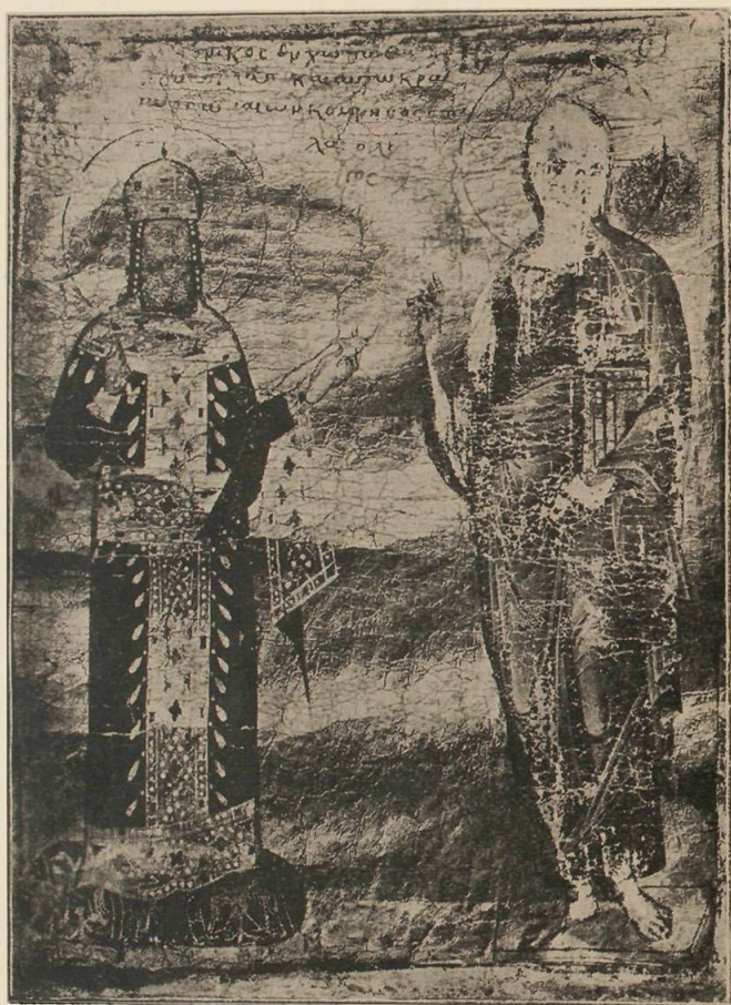
Εικών τοῦ Ἰησοῦ εὐλογούντος τὸν Αὐτοκράτορα Ἀνδρόνικον Παλαιολόγον τὸν Β'—Ἰδὲ σελ. 111 κ. ε.