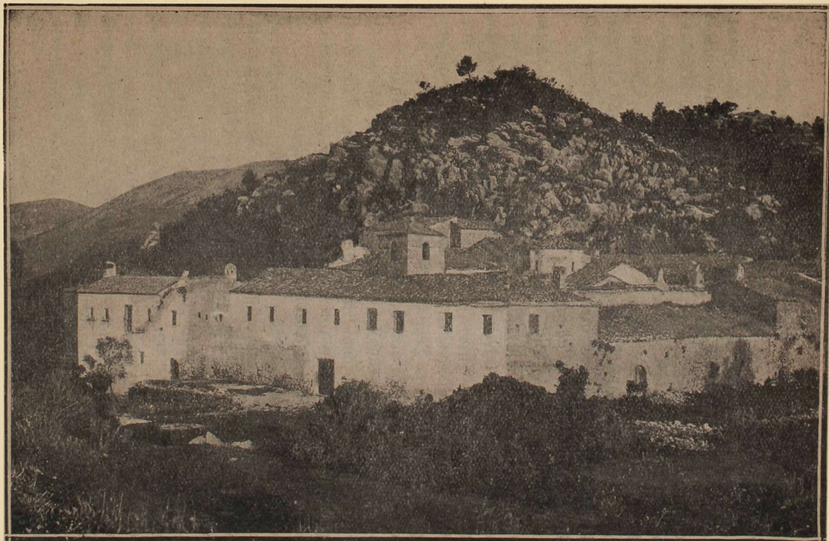
Εικ 1. Ἡ μονὴ ὁδοῦ Μελερίου.