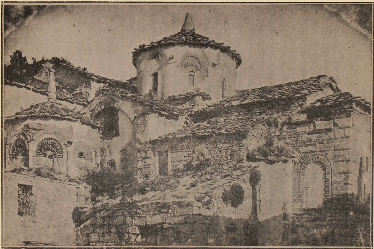
Εικ. 2. Ὁ ναός τῆς μονῆς ὁδίου Μελετίου.