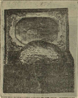
(Εἰκ. 3) Ἡ ἱερὰ κύρα Θεοδώρου τοῦ κόνας εἰς φυσικὸν μέγεθος στρατηλάτου, δωρεὰ Ἀυτοκράτο- ρος τοῦ Βυζαντίου εἰς τὴν Μη- τροπόλιν Σερρών.

δὲ διὰ τριῶν τιμίων κιτριῶν λίθων ἑκάτερος καὶ μετὰ τῆς κοι- νῆς ἐπ' ἀμφοτέρων ἐπιγραφῆς «1772 τῆς Ἑπεραγίας Θεοτόκου Βλαχέρνας—Ἐπιστάτης Δημάκης Ἀμπατζῆ» (*) (Εἰκ. 3).