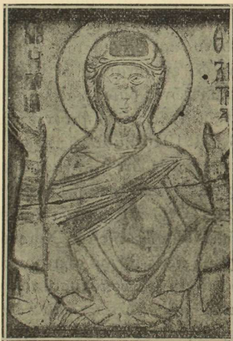
(Εἰκ. 1). Παναγία ἢ Πονολύτρια τῶν Σερρῶν, ἔργον καλῆς τέχνης τοῦ ΙΑ' αἰ.

1) Παναγία ἢ Πονολύτρια τῶν Σερρῶν , ἐπὶ μαρμάρου ἀνάγλυπτος εἰκὼν τῆς Θεοτόκου δεομένης (orante), ἔργον καλὸν τοῦ ΙΑ' αἰῶνος διεσθηγμένη ὀριζοντίως. Εἶνε τὸ ἱερὸν Παλλάδιον τῶν Σερρῶν, τὸ ὁποῖον ὑπέστη ἴσας περιπετείας πρὸς τὸ τῆς Τροίας μυθολογούμενον τοιοῦτον, παρακολουθῆσαν καὶ μετασχὼν πασῶν τῶν περιπετειῶν τῆς πόλεως. (Εἰκ. 1).