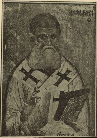
(Εἰκ. 6) Ὁ Ἅγιος Ἀθανάσιος ἐν Ἁγία Μαρίνῃ Σερρῶν. Θαυμασὴ εἰκὼν τοῦ 19' αἰῶνος

ὅστις ἐξωγράφησεν ἅπαντα τὸν Ναὸν καὶ κατήρτισεν ἅπαν τὸ εἰκονοστάσιον ἐν τῇ ἐπὶ τοῦ Παγγαίου ἱερᾷ Μονῇ τῆς Κοσσυφίσεως, ἐκ τῆς ὁποίας μετεκομίσθη εἰς Σέρρας ἡ εἰκὼν αὕτη