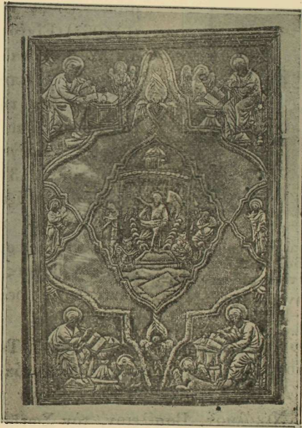
(Εἰκ. 4). Παλαιὸν ἀργυρένδετον Εὐαγγέλιον ἐν τῷ ναφ Παναγίας τῆς Ἀρμενοκρατοῦσας τῶν Σερρών.

των «Τὸ Θεῖον καὶ ἱερὸν Εὐαγγέλιον εἶνε τοῦ Ἁγίου Ταξιάρχου καὶ Παναγίας Ἀρμενοκρατοῦσα. 1770 Ἀπριλίου. Εἰς δὲ καιρὸν Στογιάννου Κανταντζῆ καὶ εἰς καιρὸν ἡφμερίου Παπαπανταζῆν Οἰκονόμου (Εἰκ. 4).