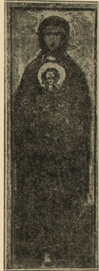
(Εἰκ. 7) Ἡ Θεοτόκος, ἔργον τοῦ περιφημοῦ ἀγιογράφου Πανδελίνου ἐν τῇ ἱερᾷ μονῇ Κοδωνιδίσεως ἐπὶ τοῦ Παγγαίου

χάριν τῆς τῇ 8 Σεπτεμβρίου τελουμένης ἐνταῦθα ἀπ' αἰῶνων μεγάλης ἐτησίας πανηγύρεως ἐν τῷ Ναῷ Παναγίας τῆς Ἡλιόκαλης ἀνήκοντι εἰς τὴν ρηθεῖσαν Μονήν. (122×43) (Εἰκ. 7).