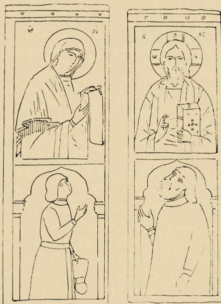
Εικ. 3 Θύραι ἱεροῦ ἐν τῇ ἀγιορει- τικῇ Μονῇ Ἰβήρων (Παρεκκλ. Προδρομοῦ).

Τὸ ἐνταῦθα παρατιθέμενον σχέδιον (Εικ. 2) παρέχει ἰδέαν τῆς μορφῆς, ἣν παρουσίαζε πιθανῶς ἡ εἰκὼν τοῦ Καίρου πρὸ τῆς