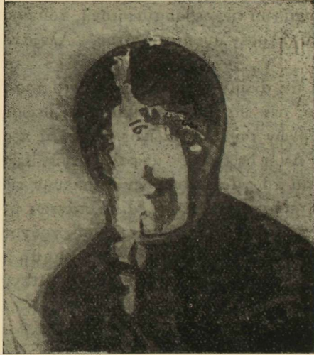
Εἰκ. 6 Λεπτομέρεια τῆς εἰκόνας I

χνικῆς τῆς εἰκόνας. Λεπτομερῆς ἐξέτασις αὐτῆς ὀδηγεῖ εἰς τὴν παρατήρησιν, ὅτι οὐδαμοῦ σχεδὸν—πλὴν μόνον ἐλαχίστων μερῶν τοῦ ἐνδύματος—ἔχει γίνῃ χρῆσις φωτοσκιάσεως. Αἱ λεπτομέρειαι ἰδίᾳ τοῦ προσώπου ἔχουσιν ἀποδοτῆ σχεδὸν ἀποκλειστικῶς διὰ γραμμῶν, τὸ πᾶν δὲ καθορίζεται διὰ περιγραμμάτων,