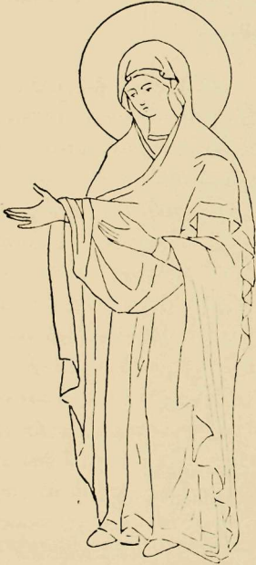
Εἰκ. 4 Εἰκὼν τῆς Γεροντίδος ἐν τῇ ἀγιορειτικῇ Μονῇ Παντοκράτορος

Ἄληθῶς ἡ εἰκὼν αὕτη ἀπετέλει ποτὲ μέρος παραστάσεως τῆς Δείσεως, ἀλλὰ ὑπὸ συνθήκας διαφορετικῆς. Πράγματι ὁ Μαζαράκης ἐξέφερε τὴν εἰκασίαν ὅτι ἡ εἰκὼν ἐχρησίμευεν ὡς θύρα