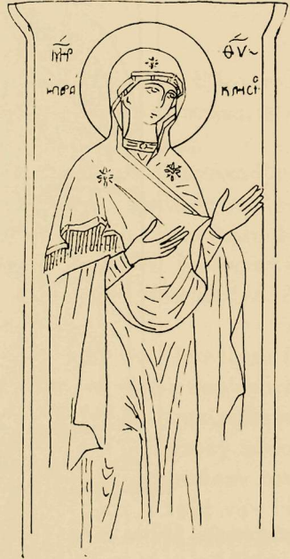
Εἰκ. 5 Τοιχογραφία τῆς Θεοτόκου ἐν τῇ μονῇ Ἁγ. Στεφάνου Μετεώρων, (Παρεκκλ. Ἁγίου Στεφάνου)

ιεροῦ καταστραφείσης ἐκκλησίας. Ἡ εἰκασία αὕτη, ἣν ὁ Μαζαράκης ἐξέφερον ἔχων ὑπ' ὄψει τοῦ τὴν εἰκόνα ὡς αὕτη ἔχει σημεῖον, ὅποτε τὸ πρᾶγμα βεβαίως δὲν θὰ ἦτο πολὺ πιθανόν, εἶναι σχεδὸν βεβαία διὰ τὴν ἀρχικὴν εἰκόνα, ὡς ἀποδεικνύουν ἀνάλογα παραδείγματα.