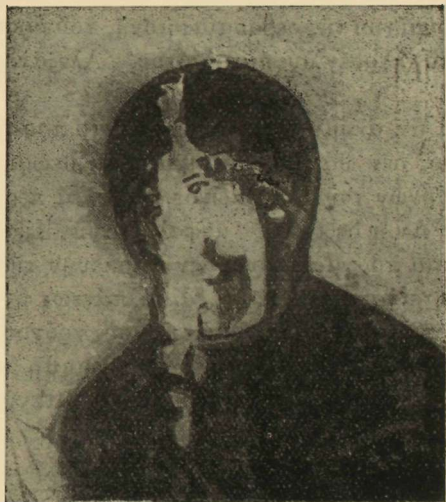
Εἰκ. 6 Λεπτομέρεια τῆς εἰκόνας I

χνικῆς τῆς εἰκόνας. Λεπτομερῆς ἐξέτασις αὐτῆς ὀδηγεῖ εἰς τὴν παρατήρησιν, ὅτι οὐδαμοῦ σχεδὸν—πλὴν μόνον ἐλαχίστων μερῶν τοῦ ἐνδύματος—ἔχει γίνῃ χρῆσις φωτοσκιάσεως. Αἱ λεπτομέρειαι ἰδίᾳ τοῦ προσώπου ἔχουσιν ἀποδοτῆ σχεδὸν ἀποκλειστικῶς διὰ γραμμῶν, τὸ πᾶν δὲ καθορίζεται διὰ περιγραμμάτων,