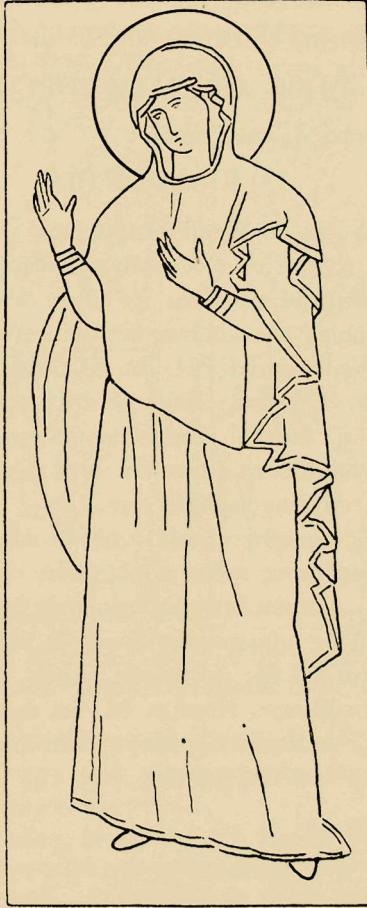
Εἰκ. 2. Πιθανὴ ἀρχικὴ μορφή εἰκόνας τοῦ Καΐρου.

ρίου Ουспенσκυ κατά τὸ ἔτος 1855 κατόπιν δὲ λησιμονηθεῖσα ἀνευρέθη ἐκ νέου ὑπὸ τοῦ Παπαδοπούλου-Κεραμέως εἰς τὸ ἐν