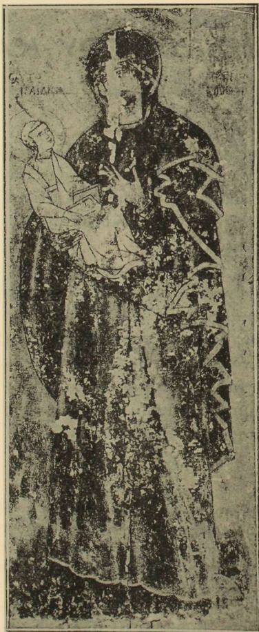
Εἰκ. 1. Εἰκὼν τῆς Θεοτόκου ἐν τῇ Συλλογῇ τοῦ Ἑλλ. Πατριαρχίου Καίρου.

*Η νεωτέρα ἱστορία τῆς εἰκόνης κατὰ τὸν Νεροῦτσον (1) ἔχει ὡς ἐξῆς : Αὕτη ἀνεκαλύφθη τὸ πρῶτον ὑπὸ τοῦ Πορφυ-