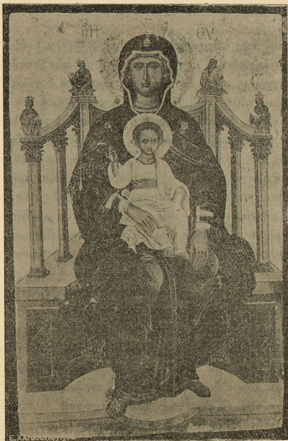
Εἰκ. 2. Δεσποτική εἰκὼν τῆς Θεοτόκου ποιηθεῖσα ὑπὸ Ἑμμ. Τζάνε (1680).

2). Εἰκὼν τῆς Θεοτόκου ἐν προτομῇ φέρουσα τὴν ἐπιγραφὴν ( \overline{\text{MP}} \overline{\text{ΘΥ}} \text{ Η ΗΛΙΟΚΑΛΛΟΣ} ) καὶ προερχομένη ἐκ τῆς ἐν Σαλαμῖνι Μ. Φανερωμένης. (0,87×0,62 μ.).