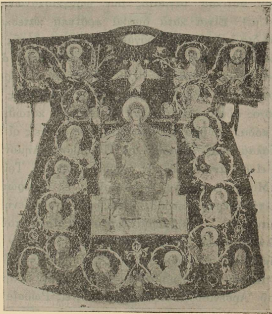
Εἰκ. 3. Ἀρχιερατικὸς σάκκος, δειγμα μεταβυζαντινῆς ὑφαντουργίας.

1) Ὁράριον βυζαντινῶν πιθανῶς χρόνων. Τὸ ἄμφιον τοῦτο τοῦ Διακόνου εἶναι ἐφάμιλλον εἰς τὸ σχέδιον καὶ τὴν λεπτότητα