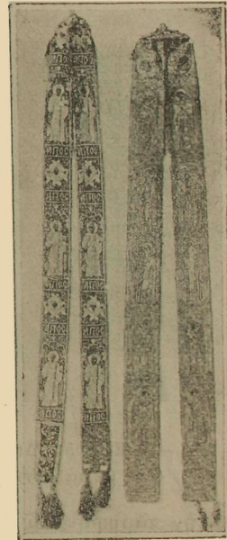
Εἰκ. 4 Βυζαντινὸν και μεταβυζαντινὸν Ὁράριον τοῦ διακόνου.

6) Ἄμφια ἐξ εὐρωπαϊκῶν ὑφασμάτων. Ταῦτα εἶναι δείγματα τῶν ἐξ εὐρωπαϊκῶν ἐργαστηρίων εἰσαγομένων ἄλλοτε πολυτελῶν ὑφασμάτων (τῶν γνωστῶν ὡς στόφες ἐν Ἑλλάδι) ὑπὸ ὁμογενῶν ἀγοραζομένων και προσφερομένων κατὰ τὸ πλεῖστον εἰς Μονὰς ἢ Ἐκκλησίας ὡς ἀναθήματα· προέρχονται δὲ ἐξ ἐργαστηρίων τῆς Γαλλίας και Ἰταλίας ἀγοραζόμενα συνήθως ἐκ Μασσαλίας, Βενετίας και Τεργέστης.