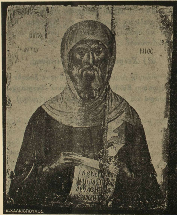
Εἰκ. 1. Εἰκὼν τοῦ Ἀγ. Ἀντωνίου ποιηθεῖσα ὑπὸ Μιχ. Δαμασκηνοῦ (1491—1525).

Ὅσον ἀφορᾷ τὰς φορητὰς ἐπὶ σανίδος εἰκόνας , ἡ συλλογὴ