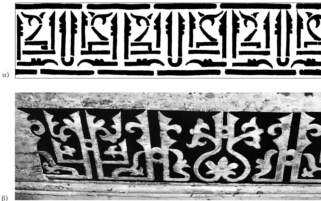
Εἰκ. 1. Τά πρότυπα στήν μονή τοῦ Ὁσίου Λουκά: α) κεραμεικές ζωφόροι ἀπό τόν ναό τῆς Παναγίας (R. W. Schultz - S. H. Barnsley), β) διάκοσμος σαρκοφάγου στήν κρύπτη τοῦ καθολικοῦ (ἐπεξεργασμένη φωτογραφία).

Αὐλωναρίου 18 . Στήν Πελοπόννησο τά ψευδοκουφικά τῶν τοίχων εἶναι μεμονωμένα καί σχετικῶς ἄτεχνα. Ἀπαντοῦν στούς ναούς τῆς Ἀργολίδος (Λιγουριό 19 , Χώνικα 20 καί Πλατανίτι 21 ), στήν Παναγιά τοῦ Στεῖρη 22 , στόν Ἅγιο Χαράλαμπο Καλαμάτας 23 , στό Ἄνδρομονάστηρο 24 καί τόν Ἅγιο Δημήτριο στό Δραγάνο 25 . Ἐκτός τῶν ὀρισμένων αὐτῶν περιοχῶν ὑπάρχουν δύο μόνον παραδείγματα: Στήν Βλαχέρνα τῆς Ἄριτας 26 καί στούς Ἁγίους Ἰάσονα καί Σωσίπατρο στήν Κέρκυρα 27 . Ἡ ἐξέταση τῆς μορφῆς τῶν κεραμεικῶν αὐτῶν ὀδηγεῖ στήν διαπίστωση ὅτι τά χαρακτηριστικά σχήματα τῶν