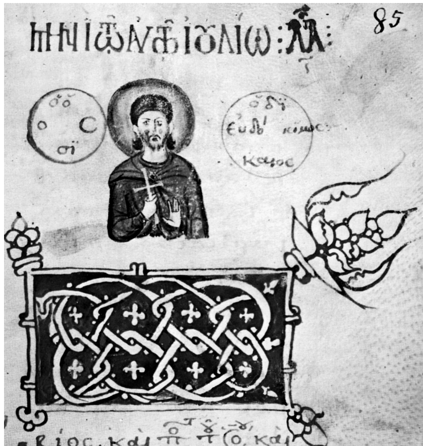
Fig. 2. Athos Dionysiou 50, fol. 85r. Saint Eudokimos, 14e siècle (Οἱ ἠθσαυροὶ τοῦ Ἁγίου Ὁρους (n. 76), image no. 100).

voit tel dans le code Athos Dionysiou 50, fol. 85r (Fig. 2). La miniature porte l'inscription ὁ ὄσιος Εὐδόκιμος ὁ δίκαιος 76 . Il est clair que le peintre était un peu confus en ce qui concerne l'état civil d'Eudokimos. Le saint est représenté en jeune homme portant une barbe courte, vêtu d'une tunique et d'un manteau. Dans un στιχηράριον de la Mégistè Lavra (Athos Lavra Λ 164, fol. 368r) datant des XVIIe-XVIIIe siècles, on retrouve le même type iconographique, à la différence que le saint est beaucoup plus âgé 77 .