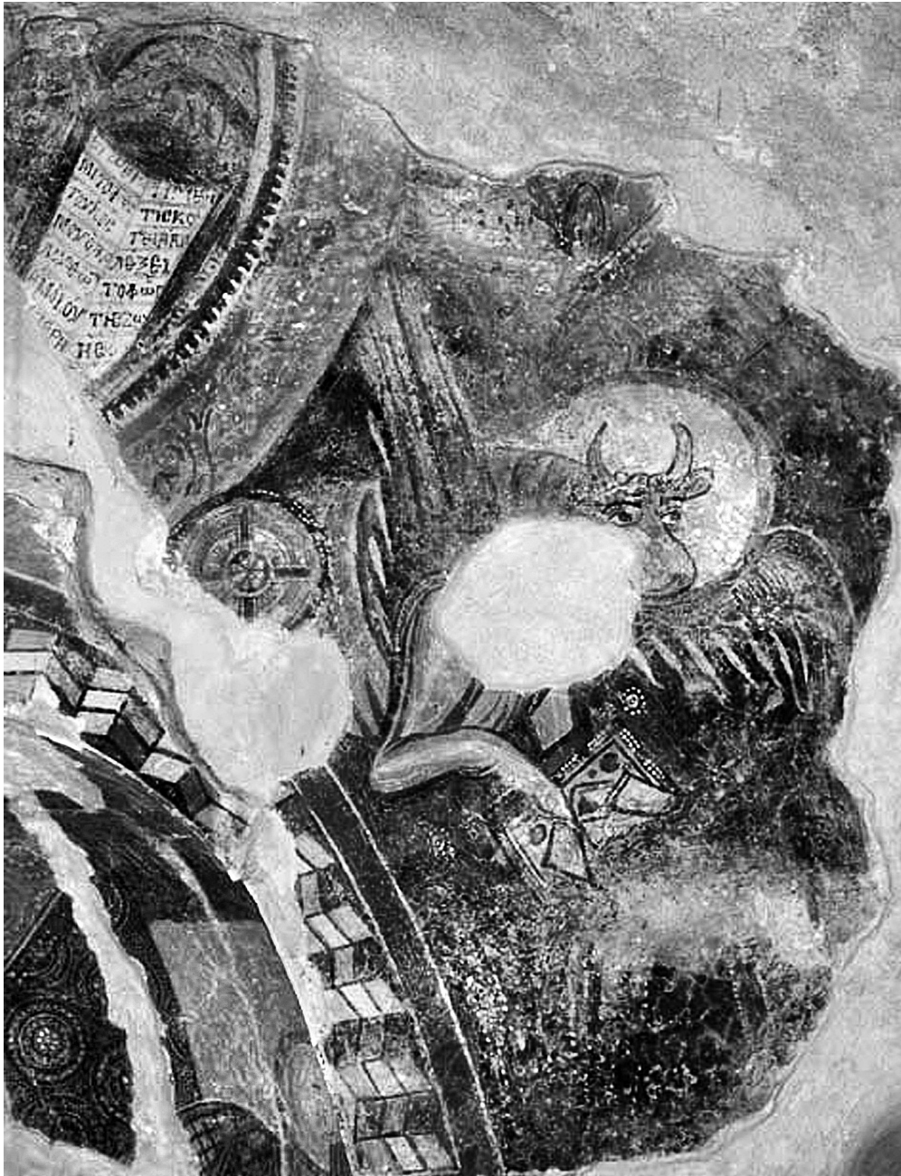
Εικ. 1. Άνω Κορακιάνα Κερκύρας, ναός Άϊ-Μιχαήλη. Θεοφάνεια ανατολικού αετώματος. Τò εὐαγγέλιο τοῦ Χριστοῦ καὶ ὁ μύσχος.

Στὰ ἄκρα τοῦ αετώματος εἰκονίζονται δύο χερουβείμ με ἀπλωμένα χέρια, με μορφή ἀγγέλου ἀπὸ τὸ στήθος καὶ πάνω καὶ με διασταυρούμενα φτερὰ ἀντὶ ποδιῶν. Καλύτερα διατηρεῖται τὸ ἀριστερό (Εἰκ. 2). Ἔχει στρογγυλὸ πρόσωπο, χαμηλὸ μέτωπο καὶ πλάγιο βλέμμα. Δὲν σώζεται τὸ κάτω τμήμα τοῦ δεξιοῦ χερουβείμ, τὸ ὁποῖο