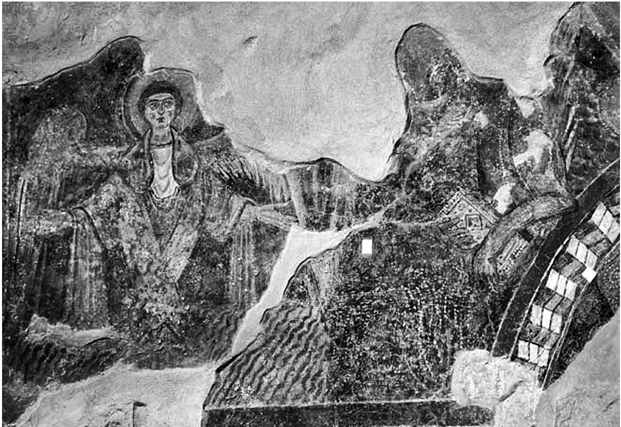
Εἰκ. 2. Ἄνω Κορακιάνα Κερκύρας, ναὸς Ἁϊ-Μιχαήλη. Τὸ βόρειο ἄκρο τοῦ ἀνατολικοῦ ἀετώματος.

σχηματίζει ἀποπτύγματα στοὺς ὤμους, καὶ τοῦ ὁποίου τὰ ἄκρα κρέμονται ἀπὸ τὰ χέρια. Χαμηλότερα σώζεται ἀποσπασματικὰ μίμηση ὀρθομαρμαρώσεως.