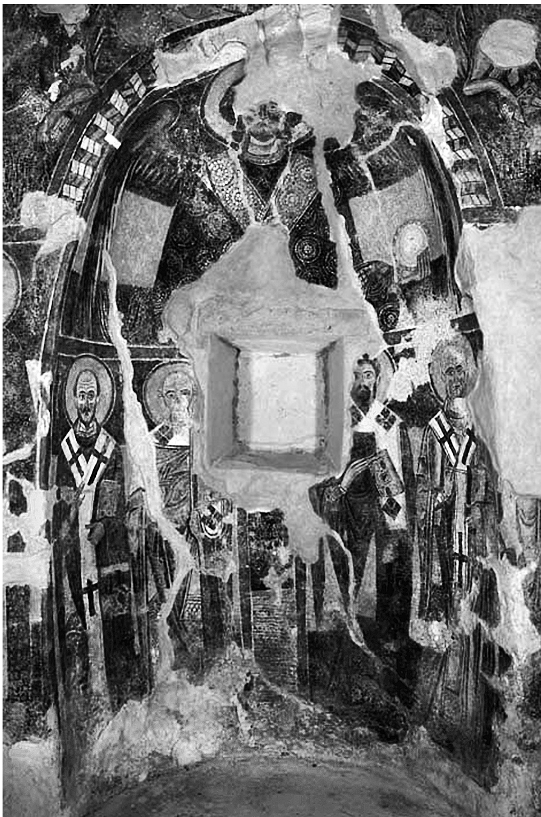
Εικ. 4. Άνω Κοραζιάνα Κερκύρας, ναός Άϊ-Μιχαήλη. Οι τοιχογραφίες τῆς ἀψίδος.