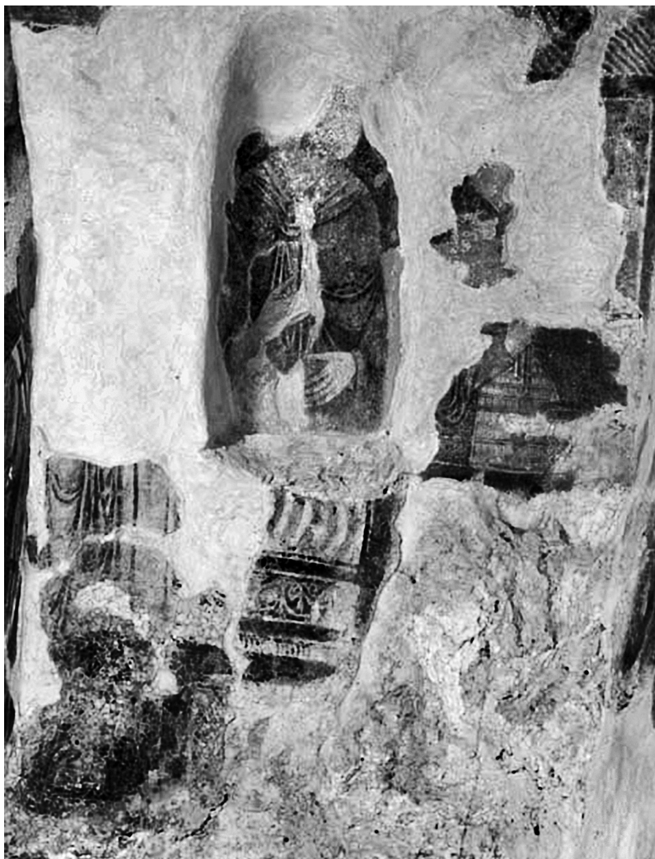
Εἰκ. 8. Ἄνω Κορακιάνα Κερκύρας, ναὸς Ἁϊ-Μιχαήλ. Τὸ νότιο τμήμα τῆς ἀνατολικῆς πλευρᾶς μὲ τὸν Πρόδρομο καὶ τὸν ἅγιο Θεόδωρο.

αὐλικὰ ροῦχα εἶναι κατάφορτα μὲ μικροσκοπικὰ διακοσμητικὰ σχέδια: διασταυρούμενες γραμμὲς ποὺ περικλείουν σταυρούς, κύκλους ἢ κάθετες γραμμὲς, καὶ τετράγωνα μὲ μαργαριτοκόσμητες ταινίες ἀνάμεσά τους. Οἱ φωτιστέφανοι, χρώματος ὄχρας, ἔχουν διπλὴ παρυφή: λευκὴ ἐξωτερικὰ καὶ καστανέρουθρη ἐσωτερικὰ.