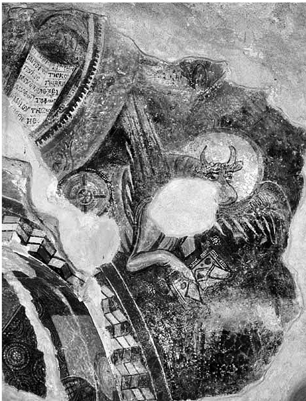
Εικ. 1. Άνω Κορακιάνα Κερκύρας, ναός Άϊ-Μιχαήλη. Θεοφάνεια ανατολικού αετώματος. Τò εὐαγγέλιο τοῦ Χριστοῦ καὶ ὁ μόσχος.

Στὰ ἄκρα τοῦ αετώματος εἰκονίζονται δύο χερουβεὶμ με ἀπλωμένα χέρια, με μορφή ἀγγέλου ἀπὸ τὸ στήθος καὶ πάνω καὶ με διασταυρούμενα φτερὰ ἀντὶ ποδιῶν. Καλύτερα διατηρεῖται τὸ ἀριστερό (Εἰκ. 2). Ἔχει στρογγυλὸ πρόσωπο, χαμηλὸ μέτωπο καὶ πλάγιον βλέμμα. Δὲν σῶζεται τὸ κάτω τμήμα τοῦ δεξιοῦ χερουβεὶμ, τὸ ὁποῖο