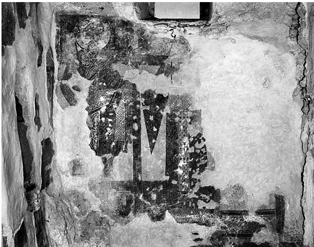
Εἰκ. 9. Ἀνω Κορακιάννα Κερκύρας, ναὸς Ἁϊ-Μιχαήλη. Ἡ νοτιὰ πλευρὰ τοῦ Ἱεροῦ.

ζωγραφικὴ τοῦ 5ου-6ου αἰῶνος 18 καὶ ἀπαντᾶ συχνὰ στὶς ἀψίδες παλαιοχριστιανικῶν ναῶν 19 . Ἐπιζεῖ μέχρι τὸν 13ο αἰῶνα στὴν Καππαδοκία 20 καὶ μέχρι τὸν 14ο αἰῶνα στὴν γειτονικὴ Κάτω Ἰταλία, ὅπου ζωγραφίζεται εἴτε στὸ ἀνατολικὸ ἀέτωμα, εἴτε στὴν ἐπίπεδη ὀροφὴ ὑποσκάφων ναῶν 21 . Στὴν Ἑλλάδα τὸ μόνο ἄλλο γνωστὸ μεσοβυζαντινὸ παράδειγμα εἶναι τοῦ ναοῦ τοῦ Ἁγίου Μερκουρίου στὸ γειτονικὸ χωριὸ Ἅγιος Μάρκος τῆς Κερκύρας, χρονολογημένου στὸ 1074/5, ὅπου καταλαμβάνει τὴν ἴδια θέση στὸ ἀνατολικὸ ἀέτωμα. Ἡ μόνη