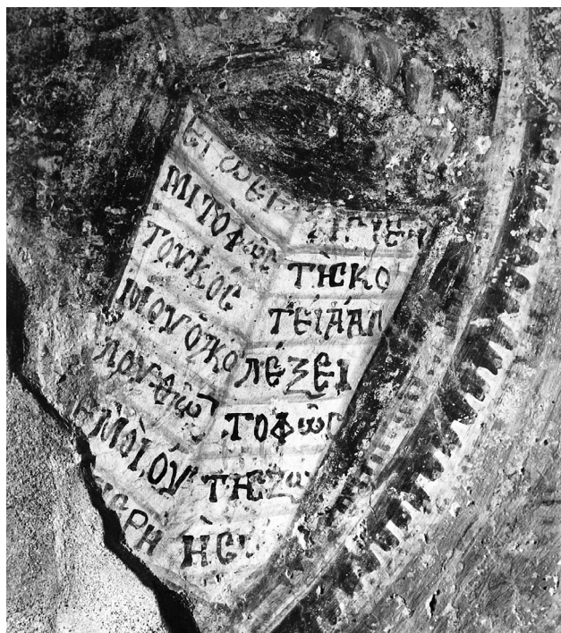
Εἰκ. 3. Ἀνω Κορακιὰνα Κερκύρας, ναὸς Ἁϊ-Μιχαήλη. Ἀνατολικὸ ἀέτωμα. Τὸ εὐαγγέλιο τοῦ Χριστοῦ.

Ἡ ἐπιγραφή παρουσιάζει πολλὲς ὁμοιότητες με τὸ εὐαγγελικὸ χωρίο στὸ βιβλίο πὸν κρατεῖ ὁ Χριστός. Τὰ