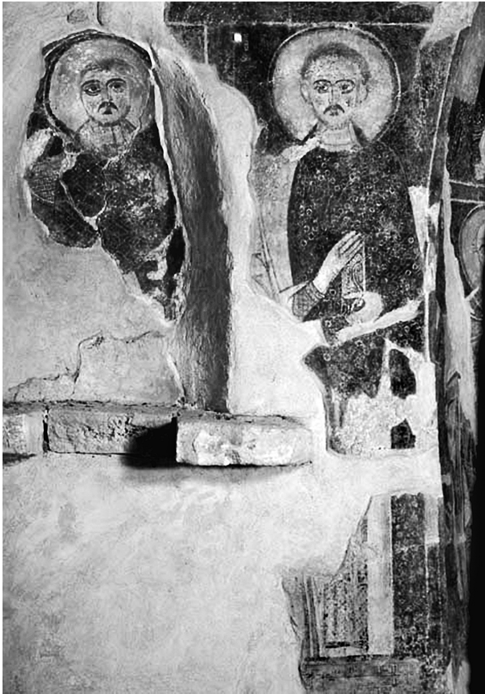
Εικ. 7. Άνω Κορακιάνα Κερκύρας, ναὸς Ἁϊ-Μιχαήλη. Οἱ ἅγιοι Κοσμάς καὶ Δαμιανὸς στὸ βόρειο τμήμα τῆς ἀνατολικῆς πλευρᾶς.

θαίου στρατιωτικοῦ ἁγίου (Εἰκ. 8). Σύμφωνα με τὴν ἡμεξίτηλη ἐπιγραφή εἶναι ὁ ἅγιος ΘΕ[Ο]ΔΩΡΟ[Σ]. Στὸν νότιο τοῖχο τοῦ Ἱεροῦ παριστάνονται ὀλόσωμοι κατὰ μέτωπον οἱ ἅγιοι Κωνσταντῖνος καὶ Ἑλένη. Φο-