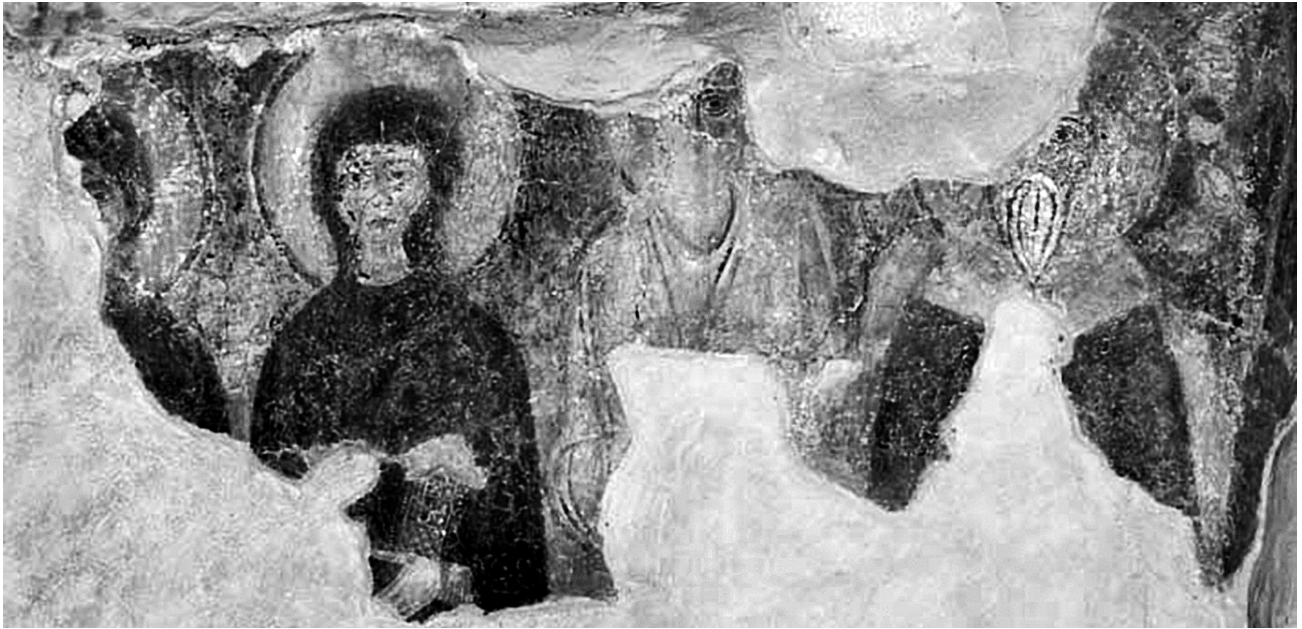
Εικ. 10. Άνω Κορακιάνα Κερκύρας, ναός Άϊ-Μιχαήλη. Ή βορεία πλευρά του Ίερού.

χοί. Πιο πέρα στέκονται δύο έξαπτέρυγα και οι προφήτες Δανιήλ και Ίεζεκιήλ, πού λείπουν από τις δύο κερκυραϊκές Θεοφάνειες. Κρατούν ειλητάρια με χωρία από τις προφητείες τους (Δαν. 7,2-9 και Ίεζ. 2,1). Στόν Άγιο Βλάσιο της περιοχής Salve κοντά στην Leuca διακρίνονται πάνω από την κόγχη παλαιότερας φάσεως λείψανα μορφής σε μετάλλιο πού εύλογεί, φερών και τροχών, άδηλου χρονολογίας 24 . Στό άέτωμα του ναΐσκου του Άγίου Νικολάου στό Celsorizzo, του 1283, ό Χριστός σε μετάλλιο κρατεί πορφυρό ειλητάριο και πλαισιώνεται από τά εύαγγελικά σύμβολα και σεραφεϊμ ή χερουβεϊμ 25 , ένώ στην άψίδα του San Vito Vecchio κοντά στην Gravina di Puglia, του τέλους του 13ου αιώνας, ό Χριστός έν δόξη εικονίζεται σε μετάλλιο πού κρατούν τέσσερις άγγελιοι 26 . Στόν όψιμώτερο Σωτήρα της Sanarica τό ανατολικό άέτωμα καταλαμβάνουν λείψανα Θεοφανείας με μετάλλιο πού περιβάλλεται από τά ζώδια, των άρχών ίσως του 15ου αιώνας, ένώ στην