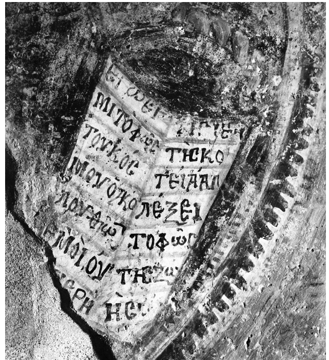
Εἰκ. 3. Ἀνω Κορακιὰνα Κερκύρας, ναὸς Ἁϊ-Μιχαήλη. Ἀνατολικὸ ἀέτωμα. Τὸ εὐαγγέλιο τοῦ Χριστοῦ.

Ἡ ἐπιγραφή παρουσιάζει πολλὲς ὁμοιότητες με τὸ εὐαγγελικὸ χωρίο στὸ βιβλίο πὸν κρατεῖ ὁ Χριστός. Τὰ