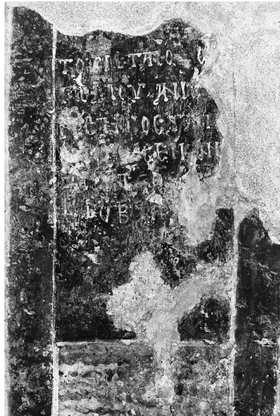
Εικ. 6. Άνω Κορακιάνα Κερκύρας, ναός Άϊ-Μιχαήλη. Η επιγραφή της άψίδος.

Οί μικρές κόγχες εκατέρωθεν της κεντρικής ανοίγονται σὲ διαφορετικὸ ὕψος. Ἡ βόρεια ἔχει ὕψος 89, πλάτος 50 καὶ βάθος 28 ἐκ., ἐνῶ ἡ νότια, ποὺ βρίσκεται λίγο ψηλότερα, διαστάσεων 90×42, εἰσέχει κατὰ 25 ἐκ. Στὴν κόγχη τῆς προθέσεως εἰκονίζεται σὲ προτομή μυστακοφόρος ἅγιος μὲ κοντὸ γένι, ποὺ φορεῖ κατὰκοσμο μανδύα καὶ κρατεῖ νάρθηκα στὸ ἀριστερὸ χέρι (Εἰκ. 7). Τὸ κάτω τμήμα τῆς μορφῆς καὶ ὁ κάμπος μὲ τὸ ἀγιωνύμιο ἔχουν καταστραφεῖ, μποροῦμε ὅμως νὰ εἰκάσωμε ὅτι πρόκειται γιὰ τὸν ἅγιο Κοσμά, μὴ πού δίπλα εἰκονίζεται, ὅπως θὰ δοῦμε ἀμέσως, ὁ ἅγιος Δαμιανός.