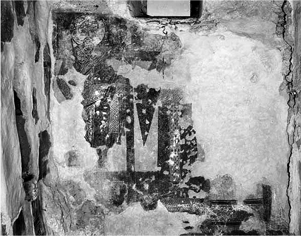
Εἰκ. 9. Ἀνω Κορακιάννα Κερκύρας, ναὸς Ἁϊ-Μιχαήλη. Ἡ νοτιὰ πλευρὰ τοῦ Ἱεροῦ.

ζωγραφική τοῦ 5ου-6ου αἰῶνος 18 καὶ ἀπαντᾶ συχνὰ στὶς ἀψίδες παλαιοχριστιανικῶν ναῶν 19 . Ἐπιζεῖ μέχρι τὸν 13ο αἰῶνα στὴν Καππαδοκία 20 καὶ μέχρι τὸν 14ο αἰῶνα στὴν γειτονικὴ Κάτω Ἰταλία, ὅπου ζωγραφίζεται εἴτε στὸ ἀνατολικὸ ἀέτωμα, εἴτε στὴν ἐπίπεδη ὀροφὴ ὑποσκάφων ναῶν 21 . Στὴν Ἑλλάδα τὸ μόνο ἄλλο γνωστὸ μεσοβυζαντινὸ παράδειγμα εἶναι τοῦ ναοῦ τοῦ Ἁγίου Μερκουρίου στὸ γειτονικὸ χωριὸ Ἅγιος Μάρκος τῆς Κερκύρας, χρονολογημένου στὸ 1074/5, ὅπου καταλαμβάνει τὴν ἴδια θέση στὸ ἀνατολικὸ ἀέτωμα. Ἡ μόνη