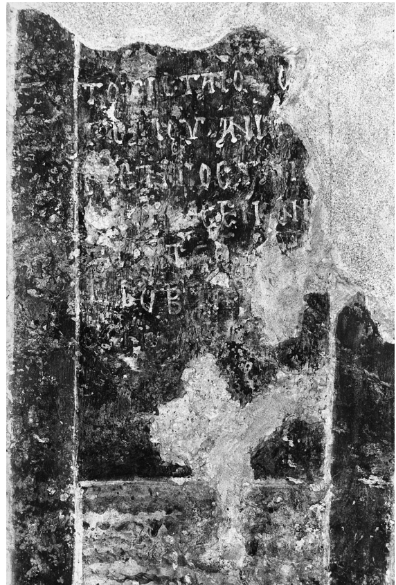
Εικ. 6. Άνω Κορακιάνα Κερκύρας, ναός Αϊ-Μιχαήλη. Η επιγραφή της άψίδος.

Οί μικρές κόγχες εκατέρωθεν της κεντρικής ανοίγονται σὲ διαφορετικὸ ὕψος. Ἡ βόρεια ἔχει ὕψος 89, πλάτος 50 καὶ βάθος 28 ἐκ., ἐνῶ ἡ νότια, ποὺ βρίσκεται λίγο ψηλότερα, διαστάσεων 90×42, εἰσέχει κατὰ 25 ἐκ. Στὴν κόγχη τῆς προθέσεως εἰκονίζεται σὲ προτομή μυστακοφόρος ἅγιος μὲ κοντὸ γένι, ποὺ φορεῖ κατὰκοσμο μανδύα καὶ κρατεῖ νάρθηκα στὸ ἀριστερὸ χέρι (Εἰκ. 7). Τὸ κάτω τμήμα τῆς μορφῆς καὶ ὁ κάμπος μὲ τὸ ἀγιωνύμιο ἔχουν καταστραφεῖ, μποροῦμε ὅμως νὰ εἰκάσωμε ὅτι πρόκειται γιὰ τὸν ἅγιο Κοσμά, μὴ πού δίπλα εἰκονίζεται, ὅπως θὰ δοῦμε ἀμέσως, ὁ ἅγιος Δαμιανός.