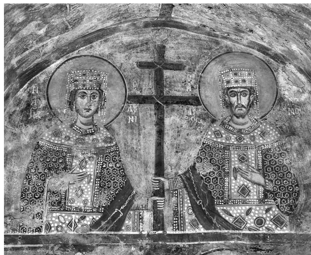
Εικ. 4. Λακωνία, Παναγία Χρυσοαφίτισσα. Άγιοι Κωνσταντίνος και Ελένη (J. P. Albani, Die Byzantinischen Wandmale reien der Panagia Chrysaphitissa Kirche in Chrysapha/Lakonien, Αθήνα 2000, πίν. 7).

χνουν τα περισσότερα από τα παράλληλα που μπορεί κανείς να παραθέσει, όπως στην Παναγία Χρυσοαφίτισσα στη Λακωνία, στη Gračanica και, ανάμεσα στα πρωιμότερα, στον Όσιο Λουκά, στην Ασίνο, στον Άγιο Νεόφυτο στην Πάφο και στο Kurbinovo, το 13ο αιώνα έχει πια ήδη διαμορφωθεί και επικρατήσει συγκεκριμένος εικονογραφικός και φυσιογνωμικός τύπος για τον Κωνσταντίνου. Οι εξαιρέσεις, όπως αυτή του Πρωτάτου, θα πρέπει ίσως να αντιμετωπιστούν ως τέτοιες και να ερμηνευθούν ανάλογα (σε σχέ-