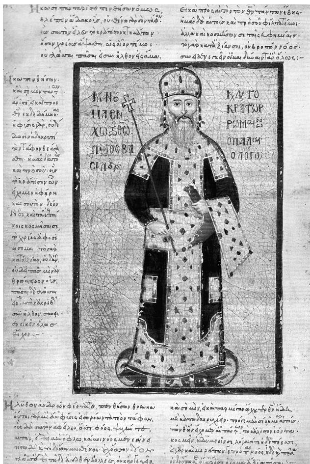
Εικ. 5. Paris sup. grec 309, fol. 6r. Μανουήλ Β΄ Παλαιολόγος (Byzantium: Faith and Power (1261 1557), κατάλογος έκθεσης, Νέα Υόρκη 2004, 26).

κράτορα ως δωρητή των τοιχογραφιών. Μένει τώρα να εξετάσουμε αν αυτός είναι ο Ανδρόνικος Β΄ Παλαιολόγος, ο οποίος, όπως οι περισσότερες από τις παλαιότερες προτάσεις χρονολόγησης συμφωνούν, βρισκόταν στο θρόνο όταν τοιχογραφήθηκε το Πρωτάτο.