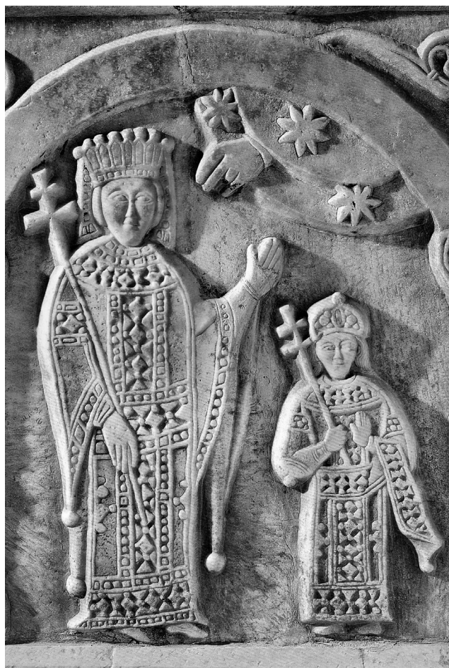
Εικ. 6. Άρτα, Αγία Θεοδώρα. Σαρκοφάγος της αγίας Θεοδώρας, λεπτομέρεια (Byzantium: Faith and Power (1261 1557), κατάλογος έκθεσης, Νέα Υόρκη 2004, 94, εικ. 4.1,).

Ο Ανδρόνικος ο Β΄ γεννήθηκε το 1258 και, όταν το 1282 διαδέχθηκε τον πατέρα του, Μιχαήλ Η΄, ήταν 24 χρονών. Μεταξύ άλλων κληρονόμησε, όπως είναι γνωστό,