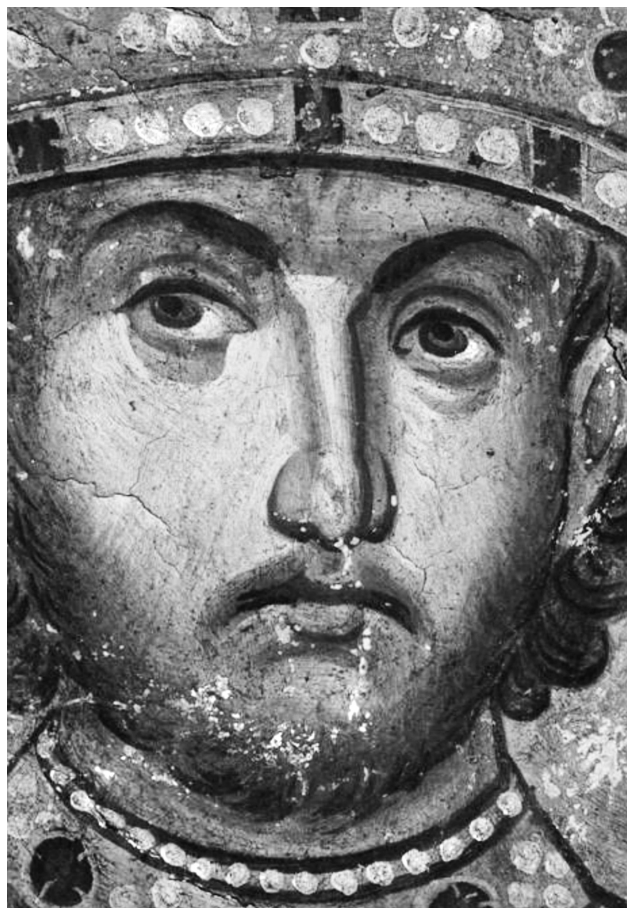
Εικ. 2. Πρωτάτο. Άγιος Κωνσταντίνος, λεπτομέρεια.

χθούμε τη χρονολόγηση του Πρωτάτου στο 13ο αιώνα, ο Κωνσταντίνος παρουσιάζεται ντυμένος την πλήρη στολή ενός βυζαντινού αυτοκράτορα της δυναστείας των Παλαιολόγων. Φορά διάλιθο καμελαύκιον 17 , σάκκο , χρυσοκέντητο διάλιθο λώρο . Κρατά τα αρμόζοντα insignia , σταυρόσχημο και, επίσης, διάλιθο σκήπτρο στο δεξί, και στο αριστερό μία κόκκινη ακακία 18 . Αν συγκρίνει κανείς τη μορφή με ιστορικά πορτραίτα Παλαιολόγων αυτοκρατόρων, όπως του Μανουήλ Β΄ από τον κώδικα Paris sup. grec 309 19 (Εικ. 5), διαπιστώνει ότι το κοστούμι αντιμετωπίζεται και εδώ ως realium , αναπαράγοντας πιστά κάθε λεπτομέρεια, ακόμη και τους κόκκινους και μπλε λίθους του λώρου, αν και υπερτονισμένους. Το σκήπτρο με τον ευμεγέθη σταυρό μαρτυρείται, επίσης, σε παραστάσεις της εποχής, όπως το ανάγλυφο από τη σαρκοφάγο της αγίας Θεοδώρας (περ. 1270), δεσπότησας της Ηπείρου, στο ναό της στην Άρτα 20 (Εικ. 6). Είναι σαφές λοιπόν ότι ο Μέγας Κωνσταντίνος παρουσιάζεται στο Πρωτάτο ως ο σύγχρονος αυτοκράτορας. Ή μήπως συμβαίνει το αντίστροφο; Ο φυσιογνωμικός τύπος του εικονιζόμενου προσώπου είναι άλλος από το συνηθισμένο φυσιογνωμικό τύπο του Κωνσταντίνου με το λιπόσαρκο, τριγωνικό πρόσωπο, τα προτεταμένα ζυγωματικά και το κοντό, διχαλωτό γένι 21 (Εικ. 3 και 4). Παρουσιάζεται με σχετικά στρογγυλό, σαρκώδες πρόσωπο, με νεανικά χαρακτηριστικά και υποτυπώδες ανοικτό καστανό νεανικό γένη, που περιγράφει τις παρειές. Στα μάτια ενός βυζαντινού θεατή όλα τα παραπάνω στοιχεία θα συναινούσαν στο ότι έχει απέναντί του μια