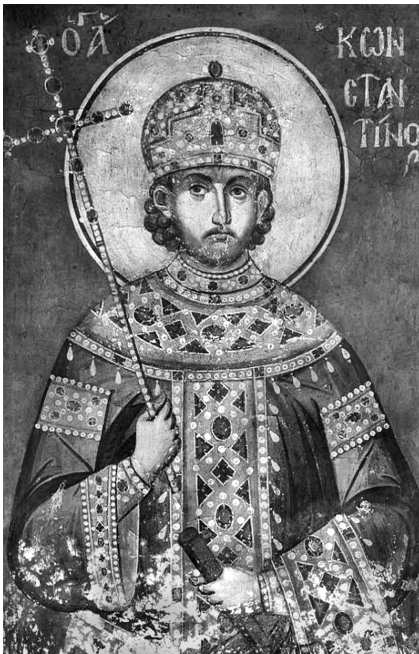
Εικ. 1. Πρωτάτο. Άγιος Κωνσταντίνος (φωτ. του συγγραφέα).

σης. Μάλιστα ο Κωνσταντίνος δεν συσχετίζεται ούτε με τον Τίμιο Σταυρό, το εμβληματικό στοιχείο που νοηματοδοτεί συνήθως την παρουσία του (Εικ. 3 και 4). Μόνος και χωρίς attributum, επομένως χωρίς κανέναν