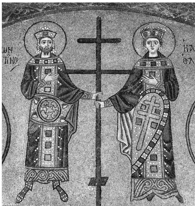
Εικ. 3. Όσιος Λουκάς, καθολικό. Άγιοι Κωνσταντίνος και Ελένη (N. Χατζηδάκη, Βυζαντινά ψηφιδωτά, Αθήνα 1994, εικ. 74).

απεικόνιση του δικού του αυτοκράτορα. Σημαντική εξαίρεση αποτελεί βέβαια η επιγραφή, η οποία σε ένα τέτοιο πλαίσιο γίνεται απαραίτητη για την ταύτιση: Ο ΑΓ(ΙΟC) ΚΩΝCΤΑΝΤΙΝΟC. Διαπιστώνεται δηλαδή νοηματική διάσταση ανάμεσα στα δύο σημαντικά στοιχεία της παράστασης: στην απεικόνιση και στην επιγραφή της. Ασφαλώς η επιγραφή είναι καθοριστική για την ταύτιση του εικονιζόμενου προσώπου, ώστε να μην τίθεται ζήτημα αμφιβολίας, ούτε για το σύγχρονο του έργου θεατή ούτε για τον ερευνητή. Όμως η διάσταση ανάμεσα στην απεικόνιση και στην επιγραφή της δημιουργεί τον απαραίτητο χώρο μέσα στον οποίο μπορεί να τελεστεί ο συμφυρμός της εικόνας του αρχαίου αυτοκράτορα και του σύγχρονου.