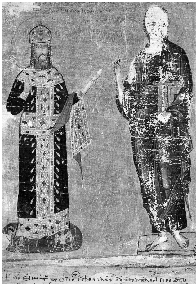
Εικ. 7. Χρυσόβουλλο της Μονεμβασίας, 1301, Βυζαντινό Μουσείο, Αθήνα. Πορταίτο του Ανδρονίκου Β΄ Παλαιολόγου (Ο Κόσμος του Βυζαντινού Μουσείου Αθηνών, Αθήνα 2004, 380-381, εικ. 379).

οπωσδήποτε όχι να μειωθεί σε σχέση με την πραγματικότητα 23 . Από το μοναδικό πορταίτο του Ανδρονίκου που γνωρίζω να έχει σωθεί άρτιο, το Χρυσόβουλλο της Μονεμβασίας (1301) 24 , προκύπτει ότι ο Ανδρόνικος είχε αρκετή γενειάδα στα 43 του 25 (Εικ. 7). Ωστόσο, καθώς ήταν ανοιχτόχρωμος, θα μπορούσε να αναρωτηθεί κανείς μήπως το γένι του ήταν λιγότερο εμφανές σε μια πιο