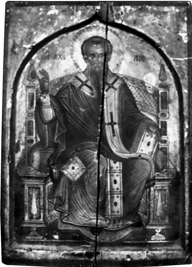
Εικ. 7. Συλλογή της 7ης ΕΒΑ Λάρισας. Αδημοσίευντη εικόνα. Ο άγιος Αχιλλείος.

νον ἐν τῇ ἀρετῇ καὶ σοφίᾳ πολλῶν ἐπεκράτησεν, ἀλλὰ καὶ ἐκ τῆς τοῦ σώματος διαπλάσεως ἢ γὰρ ὄψις αὐτοῦ