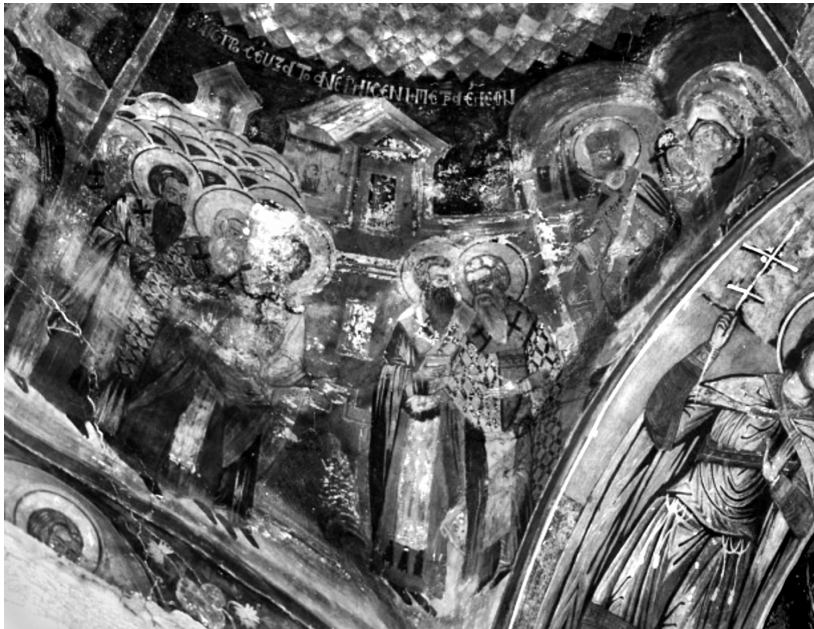
Εικ. 5. Πεντάλοφος Βοίου Κοζάνης, ναός Αγίου Αχιλλείου (1774). Ο άγιος Αχιλλείος στην Α΄ Οικουμενική Σύνοδο κατατροπώνει τον Άρειο.

επιχειρήματά του, αλλά και με το θαύμα της ανάβλυσης ελαίου από μια πέτρα (Εικ. 5). Στην άλλη παράσταση του ναού αποδίδεται η Κοίμηση του αγίου (Εικ. 6) 65 .