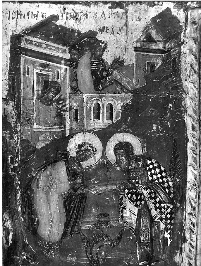
Εικ. 8. Λαογραφικό Μουσείο του Λεχόβου Φλωρίνης. Λεπτομέρεια εικόνας του αγίου Δημητρίου με σκηνές του βίου του (1639).

Σλάβων 89 , γι' αυτό και εικονίζεται δίπλα σε τοπικούς ηγεμόνες, όπως στο Mileševo 90 .