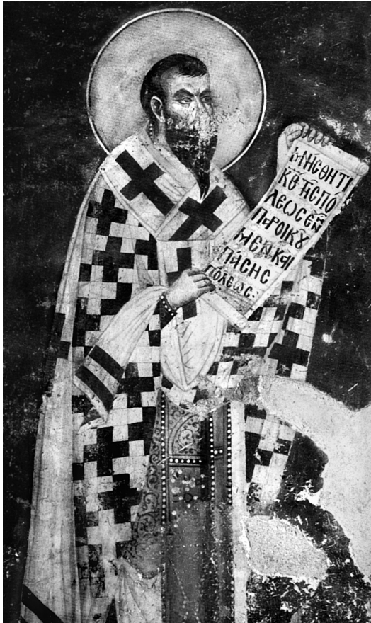
Εικ. 1. Ελασσόνα Λαρίσης, μονή Παναγίας Ολυμπιώτισσας (14ος αι.). Ο άγιος Αχιλλείος.

ριακό ναό του Ευαγγελισμού της Θεοτόκου στη μονή Χιλανδαρίου Αγίου Όρους, που χρονολογείται περίπου το 1320 39 . Προφανώς πρόκειται για μια από τις παλαιότερες απεικονίσεις του αγίου στο Άγιον Όρος. Από την ύστερη περίοδο των Παλαιολόγων απεικονίσεις του αγίου γνωρίζουμε στη Βέροια, στο ναό του Αγίου Σάββα Κυριώτισσας 40 και στο ναό της Αγίας