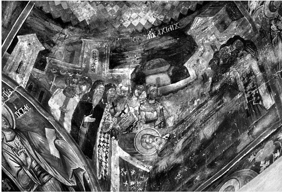
Εικ. 6. Πεντάλοφος Βοΐου Κοζάνης, ναός Αγίου Αχιλλείου (1774). Η Κοίμηση του αγίου Αχιλλείου.

αγίου Δημητρίου, στα χρόνια του αυτοκράτορα Λέοντα του Σοφού (904 μ.Χ.), η Θεσσαλονίκη είχε κατακτηθεί από Σαρακηνούς 71 . Την ίδια περίοδο χριστιανοί είχαν ξεκινήσει από την Ιταλία για να επισκεφθούν τα ιερά προσκυνηματα. Περνώντας από τα Τέμπη της Θεσσαλίας ένας γέροντας άρχισε να πορεύεται μαζί τους, ενώ, από την πλευρά της Θεσσαλονίκης καταφθάνει νεαρός καβαλάρης, ο οποίος σταμάτησε και προσφώνησε το γέροντα με σεβασμό. Ο γέροντας αντιχαιρέτισε και στην απορία του για τη θλίψη του νεαρού, αυτός του εξιστόρησε τα πάθη της πόλης του. Ο γέροντας έκλαψε μαζί του και κατόπιν εξαφανίστηκαν. Το ίδιο επεισόδιο