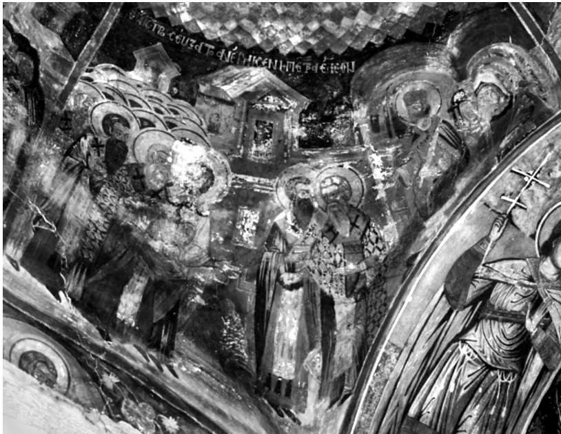
Εικ. 5. Πεντάλοφος Βοΐου Κοζάνης, ναός Αγίου Αχιλλείου (1774). Ο άγιος Αχιλλείος στην Α΄ Οικουμενική Σύνοδο κατατροπώνει τον Άρειο.

επιχειρήματά του, αλλά και με το θαύμα της ανάβλυσης ελαιού από μια πέτρα (Εικ. 5). Στην άλλη παράσταση του ναού αποδίδεται η Κοίμηση του αγίου (Εικ. 6) 65 .