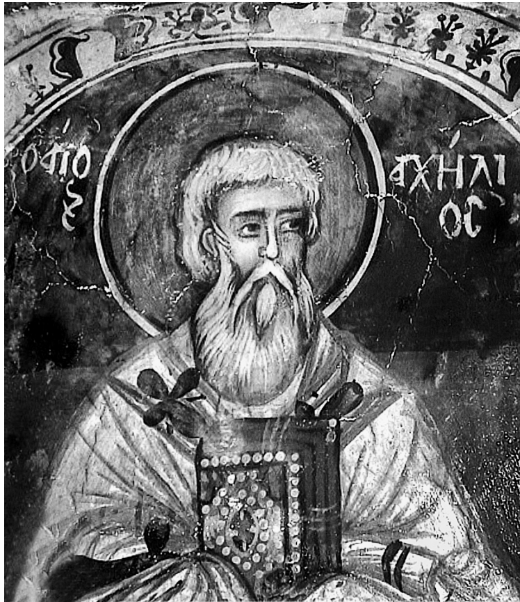
Εικ. 3. Τορνίκι Γρεβενών (1481). Ο άγιος Αχιλλείος.

βενών (1481) (Εικ. 3) 47 , στο καθολικό της μονής Μεγάλου Μετεώρων (1483) 48 κ.α.