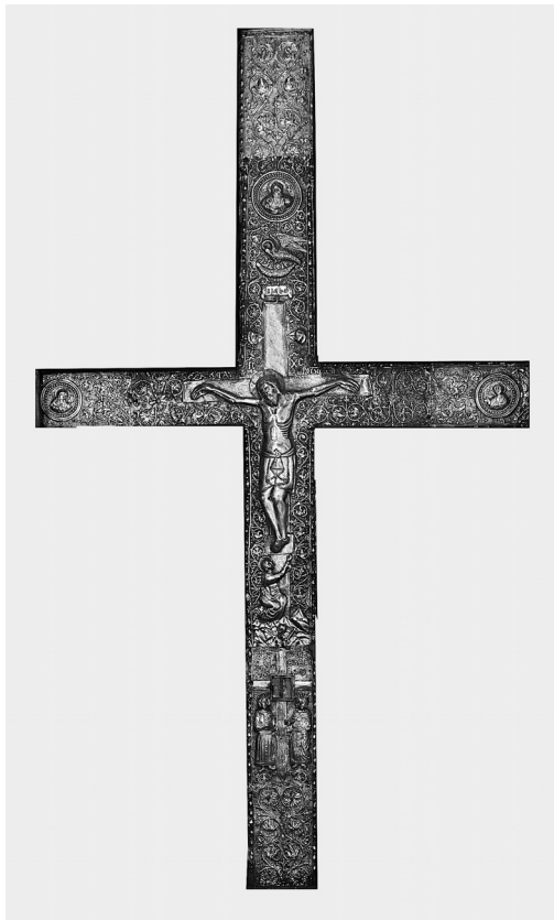
Εικ. 1. Ασκάς Κύπρου, ναός Τιμίου Σταυρού. Αργυρεπίχρυσο κάλυμμα σταυρού.