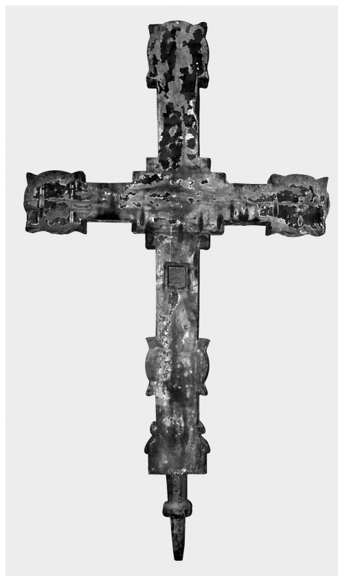
Εικ. 8. Ασκάς Κύπρου, ναός Τιμίου Σταυρού. Ξύλινος ζωγραφιστός σταυρός. Κύρια πλευρά. 15ος αιώνας.

Στη Δύση ο σταυρός τοποθετείται όρθιος πάνω στην Αγία Τράπεζα, η οποία βρίσκεται είτε στο μέσον της εκκλησίας (π.χ. οθωνική εκκλησία στο Essen στη Γερμανία) είτε στο μέσον του Ιερού (π.χ. καθεδρικός ναός Halberstadt, Γερμανία) 58 . Τα τρισδιάστατα δυτικού τύπου γλυπτά του Εσταυρωμένου, τα οποία ήταν τοποθετημένα πάνω στο σταυρό, συνήθως είχαν θυρίδα στο κεφάλι ή στο στήθος 59 . Το χρονικό του Thietmar, αρχιεπισκόπου του Marburg (1012-1018), αναφέρει ότι ο αρχιεπίσκοπος Γέρονας της Κολωνίας (969-976) διατηρούσε σταυρό στον καθεδρικό ναό της πόλης, ο οποίος έφε-