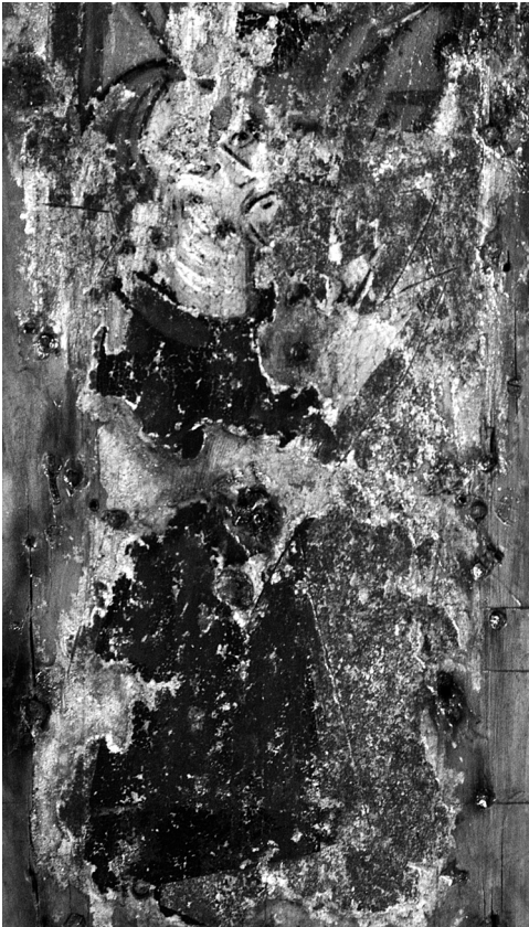
Εικ. 4. Ασκάς Κύπρου, ναός Τιμίου Σταυρού. Δωρητής. Λεπτομέρεια κύριας όψης σταυρού.