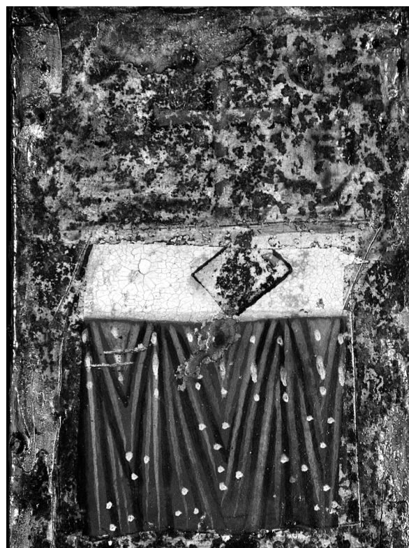
Εικ. 3. Ασκάς Κύπρου, ναός Τιμίου Σταυρού. Αγία Τράπεζα. Λεπτομέρεια κύριας όψης σταυρού.

Ο ξύλινος σταυρός στην κύρια όψη παρουσιάζει το εικονογραφικό θέμα της Σταύρωσης (Εικ. 2). Ο Χριστός εικονίζεται με κοντό, φαιόχρωμο περιζώνιο να υψώνεται νεκρός στον κυανό σταυρό, που αποδίδεται προοπτικά. Οι βραχιόνες του εκτείνονται ελαφρά λυγισμένοι πάνω στις οριζόντιες κεραίες του σταυρού και γέρνει το κεφάλι προς το στήθος. Έχει καστανά μαλλιά, τα οποία μαζεύονται κυρίως πίσω από την πλάτη, και κοντή γενειάδα και μουστάκι, που δεν ενώνεται στο μέσο. Φέρει, επίσης, ερυθρόγραφο, σταυρόσχημο φωτισμένο με τρία αστέρια και μαργαριταρένιο διάκοσμο στο περίγραμμα. Στη βάση του σταυρού απεικονίζεται το κρανίο του Αδάμ. Στο αριστερό άκρο της οριζόντιας κεραίας βρίσκεται η Παναγία, η οποία εικονίζεται σε στροφή τριών τετάρτων από τη μέση και πάνω. Δείχνει προς τον Υιόν της με το δεξί της χέρι και φέρνει το αριστερό στο πρόσωπο σε ένδειξη θλίψης. Στην αντίστοιχη θέση, ο Ιωάννης, στα δεξιά, στηρίζει με το δεξί του χέρι το πρόσωπό του και με το αριστερό δείχνει προς τον Εσταυρωμένο. Στην άνω απόληξη της κάθετης κεραίας του σταυρού απεικονίζεται Αγία Τράπεζα με Ευαγγέλιο, στην πίσω πλευρά της οποίας βρίσκεται όρθιος σταυρός μεγάλων διαστάσεων (Εικ. 3). Η ζωγραφική επιφάνεια παρουσιάζει αρκετές φθορές και είναι δύσκολο να συμπεράνουμε εάν υπήρχαν άλλα στοιχεία. Δεν αποκλείεται να είχε μαξιλάρι και να σχετίζεται με την Ετοιμασία του θρόνου, αν και απουσιάζει το περιστέρι 6 . Στην κάτω απόληξη παρατηρείται ολόσωμος δω-