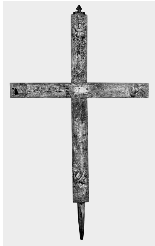
Εικ. 5. Ασκάς Κύπρου, ναός Τιμίου Σταυρού. Πίσω πλευρά σταυρού.

τον Ματθαίο, στα δεξιά. Στις άκρες της κάθετης κεραίας παρατηρούμε τον αετό σύμβολο του Ιωάννη (πάνω) και τέλος το βόδι σύμβολο του Λουκά (κάτω). Στη συμβολή των κεραίων απεικονίζεται ο αμνός, σύμβολο του Χριστού. Οι πλάγιες πλευρές του σταυρού διακοσμούνται με ρομβοειδές κυανό κόσμημα σε ερυθρό βάθος.