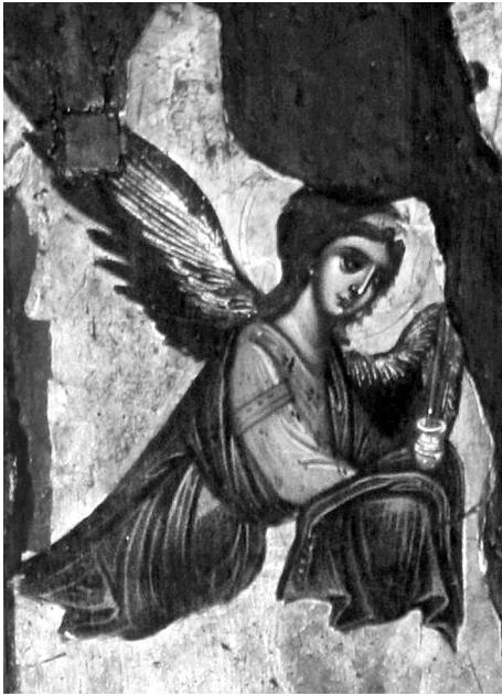
Εικ. 4. Μονή Praskvica. Παναγία του Πάθους (τέλη 15ου-αρχές 16ου αι.). Ο άγγελος αριστερά, λεπτομέρεια.