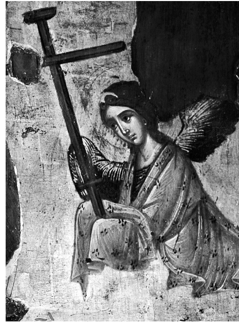
Εικ. 5. Μονή Praskvica. Παναγία του Πάθους (τέλη 15ου-αρχές 16ου αι.). Ο άγγελος δεξιά, λεπτομέρεια (φωτ. Al. Trifonova).

ναό του Αγίου Νικολάου στο Bari της Ιταλίας (τέλη 15ου αι.) 10 , αλλά και τις εικόνες της Παναγίας του Πάθους στο παρεκκλήσιο του Οσίου Χριστοδούλου στη μονή της Πάτιμου (γύρω στο 1500) 11 , στη Συλλογή Sekulić (τέλη 15ου-αρχές 16ου αι.) 12 και στον καθεδρικό ναό στο Mostar της Ερζεγοβίνης (16ος αι.) 13 . Ακόμη, η εικόνα της μονής Praskvica έχει στενή εικονογραφική συγγένεια με τις ομώνυμες εικόνες στην Πινακοθήκη του Museo Civico Camerino της Ιταλίας (1486) 14 , στο Μου-