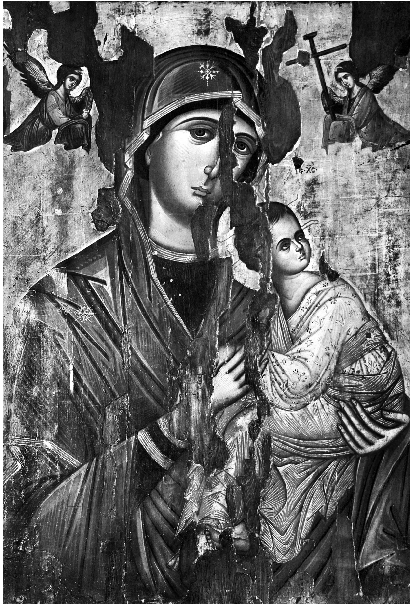
Εικ. 1. Μονή Praskvica. Παναγία του Πάθους (τέλη 15ου-αρχές 16ου αι.) (φωτ. Αl. Trifonova).

άγγελος δεξιά (Εικ. 5), που φορεί πράσινο χιτώνα και ρόδινο μάτιο, κρατεί το σταυρό της μελλοντικής θυσίας του Χριστού. Το βάθος της εικόνας έχει γίνει με επικόλληση τετράγωνων φύλλων χρυσού, με αποτέλεσμα να μην είναι ενιαίο, καθώς τα σημεία επαφής των φύλλων παρα-