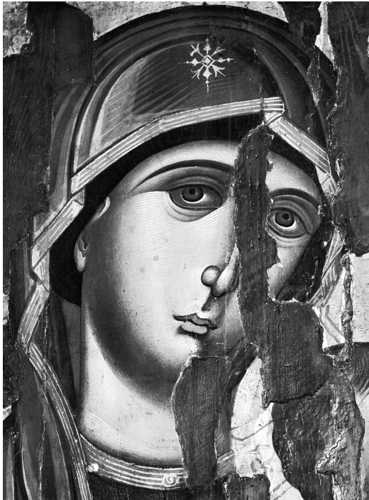
Εικ. 2. Μονή Praskvica. Παναγία του Πάθους (τέλη 15ου-αρχές 16ου αι.). Η Παναγία, λεπτομέρεια.