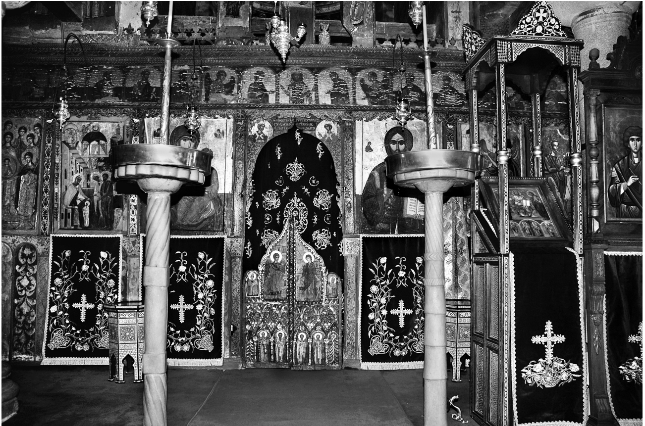
Εικ. 1. Αγιά, μονή Αγίου Παντελεήμονος. Γενική άποψη του τέμπλου του καθολικού.

κληρώνεται το σύνολο του μοναστηριακού συγκροτήματος και τοιχογραφείται το καθολικό, η Τράπεζα και το παρεκκλήσι του πύργου 3 . Το καθολικό σήμερα καλύπτεται από το ζωγραφικό διάκοσμο του 1724 4 , αλλά στο Ιερό διακρίνεται κατά τόπους το προηγούμενο στρώμα 5 .