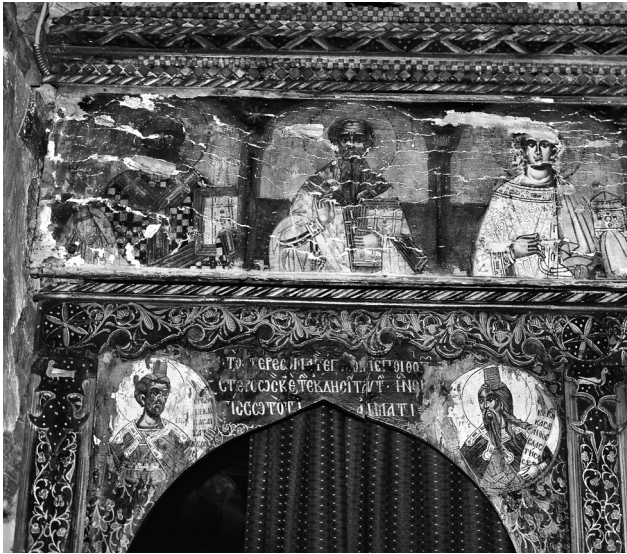
Εικ. 3. Αγιά, μονή Αγίου Παντελεήμονος. Το επίθυρο της πρόθεσης.