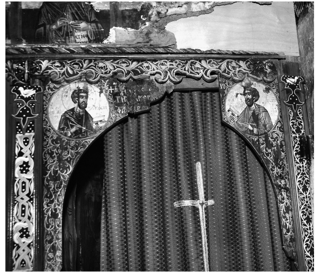
Εικ. 4. Αγιά, μονή Αγίου Παντελεήμονος. Το επίθυρο του διακονικού.

του καθολικού της μονής Γενεσίου Θεοτόκου στο Πολυδένδρι (Εικ. 7) παρουσιάζει ομοιότητα με το τέμπλο του καθολικού της μονής Αγίου Παντελεήμονος στην τεχνική κατασκευής και στη διακόσμηση, είναι όμως ζωγραφισμένο από άλλον καλλιτέχνη την ίδια περίοδο.