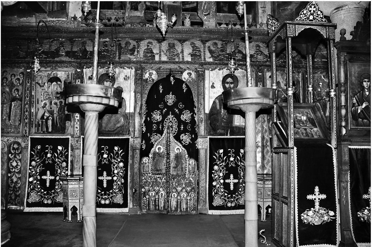
Εικ. 1. Αγιά, μονή Αγίου Παντελεήμονος. Γενική άποψη του τέμπλου του καθολικού.

κληρώνεται το σύνολο του μοναστηριακού συγκροτήματος και τοιχογραφείται το καθολικό, η Τράπεζα και το παρεκκλήσι του πύργου 3 . Το καθολικό σήμερα καλύπτεται από το ζωγραφικό διάκοσμο του 1724 4 , αλλά στο Ιερό διακρίνεται κατά τόπους το προηγούμενο στρώμα 5 .