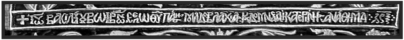
Εικ. 8. Μονή Βατοπεδίου. Ενεπίγραφή ποδέα μεσαίου μεγέθους (1651/2). Αφιερωτική επιγραφή, λεπτομέρεια της Εικ. 4.

υπό την επιρροή των γεγονότων αυτών μάλλον μπορεί να δικαιολογηθεί η χρήση της ελληνικής γλώσσας στις αφιερωματικές επιγραφές του Vasile Lupu, κατά την τελευταία εφταετία της ηγεμονίας του.