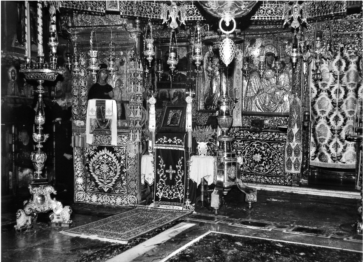
Εικ. 6. Οι ποδέες σε χρήση στο καθολικό της μονής Βατοπεδίου.

κατατικής του πολιτικής, το 1637, ο Vasile Lupu επιτίθεται εναντίον της Βλαχίας, ενώ δύο χρόνια αργότερα ηττάται από τη συμμαχία της Βλαχίας με την Τρανσυλβανία 37 και τον ηγεμόνα Matei Basarab (1632-1654) 38 . Παρόλα αυτά ο Μολδαβός ηγεμόνας δεν κρύβει τις βλέψεις του για το γειτονικό πριγκιπάτο της Βλαχίας 39 , όποτε του παρουσιάζεται η ευκαιρία, έστω μέσω των κτητορικών-αφιερωτικών επιγραφών, αυτοαποκαλείται βοεβόδας και των δύο ηγεμονιών 40 .