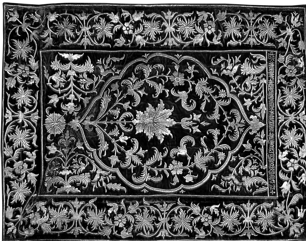
Εικ. 4. Μονή Βατοπεδίου. Ενεπίγραφη ποδέα μεσαίου μεγέθους (1651/2). Αφιέρωμα του Vasile Luru στη μονή Αναλήψεως (Golía).