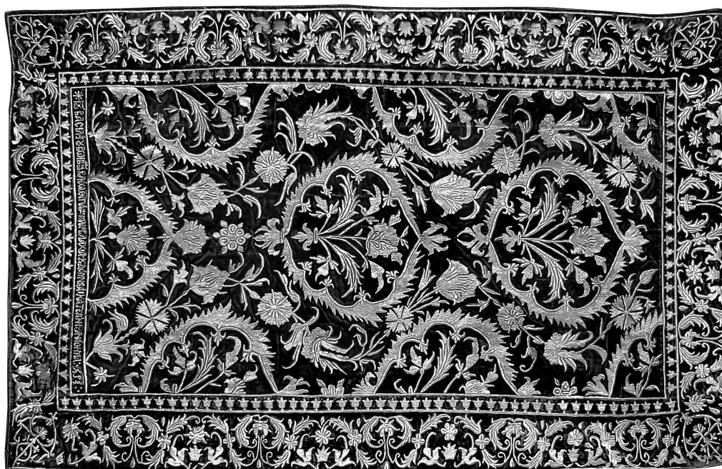
Εικ. 3. Μονή Βατοπεδίου. Ενεπίγραφη ποδέα μεσαίου μεγέθους (1651/2). Αφιέρωμα του Vasile Luru στη μονή Αναλήψεως (Golía).