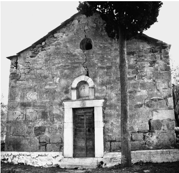
Εικ. 5. Μεστά, ναός Αγίων Αποστόλων.

όψη του αρχοντικού Σγούτα. Η πλινθοπερίκλειστη όψη συνδυάζεται με τα τοξωτά ανοίγματα που έχουν κατασκευαστεί από δίχρωμους θολίτες Θυμιανών. Το κτήριο, βάσει επιγραφής, προέρχεται από επισκευή που έγινε το 1702, μια και το εσωτερικό, σύμφωνα με το μελετητή του, θα μπορούσε να χρονολογηθεί πολύ παλαιότερα 26 .