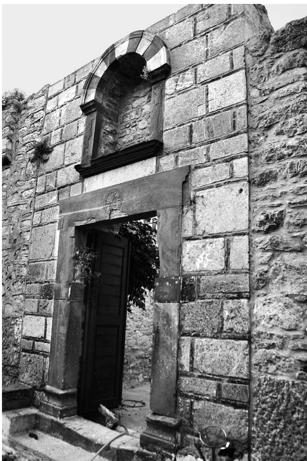
Εικ. 6. Μεστά, ναός Παλαιού Ταξιάρχη, είσοδος στον περίβολο.

Άγιο Εύπλου είναι η κατασκευή των τόξων των παραθύρων και του υπέρθυρου προσκυνηταρίου με την «παραλλαγή» της κρυμμένης πλίνθου 28 (Εικ. 8).