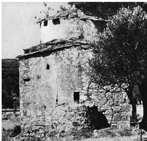
Εικ. 14. Πυργί, ναός Αγίου Ιωάννη στο Κέρος.

Ατελές πλινθοπερίκλειστο απαντά και στο ναό του Αγίου Ιωάννη στο Κέρος, ο οποίος είναι σήμερα επιχρισμένος (Εικ. 14). Ο Μπούρας είχε χρονολογήσει το ναό στο διάστημα από το 14ο έως το 16ο αιώνα 57 . Όπως μπορούμε να διακρίνουμε σε τρεις φωτογραφίες πριν την επίχριση του ναού, οι οποίες δυστυχώς δεν είναι ιδιαίτε-