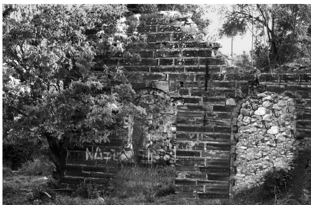
Εικ. 19. Ζυφιάς, κρηναίο κτίσμα στην Άνω Πλαγιά.