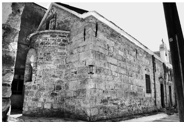
Εικ. 20. Καλαμωτή, ναός Ταξιάρχη.

χρησιμοποιηθεί λιθόπλινθοι από αρχαίο οικοδομικό υλικό. Οι ναοί ακολουθούν τον τύπο της μονόκλιτης καμαροσκεπαστης δρομικής βασιλικής, έναν τύπο που αποδειγμένα γνώρισε μεγάλη διάδοση στην περίοδο της τουρκοκρατίας 67 , αλλά δεν αποκλείεται και νωρίτερα 68 . Τα χαμηλότερα τμήματα της βόρειας πλευράς του Ταξιάρχη είναι κατασκευασμένα από αργολιθοδομή, που πιθανότατα έφερε επίχρυσμα. Το ίδιο και το χαμηλότερο τμήμα της ημικυκλικής αψίδας. Η δε αψίδα επιστέφεται από πλίνθινο οδοντωτό γείσο ανάμεσα σε δύο πλίνθινες στρώσεις και διατρύπεται από ένα δίλοβο παράθυρο, στο οποίο μεταγενέστερα προστέθηκε τόξο από συμπαγή τούβλα. Από τα ίδια τούβλα κατασκευάστηκε και το τρίλοβο παράθυρο της δυτικής όψης, που θα πρέπει να ανάγεται στην ίδια φάση. Είναι φανερό ότι και ο ναός του Ταξιάρχη βρίσκεται στους απόηχους μιας βυζαντινίζουσας παράδοσης. Ο συνδυασμός όλων αυτών των στοιχείων (οδοντωτό γείσο, δίλοβο παράθυρο ιερού) με το πλινθοπερίκλειστο σύστημα θα μπορούσε να οδηγήσει σε μια χρονολόγηση του μνημείου από τα τέλη του 16ου αιώνα και εξής. Η δε ομοιότητα με τον ακριβώς χρονολογημένο περίβολο του Παλαιού Ταξιάρχη στα Μεστά και το ναό των Αγίων Αποστόλων στον ίδιο οικισμό, θα μπορούσε να ανεβάσει αυτήν τη χρονολόγηση μέχρι τα μέσα του 18ου αιώνα. Την ίδια περίοδο θα μπο-