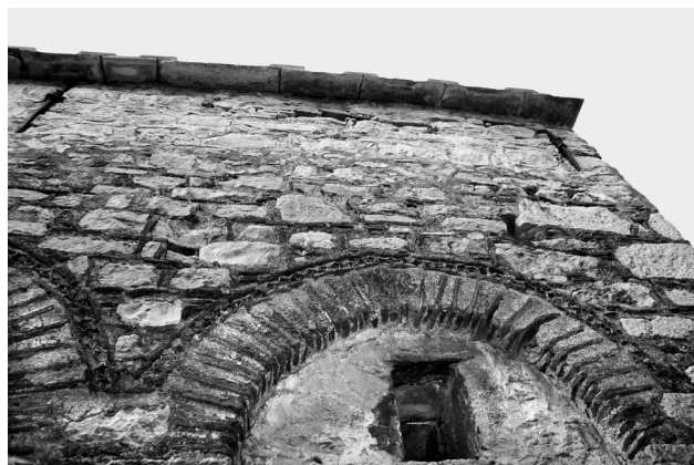
Εικ. 1. Μεστά, ναός Παλαιού Ταξιάρχη.

Στη Χίο, το πλινθοπερίκλειστο είχε εφαρμοστεί, κατά ευτυχή συγκυρία, στην ατελή ή στην πιο επμελημένη μορφή του, εκτός από τον εξωνάρθηκα και την Τράπεζα της Νέας Μονής (για τα οποία θα γίνει λόγος στη συνέχεια) και την πρώτη φάση των Αγίων Αποστόλων,