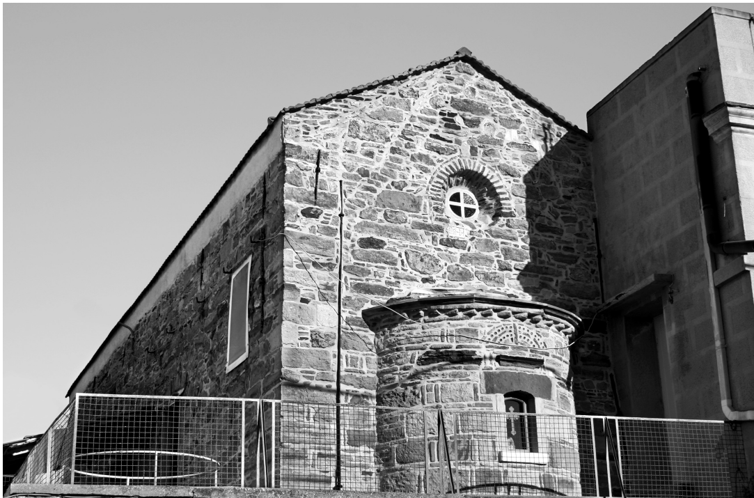
Εικ. 9. Θυμιανά, ναός Αγίου Γεωργίου Βουνιώτη.

Οι πλινθοπερίκλειστες τοιχοποιίες γενικότερα λόγω της διαχρονικής χρήσης τους στον ελλαδικό χώρο από τη μεσοβυζαντινή έως και τη μεταβυζαντινή περίοδο δεν μπορούν να αποτελέσουν κριτήριο χρονολόγησης. Όμως η χρήση του συστήματος αυτού στη Χίο, εφόσον δεν είναι συνηθισμένη, θα μπορούσε, όπως θα διαπιστώσουμε, να καταστεί πολύτιμο εργαλείο χρονολόγησης.