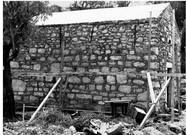
Εικ. 13. Πυργί, ναός Αγίου Γεωργίου στον Μάναγρο.

αλλά υπάρχουν και αρκετοί λιθόπλινθοι μεγάλων διαστάσεων σε δεύτερη χρήση. Οι λίθοι αυτοί έχουν χρησιμοποιηθεί και για τη διαμόρφωση του παραθύρου της αφίδας. Για το λόγο αυτό, στη ζώνη της τοιχοποιίας που αντιστοιχεί στο παράθυρο και μόνον, οι τεχνίτες έχουν τοποθετήσει τους λίθους σε ίσες αποστάσεις και έχουν συμπληρώσει τους κάθετους αρμούς με επάλληλες σειρές οριζόντια τοποθετημένων πλίνθων. Το στοιχείο μαρτυρεί την ικανότητα των μαστόρων να αυτοσχεδιάζουν και να χειρίζονται τα διαθέσιμα υλικά, με οικονομία, κατά περίπτωση, έτσι ώστε να επιτύχουν το επιθυμητό αποτέλεσμα. Οι λίθοι περιβάλλονται από ικανή ποσότητα κονιάματος. Το πλινθοπερίκλειστο σύστημα δόμησης και το κεραμοπλαστικό κόσμημα από φιαλοστόμια του διλόβου παραθύρου της αφίδας, που