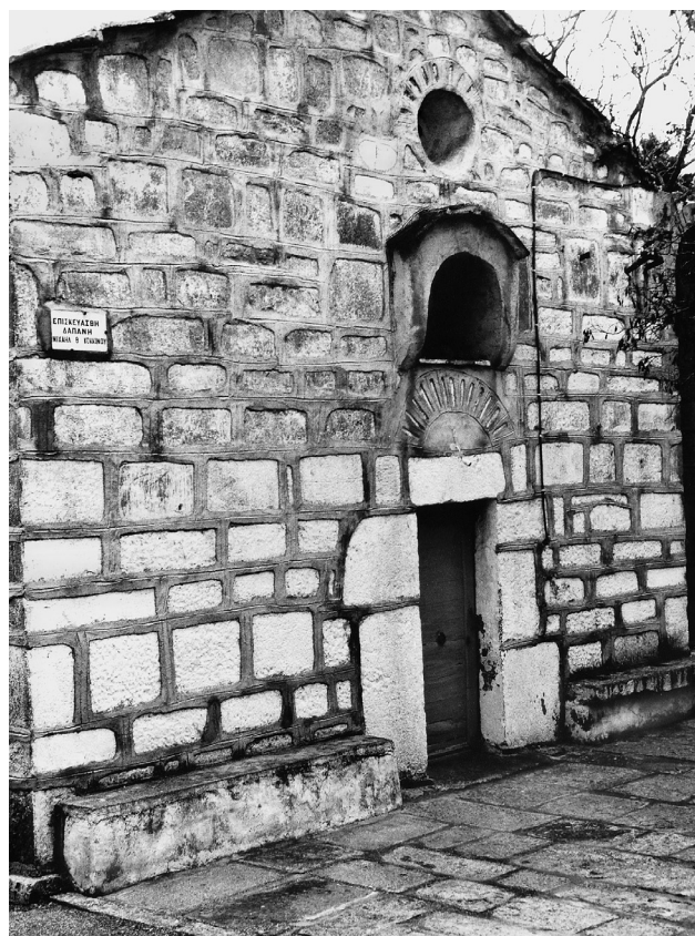
Εικ. 4. Μεστά, μονή Παναγίας.

Στο Πυργί, εκτός τους Αγίους Αποστόλους, υπάρχουν τρεις ακόμη ακριβώς χρονολογημένοι ναοί με ατελές πλινθοπερίκλειστο σύστημα. Ο επιχρισμένος, σήμερα, μονόκλιτος καμαροσκεπής ναός του Ταξιάρχη, μέσα στον οικισμό, ο οποίος βάσει εντοιχισμένης επιγραφής χρονολογείται το 1680, διακρίνεται σε παλαιότερη φωτογραφία 25 , στα σημεία που έχει καταπέσει το επίχρισμα, ότι είχε κτιστεί με αυτό το σύστημα. Οι λίθοι είναι αδρά λαξευμένοι, σχεδόν ορθογωνισμένοι.