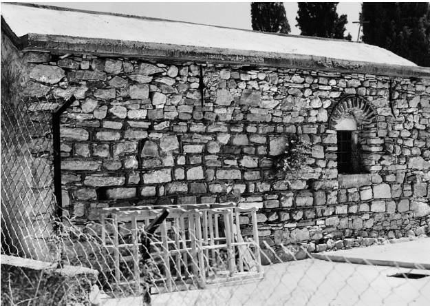
Εικ. 12. Πυργί, ναός Αγίου Ιωάννη Θεολόγου.

αλλά υπάρχουν και αρκετοί λιθόπλινθοι μεγάλων διαστάσεων σε δεύτερη χρήση. Οι λίθοι αυτοί έχουν χρησιμοποιηθεί και για τη διαμόρφωση του παραθύρου της αφίδας. Για το λόγο αυτό, στη ζώνη της τοιχοποιίας που αντιστοιχεί στο παράθυρο και μόνον, οι τεχνίτες έχουν τοποθετήσει τους λίθους σε ίσες αποστάσεις και έχουν συμπληρώσει τους κάθετους αρμούς με επάλληλες σειρές οριζόντια τοποθετημένων πλίνθων. Το στοιχείο μαρτυρεί την ικανότητα των μαστόρων να αυτοσχεδιάζουν και να χειρίζονται τα διαθέσιμα υλικά, με οικονομία, κατά περίπτωση, έτσι ώστε να επιτύχουν το επιθυμητό αποτέλεσμα. Οι λίθοι περιβάλλονται από ικανή ποσότητα κονιάματος. Το πλινθοπερίκλειστο σύστημα δόμησης και το κεραμοπλαστικό κόσμημα από φιαλοστόμια του διλόβου παραθύρου της αφίδας, που