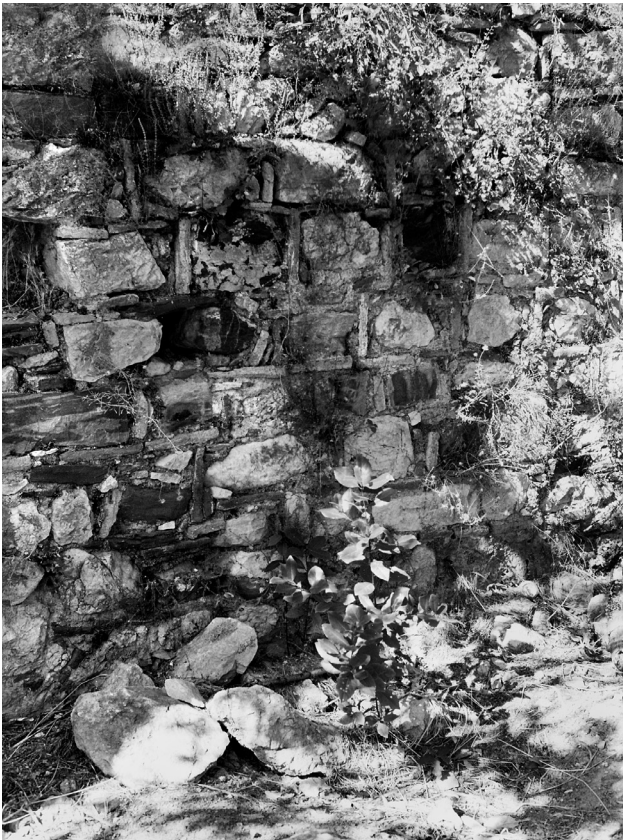
Εικ. 18. Δαφνώνας, Καναβουτσάτο.

μονής της Χώρας και της Παμμακαρίστου, ο ναός θα πρέπει να χρονολογηθεί μετά τα μέσα του 14ου αιώνα 64 . Σε μια δεύτερη φάση ανακατασκευάζεται το ανώτερο τμήμα της δυτικής πλευράς με εναλλαγή λίθων πλίνθων και η στέγη αποκτά καμπύλα αετώματα. Δεν αποκλείεται τότε να προστέθηκε και ο νάρθηκας. Σε μια τρίτη φάση συμπληρώνονται οι πλάγιες όψεις καθ' ύψος με ένα χαλαρό σύστημα δόμησης πλίνθων-λίθων, που θα μπορούσε να θεωρηθεί πλινθοπερίκλειστο. Η χρήση του πλινθοπερίκλειστου συστήματος στην υπερύψωση της στέγης και τα λίθινα αγκωνάρια στη βορειοδυτική γωνία συνηγορούν σε μια χρονολόγηση της προσθήκης μέ-