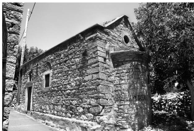
Εικ. 7. Πυργί, ναός Αγίων Βικτόρων.

Από τα παραπάνω χρονολογημένα παραδείγματα, προκύπτει ότι σε σχέση με τη βυζαντινή περίοδο (επί των υπαρχόντων πάντα μνημείων) υπάρχει μεγαλύτερη συχνότητα πλινθοπερίκλειστων τοιχοποιιών στη Χίο, από το 16ο αιώνα, που συνεχίζεται έως τα μέσα του 18ου αιώνα 29 . Όπως, όμως, αποδεικνύει η πρώτη φάση του ναού των Αγίων Αποστόλων και οι κόγχες του εξωνάρθηκα της Νέας Μονής, σίγουρα, υπήρχαν κτίσματα στο νησί με πλινθοπερίκλειστο σύστημα, τα οποία εί-