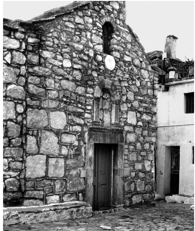
Εικ. 16. Ελάτα, ναός Αγίου Ιωάννη.

και μη χρονολογημένος ναός του Αγίου Ιωάννη στις Ροβιές των Μεστών (Εικ. 15), στην ευρύτερη, δηλαδή, και πάλι περιοχή του Πυργίου. Για το ναό δεν υπάρχει καμία πληροφορία 58 . Από μια πρόχειρη εκτίμηση, μετά την καθαίρεση των επιχρισμάτων, διαπιστώθηκε ότι το κτήριο δεν ανήκει σε μία οικοδομική φάση, αλλά τουλάχιστον σε τρεις. Σημαντικό στοιχείο είναι ότι η κατασκευή του κυρίως ναού φαίνεται να ακολουθήσε την κατασκευή του νάρθηκα, κάτι που συνέβη και στον Άγιο Ιωάννη τον Αργέντη στον Καταρράκτη 59 . Λόγω της ομοιότητας του κεραμοπλαστικού κοσμήματος των εξωτερικών όψεων του θόλου του νάρθηκα, που παραπέμπει στο νάρθηκα της Αγίας Θεοδώρας στην Άρτα 60 , θεωρούμε ότι ο νάρθηκας των Ροβιών θα μπορούσε να χρονολογηθεί στο 14ο αιώνα. Ο δε κυρίως ναός, όσον αφορά τουλάχιστον στα κατώτερα τμήματα της νότιας πλευράς, έχει κατασκευαστεί με ατελές πλινθοπερίκλειστο σύστημα, όπου οι πλίνθοι εφάπτονται στους λίθους