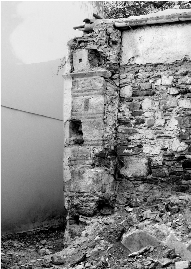
Εικ. 2. Πόλη Χίου, ναός Αγίου Συμεών Ατσικής.

Το επόμενο σε χρονική ακολουθία μνημείο είναι η δεύτερη φάση του ναού των Αγίων Αποστόλων, του 1564, με τις δύο παραλλαγές του πλινθοπερίκλειστου, την πιο αμελή των υποχωρημένων τμημάτων και την πιο επιμελημένη των παραστάδων και των ανώτερων ζωνών 16 .