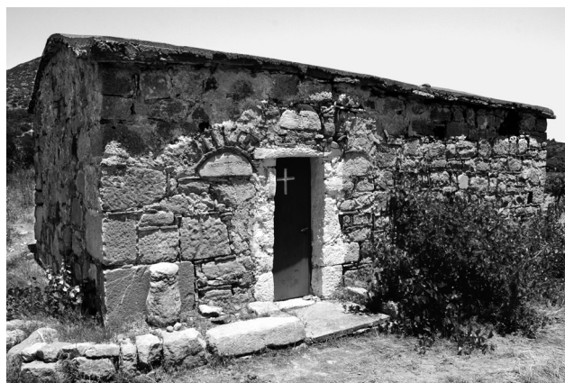
Εικ. 8. Πυργί, ναός Αγίου Εύπλου.

χαν κτιστεί πριν από το 16ο αιώνα, αλλά δεν σώθηκαν. Επομένως δεν θα πρέπει να θεωρήσουμε ότι το πλινθοπερίκλειστο εισήχθη στη Χίο το 16ο αιώνα. Η εισαγωγή του θα μπορούσε να είχε γίνει αρκετά νωρίτερα.