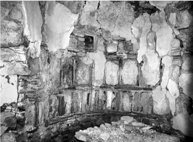
Εικ. 11. Καλαμωτή, ναός Αγίου Γεωργίου στο Σεληνάρι, αφίδα.