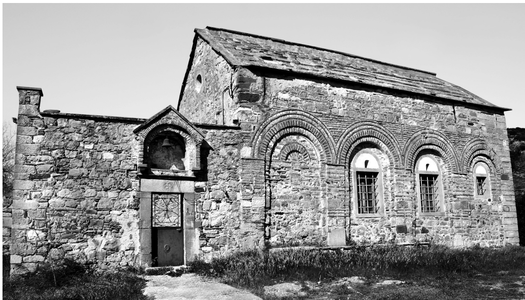
Εικ. 17. Χαλκειός, ναός Αγίου Ιωάννη.

Στην ευρύτερη περιοχή των Μεστών βρίσκεται και ο ναός των Αγίων Βικτώρων, στην αψίδα του οποίου μόλις που διακρίνεται η πλινθοπερίκλειστη κατασκευή: ορθογωνισμένοι λίθοι, ελάχιστο κονίαμα και εφαπτόμενες στις παρειές των λίθων πλίνθοι, ενθαρρύνουν τη χρονολόγηση της αψίδας (ίσως και του υπόλοιπου ναού), το αργότερο στις αρχές του 18ου αιώνα.