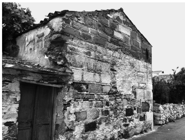
Εικ. 21. Πόλη Χίου, Κάστρο, κτίσμα παρά τον Άγιο Γεώργιο (Κεχρί).

χρησιμοποιηθεί λιθόπλινθοι από αρχαίο οικοδομικό υλικό. Οι ναοί ακολουθούν τον τύπο της μονόκλιτης καμαροσκεπαστης δρομικής βασιλικής, έναν τύπο που αποδειγμένα γνώρισε μεγάλη διάδοση στην περίοδο της τουρκοκρατίας 67 , αλλά δεν αποκλείεται και νωρίτερα 68 . Τα χαμηλότερα τμήματα της βόρειας πλευράς του Ταξιάρχη είναι κατασκευασμένα από αργολιθοδομή, που πιθανότατα έφερε επίχρυσμα. Το ίδιο και το χαμηλότερο τμήμα της ημικυκλικής αψίδας. Η δε αψίδα επιστέφεται από πλίνθινο οδοντωτό γείσο ανάμεσα σε δύο πλίνθινες στρώσεις και διατρύπεται από ένα δίλοβο παράθυρο, στο οποίο μεταγενέστερα προστέθηκε τόξο από συμπαγή τούβλα. Από τα ίδια τούβλα κατασκευάστηκε και το τρίλοβο παράθυρο της δυτικής όψης, που θα πρέπει να ανάγεται στην ίδια φάση. Είναι φανερό ότι και ο ναός του Ταξιάρχη βρίσκεται στους απόηχους μιας βυζαντινίζουσας παράδοσης. Ο συνδυασμός όλων αυτών των στοιχείων (οδοντωτό γείσο, δίλοβο παράθυρο ιερού) με το πλινθοπερίκλειστο σύστημα θα μπορούσε να οδηγήσει σε μια χρονολόγηση του μνημείου από τα τέλη του 16ου αιώνα και εξής. Η δε ομοιότητα με τον ακριβώς χρονολογημένο περίβολο του Παλαιού Ταξιάρχη στα Μεστά και το ναό των Αγίων Αποστόλων στον ίδιο οικισμό, θα μπορούσε να ανεβάσει αυτήν τη χρονολόγηση μέχρι τα μέσα του 18ου αιώνα. Την ίδια περίοδο θα μπο-