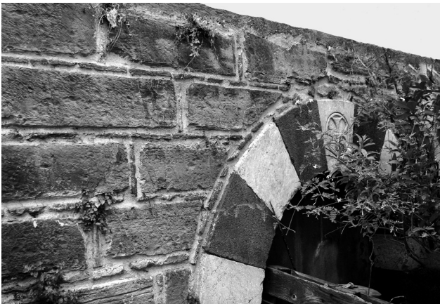
Εικ. 22. Πόλη Χίου, περίβολος ναού Αγίων Αναργύρων.

δυτική όψη του, που είναι κατασκευασμένη, όπως και πολλά κτήρια της περιοχής, με λιθόπλινθους της περιοχής των Ερυθρών, που περιβάλλονται από πλίνθους. Οι λίθοι, που προέρχονται από αρχαίο οικοδομικό υλικό του κάστρου των Ερυθρών, βρίσκονται εδώ σε δεύτερη χρήση και θα πρέπει να είχαν εισαχθεί στο νησί πριν από το πρώτο μισό του 14ου αιώνα, πριν δηλαδή η Μικρά Ασία καταληφθεί από τους Τούρκους. Εάν η τοιχοποιία ανήκε σε ορθόδοξο ναό θα πρέπει να υποθέσουμε ότι είχε κατασκευαστεί πριν από το 1346, γιατί έκτοτε μέσα στο Κάστρο κατοικούσαν μόνο Γενοβέζοι, οι δε ορθόδοξοι ναοί είχαν μετατραπεί σε καθολικούς. Όμως, τα χρονολογημένα παραδείγματα πλινθοπερίκλειστης τοιχοποιίας στο νησί δεν ενθαρρύνουν μια τέτοια χρονολόγηση. Επίσης, το κτήριο δεν μπορεί να προέρχεται από ορθόδοξο ναό της περιόδου της τουρκοκρατίας, γιατί μετά τη λήξη της γενοατοκρατίας, στο Κάστρο κατοίκησαν Τούρκοι και οι ναοί μετατράπηκαν σε τζαμιά 70 . Καταλήγουμε λοιπόν ότι η συγκεκριμένη τοιχοποιία που διατηρείται θα πρέπει να ανήκει σε κάποιο οθωμανικό, κοσμικό ή λατρευτικό, κτήριο του 17ου ή 18ου αιώνα, που κατασκευάστηκε με λίθους Ερυθρών σε «τρύπη» χρήση, αξιοποιώντας το οικοδομικό υλικό από κτήριο της προγενουατικής περιόδου 71 .