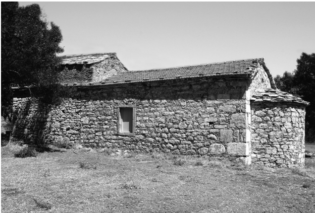
Εικ. 15. Μεστά, ναός Αγίου Ιωάννη στις Ροβιές.

και μη χρονολογημένος ναός του Αγίου Ιωάννη στις Ροβιές των Μεστών (Εικ. 15), στην ευρύτερη, δηλαδή, και πάλι περιοχή του Πυργίου. Για το ναό δεν υπάρχει καμία πληροφορία 58 . Από μια πρόχειρη εκτίμηση, μετά την καθαίρεση των επιχρισμάτων, διαπιστώθηκε ότι το κτήριο δεν ανήκει σε μία οικοδομική φάση, αλλά τουλάχιστον σε τρεις. Σημαντικό στοιχείο είναι ότι η κατασκευή του κυρίως ναού φαίνεται να ακολουθήσε την κατασκευή του νάρθηκα, κάτι που συνέβη και στον Άγιο Ιωάννη τον Αργέντη στον Καταρράκτη 59 . Λόγω της ομοιότητας του κεραμοπλαστικού κοσμήματος των εξωτερικών όψεων του θόλου του νάρθηκα, που παραπέμπει στο νάρθηκα της Αγίας Θεοδώρας στην Άρτα 60 , θεωρούμε ότι ο νάρθηκας των Ροβιών θα μπορούσε να χρονολογηθεί στο 14ο αιώνα. Ο δε κυρίως ναός, όσον αφορά τουλάχιστον στα κατώτερα τμήματα της νότιας πλευράς, έχει κατασκευαστεί με ατελές πλινθοπερίκλειστο σύστημα, όπου οι πλίνθοι εφάπτονται στους λίθους