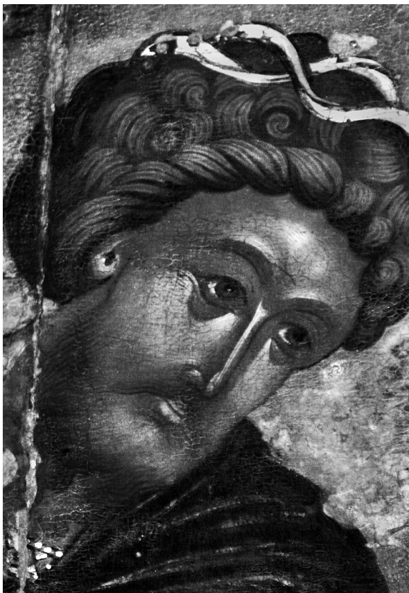
Εικ. 3. Αγχιάλος. Εικόνα του αγίου Θεοδώρου δρακοντοκτόνου (λεπτομέρεια της Εικ. 1).