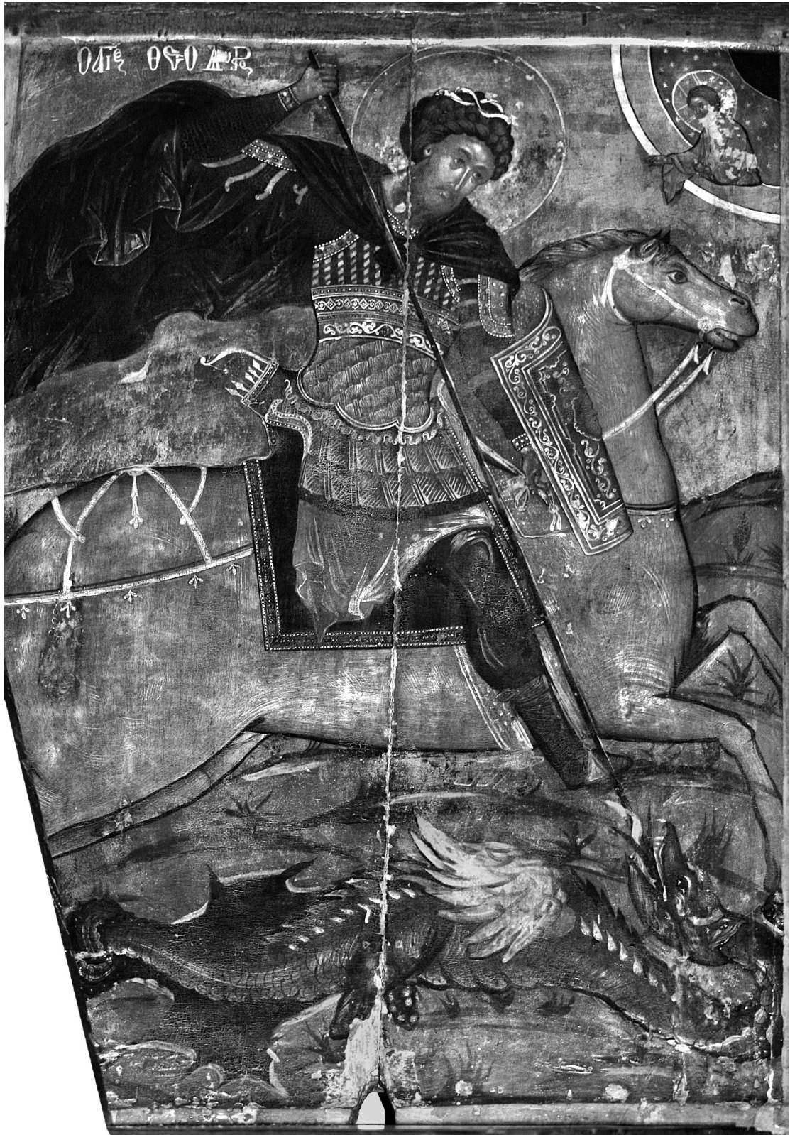
Εικ. 1. Αγχιάλος. Εικόνα του έφιππου αγίου Θεοδώρου δρακοντοκτόνου.