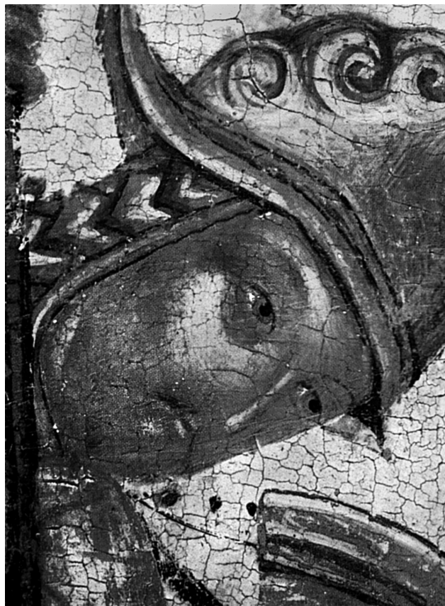
Εικ. 4. Βυζαντινό Μουσείο Βέροιας. Εικόνα του αγίου Μερκουρίου (λεπτομέρεια).

και Ιλαρίωνα στην Περιστερώνα 19 της Μητρόπολης Μόρφου στην Κύπρο, ενώ κατά τη μεταβυζαντινή πε-