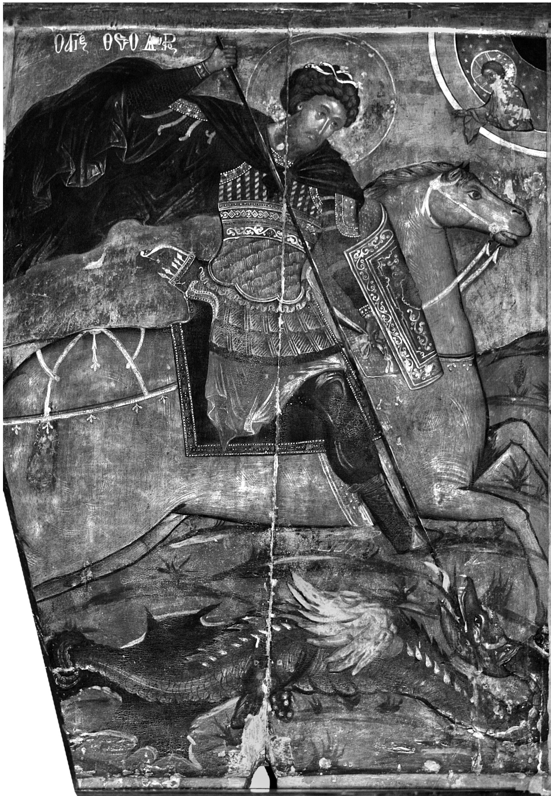
Εικ. 1. Αγχιάλος. Εικόνα του έφιππου αγίου Θεοδώρου δρακοντοκτόνου.