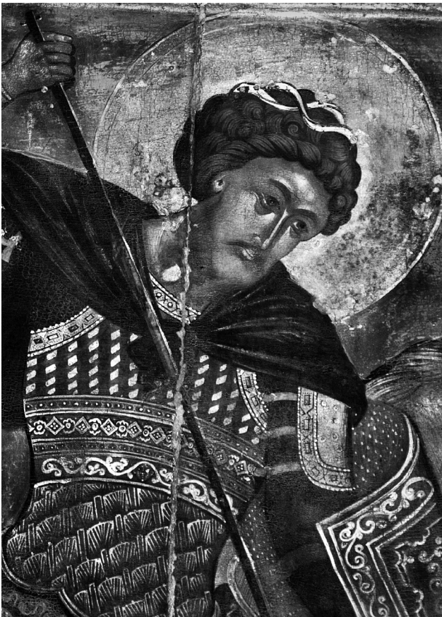
Εικ. 2. Αγχίαλος. Εικόνα του αγίου Θεοδώρου δρακοντοκτόνου (λεπτομέρεια της Εικ. 1).

πρόκειται για τον άγιο Γεώργιο, αλλά καθώς το δεξιό τμήμα, που απεικόνιζε το πρόσωπο του αγίου σήμερα, είναι κατεστραμμένο, υπάρχει πιθανότητα κατά τη γνώμη μας να ήταν είτε ο άγιος Γεώργιος είτε ο άγιος Θεόδωρος.