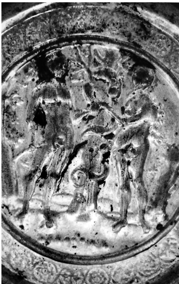
Fig. 3. Plat à offrande inédit du monastère de Docheiariou, au Mont Athos. Médaillon central. La Tentation d'Adam et Ève.