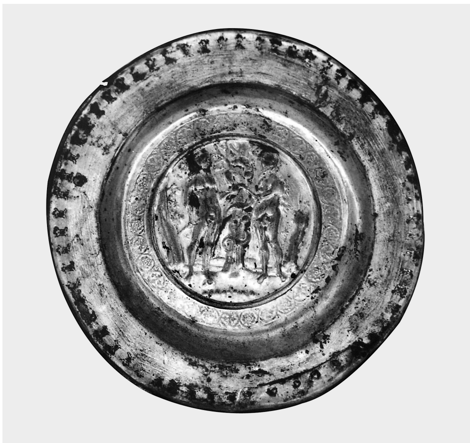
Fig. 1. Plat à offrande inédit du monastère de Docheiariou, au Mont Athos. Vue d'ensemble de l'avvers (2000).

plats en alliages métalliques furent utilisés pour la quête d'argent, qui se substitue au don de pain 5 .