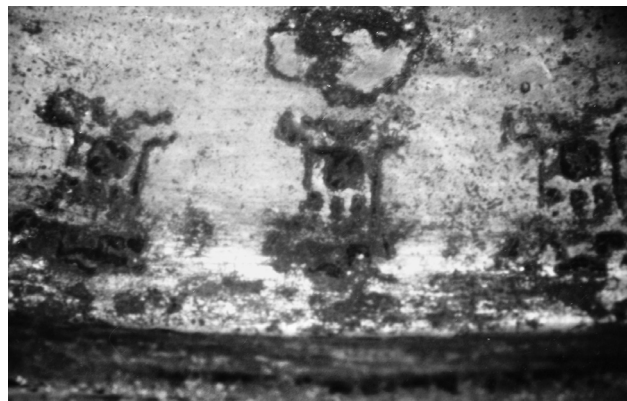
Fig. 7. Plat à offrande inédit du monastère de Docheiariou, au Mont Athos. Motifs poinçonnés.

plat. Le plat lui-même présente au centre un décor au repoussé (définition: « mise en forme et technique de décor en relief d'une feuille de métal » 16 ). Selon cette technique, la feuille de métal, épaisse de 0,5 cm, est travaillée sur l'envers du décor pour repousser les reliefs 17 , puis sur l'endroit afin de faire ressortir les formes définitives. De plus, pour cette opération il a été nécessaire d'utiliser des outils tels que la bouterolle , frappée au marteau 18 . La partie de notre plat qui est travaillée au repoussé présente au revers le négatif en creux du relief de l'avant, ainsi que de petites traces d'outils utilisés pour repousser les reliefs. Le repoussé du plat fut complété sur l'endroit par un travail de ciselure. Quant à la frise de fleurs qui entoure le médaillon