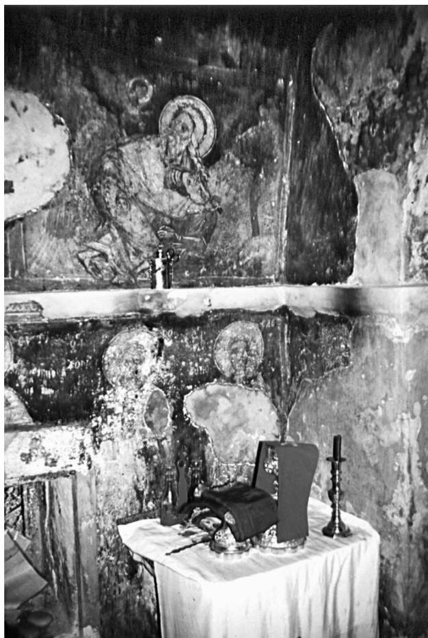
Abb. 3. Die Darstellung der Isaak-Bindung im Bereich des Zurüsttisches in den byzantinischen Kirchen bezieht sich auf den vorbereitenden Ritus der Zurüstung, die sogenannte Prokomide. Ihr liegt mehr eine christologische bzw. liturgische als eine typologische Deutung zugrunde.

Die Erklärung für die abweichende 88 Anbringung des Bildes in dem nördlich des Sanktuariums gelegenen Raum byzantinischer Kirchen muß in dessen Funktion liegen.