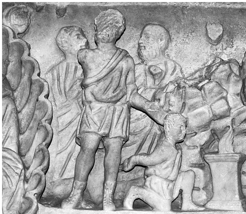
Abb. 1. Die Gegenüberstellung von Abraham und Mose bei den spätantiken Sarkophagen geht nicht auf formale Gestaltungskriterien zurück, sondern ist theologisch motiviert.

Noch deutlicher wird die Größe des geistigen Vermögens Abrahams durch die Tatsache unterstrichen, daß er Gott von Angesicht zu Angesicht schaut, als dieser ihm im Hain Mamre in Gestalt der drei Männer erscheint und sich ihm als der dreifaltige Gott zu erkennen gibt 40 . Darüber hinaus weist der Name des Berges »Moriija«, wo Abraham Isaak opfern soll, in seinem hebräischen Ursprung auf eine Vision hin 41 . Mose dagegen fürchtet den Anblick Gottes. In Ex 3,6 heißt es: »Da verhüllte Mose sein Gesicht, denn er fürchtete sich, Gott anzuschauen«. Und auch bei der Gelegenheit der Gesetzesübergabe betont der biblische Bericht 42 : »15 Und die Herrlichkeit des HERRN ließ sich auf dem Berg Sinai nieder, und die Wolke bedeckte ihn sechs Tage; und am siebten Tag rief er Mose mitten aus der Wolke heraus zu«. Mose erkennt Gott demnach im Gegensatz zu Abraham nicht.