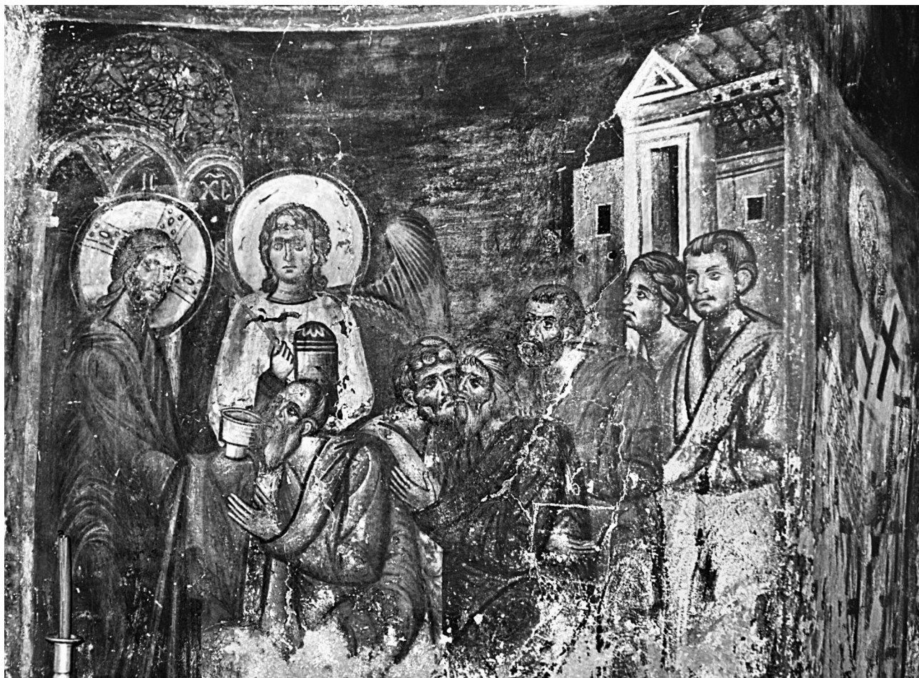
Εικ. 5. Βέροια, ναός Μεγάλου Θεολόγου. Η Μετάληψη.

Αγίου Παντελεήμονα στο Nerezi 33 , που πρέπει να αποτέλεσε το πρότυπό της. Η Παναγία δεν συγκρατεί απλώς, αλλά ουσιαστικά αγκαλιάζει το σώμα του Χριστού ακουμπώντας το πρόσωπό της στο δικό του, σαν να ασπάζεται το νεκρό της υιό. Η παράσταση διακρίνεται για την έντονη συναισθηματική φόρτιση. Παρόμοια δομή σώζεται στην κρύπτη της Ακουηλίας που χρονολογείται περίπου στο 1200 και στη Mileševa 34 .