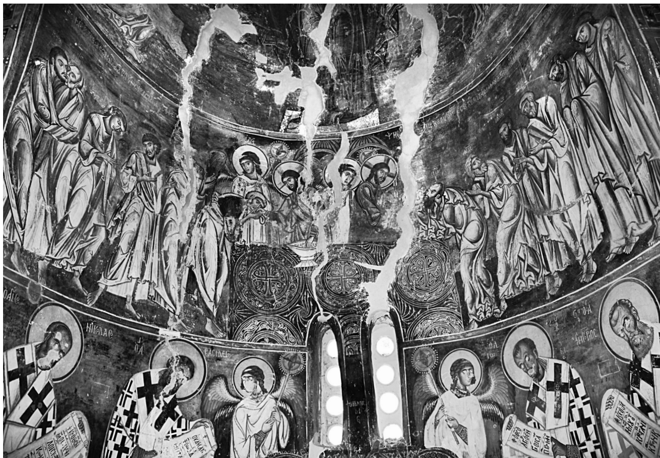
Εικ. 8. Manastir (Moriovo), ναός Αγίου Νικολάου. Η Κοινωνία των αποστόλων.

του πατριάρχη Λουκά του Χρυσοβέργη 51 . Για την ασυνήθιστη επιλογή των αποστόλων Ανδρέα και Λουκά στον Ασπασμό, αντί του Πέτρου και του Παύλου 52 , ο οποίος συνηθιζόταν σε διάφορα μέσα, η Sinkević προτείνει τα εξής: διαπιστώνει ότι οι Βυζαντινοί ήταν ακλόνητοι στην πίστη τους ότι η αποστολική έδρα της Κωνσταντινούπολης ιδρύθηκε από τον απόστολο Ανδρέα, γεγονός που συνέβαλε σημαντικά στην εδραίωση της παράδοσης αυτής στο Βυζάντιο. Την επιλογή του Λουκά η Sinkević συσχετίζει με δύο γεγονότα: με τη λατρεία του αποστόλου, που σύμφωνα με τη διαδεδομένη τοπική παράδοση γεννήθηκε στη Μακεδονία. Δεύτερον, με τον τότε πατριάρχη Κωνσταντινούπολης, το όνομα του οποίου ήταν Λουκάς (Χρυσοβέργης) (1157-1170) και ο οποίος υποστήριζε τον αυτοκράτορα στο φιλοενωτικό του προσανατολισμό 53 .