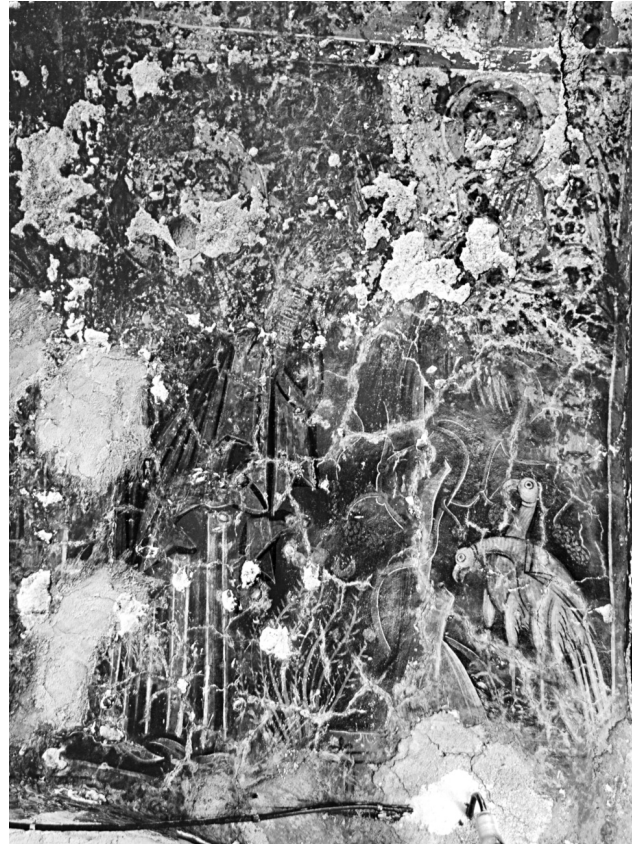
Εικ. 6. Σέλινο, Κάδρος, ναός Παναγίας. Ο Ευαγγελισμός της Άννας.

Ο Ευαγγελισμός της Άννας (Εικ. 6), παράσταση ιδι-