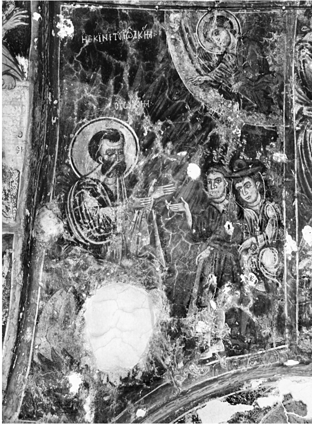
Εικ. 5. Σέλινο, Κάδρος, ναός Παναγίας. Ο Ευαγγελισμός του Ιωακείμ.

του στη σκηνή. Κατά κανόνα αποδίδεται είτε σύννουσ και σιωπηλός, όπως στην Παναγία της Κριτσάς (πρώτο μισό 14ου αιώνα) 25 και στην Αγία Άννα στο Ανισαράκι 26 , είτε παριστάνεται να χειρονομεί διστακτικά και μόλις να αρθρώνει λόγο, όπως, αργότερα, σε εικόνα από την Κίμωλο (τέλη 15ου αιώνα) 27 . Με το ένα χέρι σε διακριτή χειρονομία λόγου αποδίδεται ο Ιωακείμ, μόνον όταν συνομιλεί με τον άγγελο που τον ευαγγελίζει, όπως στο Βατοπέδι 28 . Καθώς, όμως, εδώ ο θεοπάτορας απευθύνεται στους ποιμένες με εύγλωττη έκφραση και υπογραμμίζει έντονα και με τα δύο χέρια τα λόγια του, η σκηνή θα μπορούσε κάλλιστα να αποτυπώνει την εξέλιξη της ιστορίας μετά τον ευαγγελισμό, δηλαδή την εντολή στους βοσκούς: «Φέρετέ μοι ὧδε δέκα ἀμνάδας ἀσπίλους καὶ ἀμώμους ... καὶ δεκαδύο μόσχους ἀπαλούς ... καὶ ἑκατὸν χιμάρους ...» 29 , προκειμένου να τα προσφέρει ως ευχαριστήρια δωρεά στον Θεό, που εισάκουσε την προσευχή του.