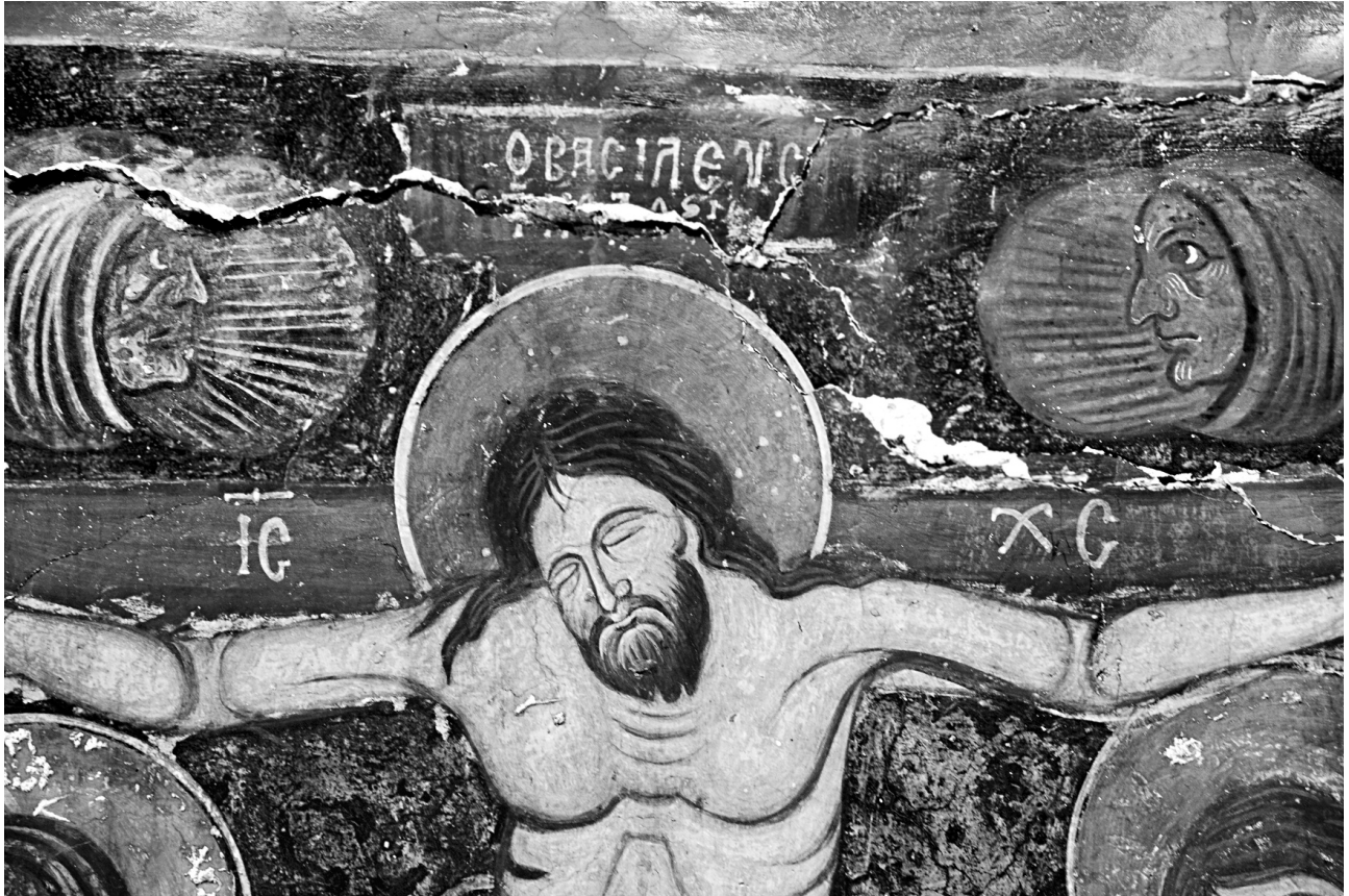
Εικ. 14. Σέλινο, Κάδρος, ναός Παναγίας. Η Σταύρωση (τμήμα).

στη ρεαλιστική τάση της ζωγραφικής των Παλαιολόγων 96 . Η μορφή του Εσταυρωμένου, μαζί με τα κοσμικά σύμβολα, δεσπόζουν στη σκηνή με το μέγεθος και τον χρωματισμό τους: στον κυανόμαντρο ουρανό γράφονται μελανός ο ήλιος και κόκκινη η σελήνη, ακριβής απόδοση του κειμένου της Αποκάλυψης, «ὁ ἥλιος ἐγένετο μέλας ... καὶ ἡ σελήνη ὅλη ἐγένετο ὡς αἷμα» 97 . Αν και τα δύο αυτά κοσμικά σύμβολα συνοδεύουν συχνά τη σκηνή ως πρόσωπα μικρογραφημένα, σε προφίλ και μέσα σε μετάλλιο, για παράδειγμα στην Παναγία στον Μουτουλά 98 και στον Χριστό στη Βέροια 99 , η εντυπωσιακή απόδοσή τους εδώ αποκλίνει από τα συνήθη: χωρίς τον περιορισμό στρογγυλού ή δακρυόσχημου πλαισίου, δύο ευμεγέθη, αντικριστά πρόσωπα σε κατατομή ζωγραφίζονται ελεύθερα, με έντονα, εκφραστικά, έως γκροτέσκα, χαρακτηριστικά, φέρουν ημισελήνοειδές πλατύ κάλυμμα στο κεφάλι και εκπέμπουν προς τα εμπρός πλατιά, πυκνή, ημικυκλική δέσμη ακτίνων. Αυτή η απει-