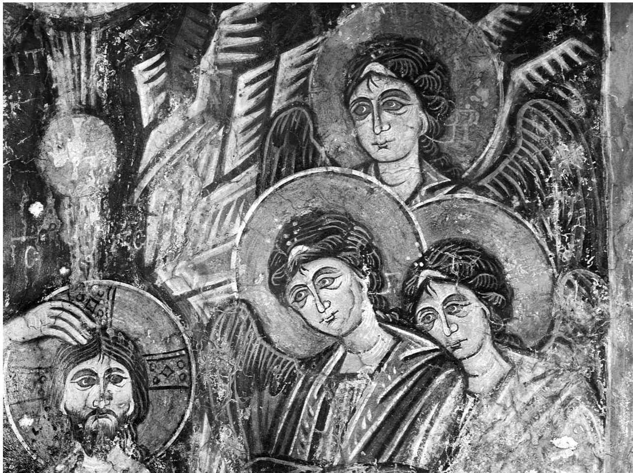
Εικ. 11. Σέλινο, Κάδρος, ναός Παναγίας. Η Βάπτισις: οι άγγελοι (λεπτομέρεια).

στη μονή του Θεολόγου στην Πάτμο (1176-1180) 64 . Όμοιο, με ελάχιστες διαφοροποιήσεις, αποδίδεται το φυσικό βάθος σε τοιχογραφίες στον ναό της Κοίμησης στον Οξύλιθο Ευβοίας (γύρω στο 1300) 65 και στην ευρύτερη περιοχή του μνημείου μας, όπως και σε έργα των Βενεζουελών και του Παγωμένου 66 . Αυτή η απεικόνιση του τοπίου, η οποία υπηρετεί μια «αισθητική άποψη μακριά από τη φύση» 67 , έρχεται σε πλήρη αντίθεση με τη φυσιοκρατική, ρεαλιστική αποτύπωση του θρόνου, δηλαδή με τα δάκρυα που κυλούν στα πρόσωπα της Μάρθας και της Μαρίας, εικονογραφώντας το ευαγγελικό κείμενο. Η απόδοση των δακρύων με μια επιμήκη βαθύχρωμη πινελιά, η οποία ξεκινά από τον πόρο του ματιού και αυλακώνει ως κάτω το μάγουλο, είναι γνωστή και δόκιμη καταγραφή οδύνης ήδη από τη μεσοβυζαντινή περίοδο 68 , όπως στην Έγερση του Λαζάρου στην Παναγία της Ασίνου (1105/6) 69 . Έτσι, ο τρόπος αποτύπωσης τοπίου και