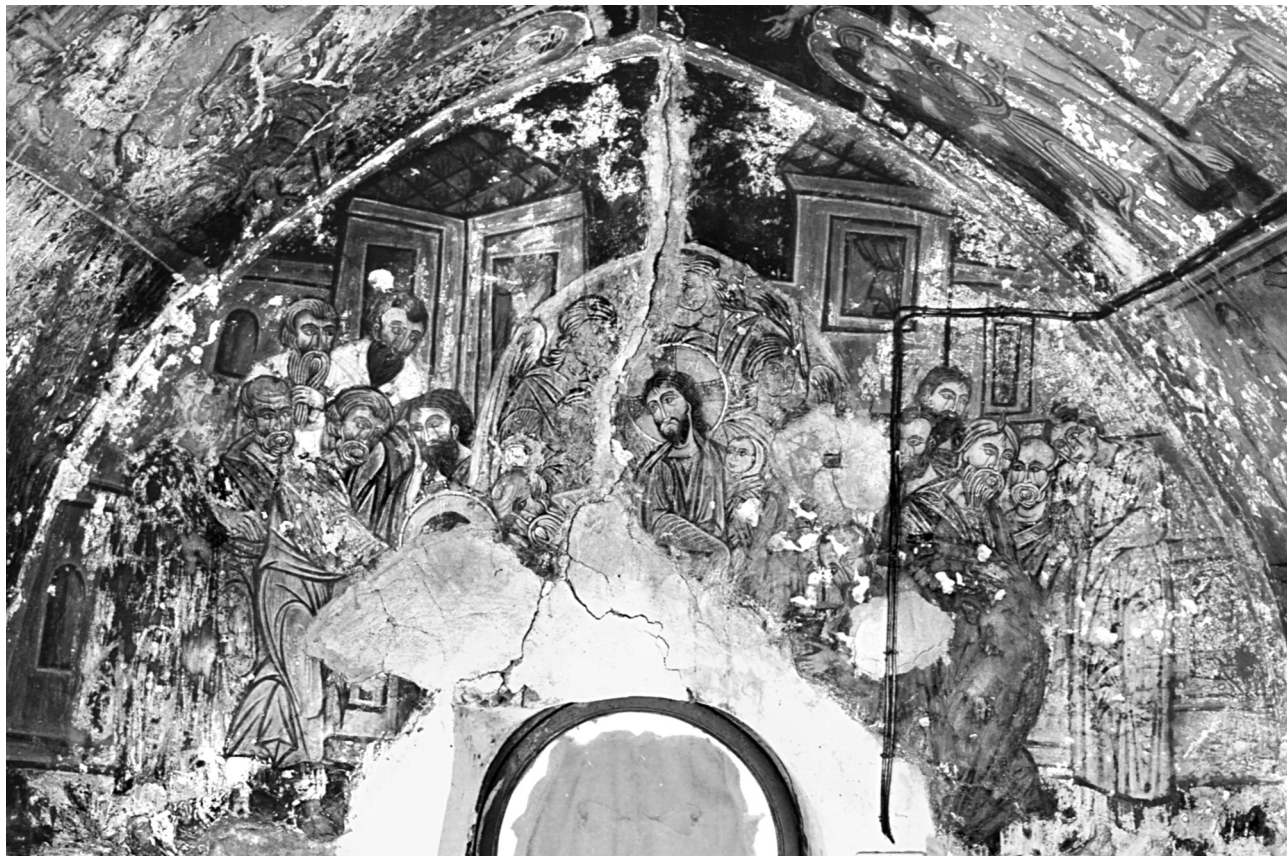
Εικ. 16. Σέλινο, Κάδρος, ναός Παναγίας. Η Κοίμηση της Θεοτόκου.

Εκεί βέβαια η όρθια στάση έχει νόημα, διότι ο Χριστός υψώνει την ψυχή της μητέρας του, για να την παραδώσει στους δύο αγγέλους που καταφθάνουν από τον ουρανό να την παραλάβουν, στοιχείο που απουσιάζει από την τοιχογραφία. Την ελλειπτική, αχνή, γαλανόφαιη δόξα πίσω από τον Ιησού, η οποία εξαίρει τη λεπτόσωμη και ασυνήθιστα μικροκαμωμένη μορφή του 121 , πληρούν πέντε άγγελοι σε μονοχρωμία – από το χαμηλότερο δεξιά διατηρούνται αμυδρά ίχνη –, σε κλιμακωτή διάταξη και ενδιαφέρουσα ρυθμική, αντιθετική στάση, άγνωστη από αλλού. Η απεικόνιση πέντε αγγέλων μέσα στη δόξα, αντί των συνήθως τεσσάρων, θα μπορούσε να αιτιολογηθεί από την παράλειψη εδώ του καθιερωμένου στην εποχή εξαπτέρυγου χερουβείμ, τη θέση του οποίου καταλαμβάνει ο κορυφαίος άγγελος 122 . Η γνωστή από παλαιολόγειες απεικονίσεις απόδοση των αγγέλων σε μονοχρωμία, όπως στη Μονή της Χώρας 123 , με εξαιρετικά επιδέξιο, περιληπτικό και ελεύθερο γραμμικό σχέδιο, παραδίδει μορφές εντυπωσιακές, αριστο-