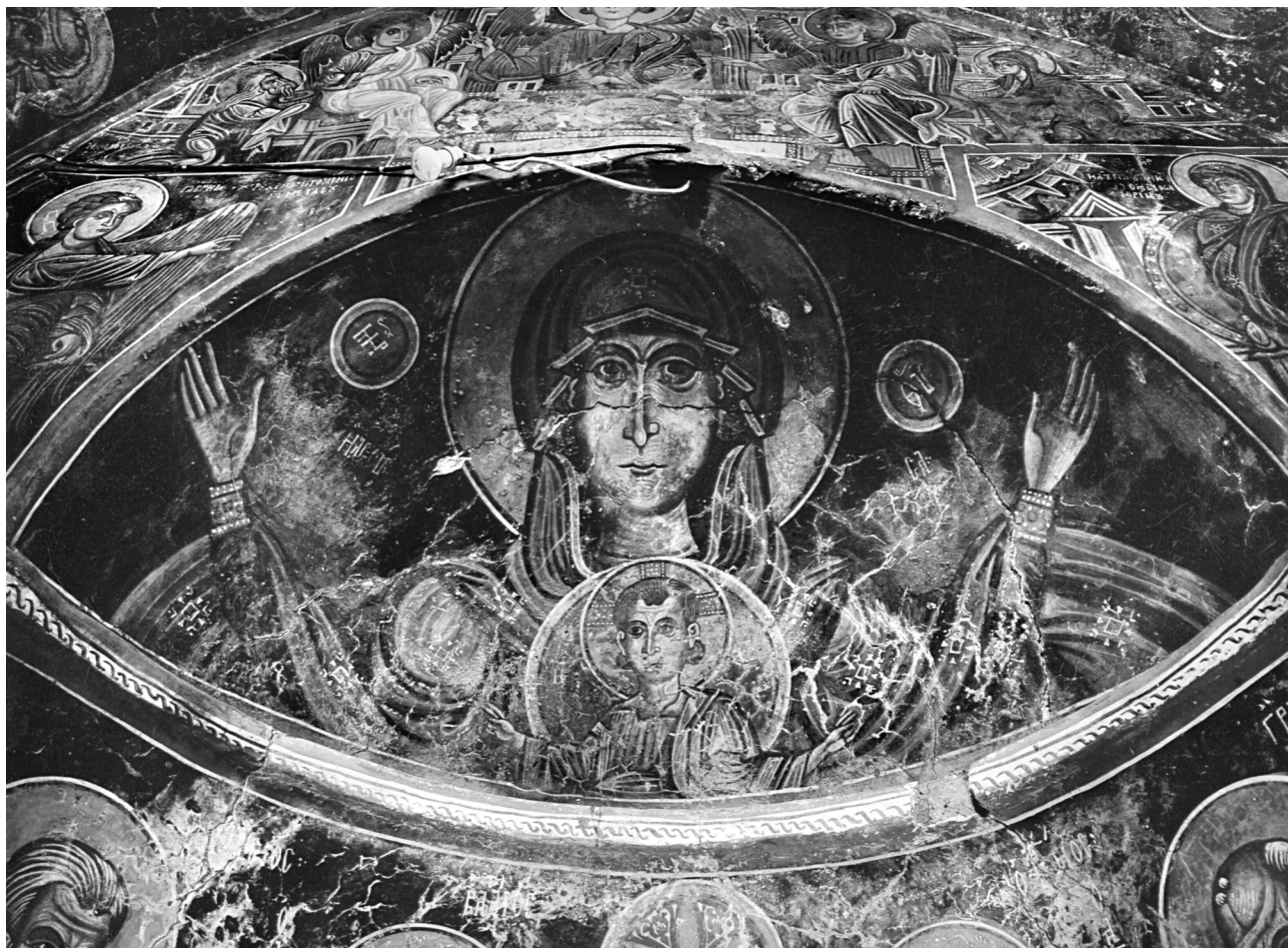
Εικ. 1. Σέλινο, Κάδρος, ναός Παναγίας. Παναγία Βλαχερνίτισσα, η Ελεούσα.

στον Βουτά (1330-1350) και στον Άγιο Ιωάννη στον Ασφεντηλέ (1330-1350) 5 , αφότου ο Ιωάννης Παγωμένος την χρησιμοποίησε στην παράσταση της ένθρονης Βρεφοκρατούσας στην Παναγία στο Κακοδίκι (1331/2) 6 , στο ανατολικό αφίδωμα του βόρειου τοίχου. Είναι ενδιαφέρον ότι οι ζωγράφοι αυτοί όχι μόνο επαναλαμβάνουν την προσωνυμία αλλά και σχεδόν αντιγράφουν τον φυσιογνωμικό τύπο της Θεοτόκου, που ο Παγωμένος φιλοτέχνησε στο Κακοδίκι.