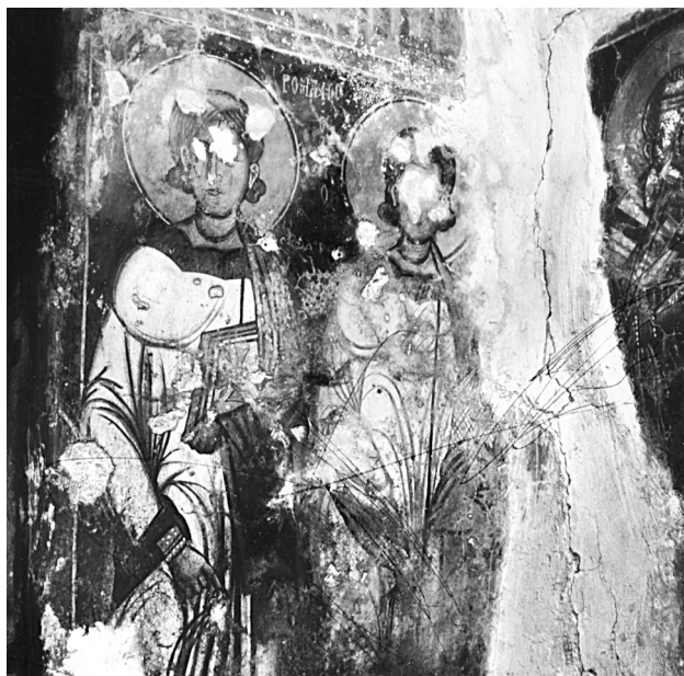
Εικ. 20. Σέλινο, Κακοδίκι, ναός Παναγίας. Ο διάκονος Ρωμανός.

Οι δύο ζωγράφοι που εκτέλεσαν τις τοιχογραφίες της Παναγίας στο Κάδρος ανήκουν αδιαμφισβήτητα στον κύκλο των στενών συνεργατών ή των μαθητών-διαδόχων του Παγωμένου, επειδή σε μεγάλο βαθμό υιοθετούν τεχνική, τεχνοτροπία και εικονογραφικούς τύπους που εκείνος χρησιμοποιεί, που συχνά αποδίδουν με αισθητή διαφοροποίηση, ανάλογα με το τάλαντο, την εμπειρία και την παιδεία τους.