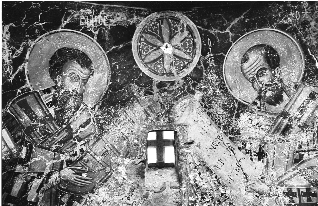
Εικ. 2. Σέλινο, Κάδρος, ναός Παναγίας. Συλλειτουργούντες ιεράρχες (τιμήμα) και κόσμημα αφίδας ιερού.

του 13ου αιώνα 7 , αλλά και σε τοιχογραφίες αγιογράφων της «σχολής» του Παγωμένου, λόγω χάρη στη Βλαχερνίτισσα στην Παναγία στα Σκουδιανά Κανδάνου (γύρω στο 1350) 8 .