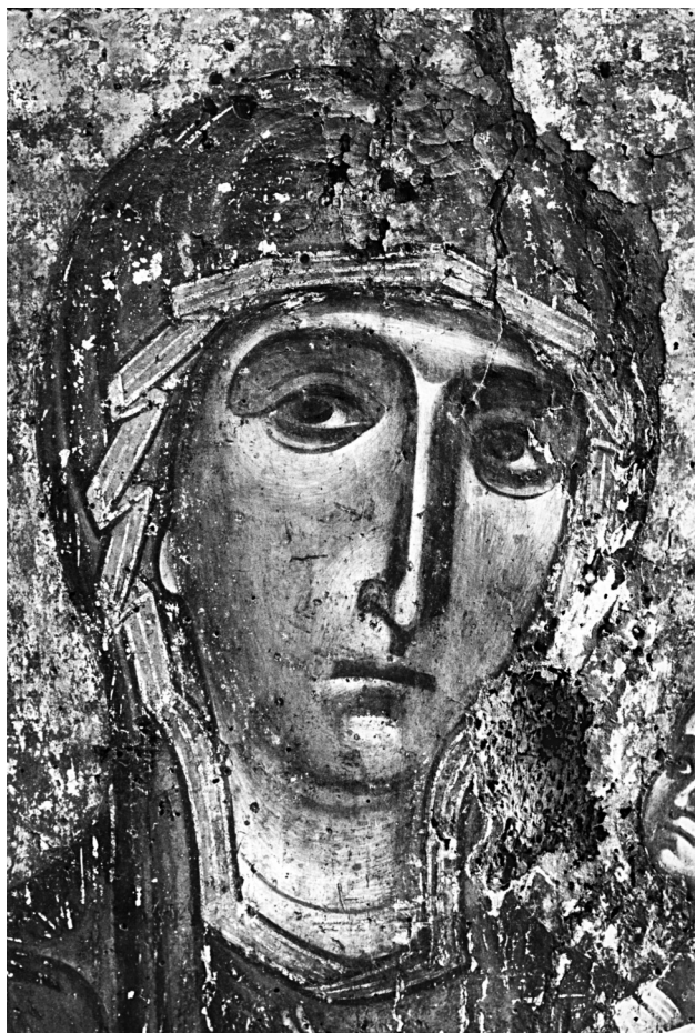
Εικ. 2. Η Παναγία (λεπτομέρεια της Εικ. 1).

αποδόσης του προσώπου με τις μαλακές φωτισκιάσεις, τις περιορισμένες φωτεινές επιφάνειες και την εκφραστική ποιότητα της λεπταίσθητης μελαγχολικής έκφρασης.