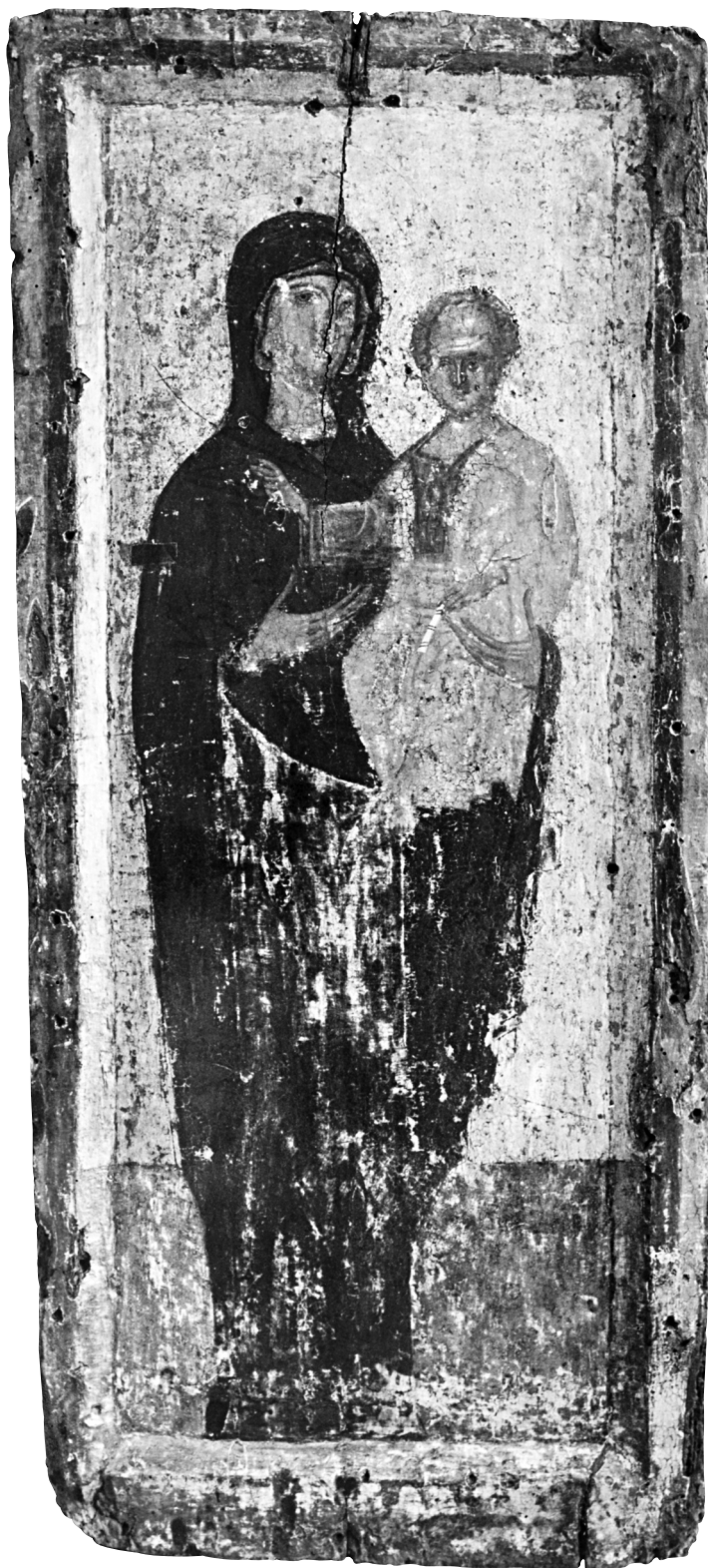
Εικ. 4. Ιωάννινα, ναός Κοιμήσεως της Θεοτόκου. Η Παναγία ολόσωμη, Βρεφοκρατούσα.

Παύλου (τέλη 14ου αιώνα) και η Παναγία Οδηγήτρια του Μουσείου Zagorsk στη Ρωσία (τελευταίο τέταρτο 14ου αιώνα) 24 , η οποία θεωρείται ότι προέρχεται από την Κωνσταντινούπολη.