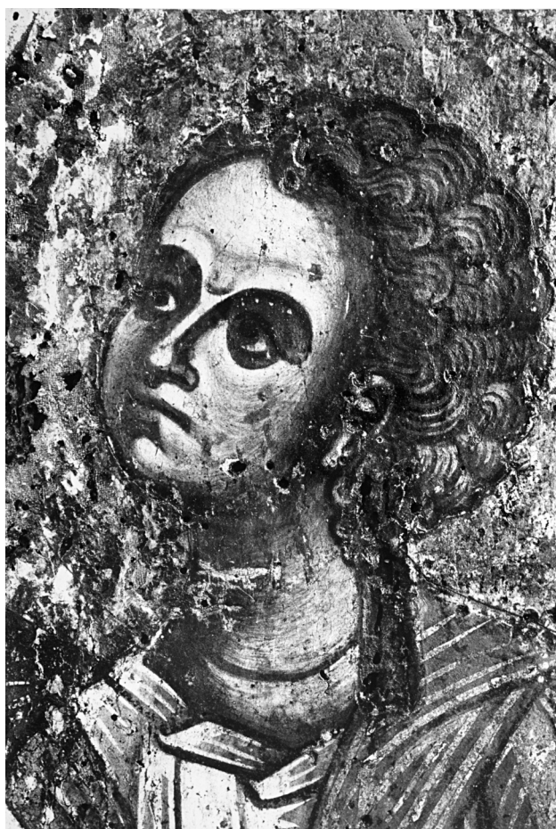
Εικ. 3. Ο Χριστός (λεπτομέρεια της Εικ. 1).

Από την άλλη ο φυσιγνωμικός τύπος του Χριστού (Εικ. 3) με το σφαιρικό πρόσωπο, τα βαθυσκιασμένα μάτια με τα σπαθωτά φρύδια, την αδρή μύτη, τα βοστρυχωτά, κατσαρά μαλλιά που φθάνουν ως τη βάση του λαιμού και τον υψηλό κυλινδρικό λαιμό παρουσιάζει κοινά στοιχεία με απεικονίσεις του σε έργα του δεύτερου μισού του 12ου αιώνα εργαστηρίων της Καστοριάς, όπως είναι ο Χριστός της Παναγίας Βρεφοκρατούσας στον Άγιο Νικόλαο του Κασνίτζη (1160-1180), ο Χριστός της Παναγίας Βρεφοκρατούσας στην κτητορική παράσταση των Αγίων Αναργύρων (γύρω στο 1180) 14 , ο υδρωπικός σε σκηνή του βίου των αγίων Αναργύρων στον ομώνυμο ναό της Καστοριάς 15 , ο Χριστός από την