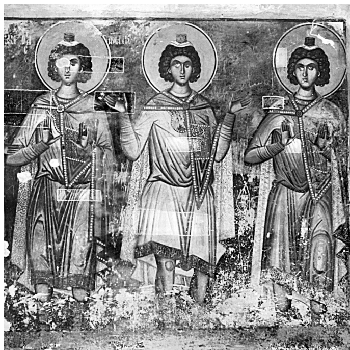
Εικ. 9. Treskavac. Οι άγιοι Ανανίας, Αζαρίας και Μισαήλ (1348).

Τυπολογικά οι μορφές των τριών αγίων είναι κανονικές, με μικρά σχετικά κεφάλια και πτυχολογία στους