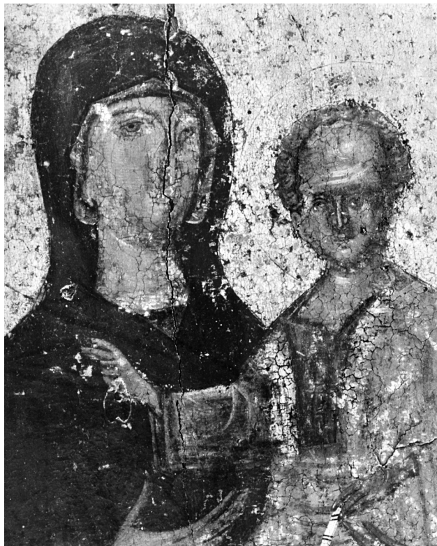
Εικ. 5. Η Παναγία με τον Χριστό (λεπτομέρεια της Εικ. 4).