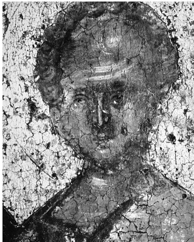
Εικ. 6. Ο Χριστός (λεπτομέρεια της Εικ. 4).

που τον πλαισιώνουν στρέφουν ελαφρά την κεφαλή και το σώμα προς το κέντρο, κρατώντας στο δεξιό χέρι σταυρό, ο οποίος, ωστόσο, δεν σώζεται. Οι τρεις άγιοι φορούν μακρύ, ποδήρη χιτώνα, με πλατιά χρυσοκέντητη παρυφή και από πάνω δαλματική με χρυσοκέντητη, μαργαριτοστόλιστη πλατιά ταινία στο άνω μέρος του ενδύματος, που καλύπτει και τους ώμους. Πλατιά, επίσης, χρυσοκέντητη ταινία ορίζει το κάτω μέρος της δαλματικής. Ο μεσαιός άγιος φοράει επιπλέον μανδύα, που πορπώνεται μπροστά στο στήθος. Οι τρεις άγιοι φέρουν στο κεφάλι ένα ιδιότυπο κάλυμμα, την κίδαρη, χαρακτηριστικό καπέλο των Εβραίων ιερέων. Στο άνω μέρος της εικόνας, μέσα σε ημικυκλική δόξα, παριστάνεται σε προτομή, ευλογών με τα δύο χέρια σε έκταση ο Χριστός Εμμανουήλ.