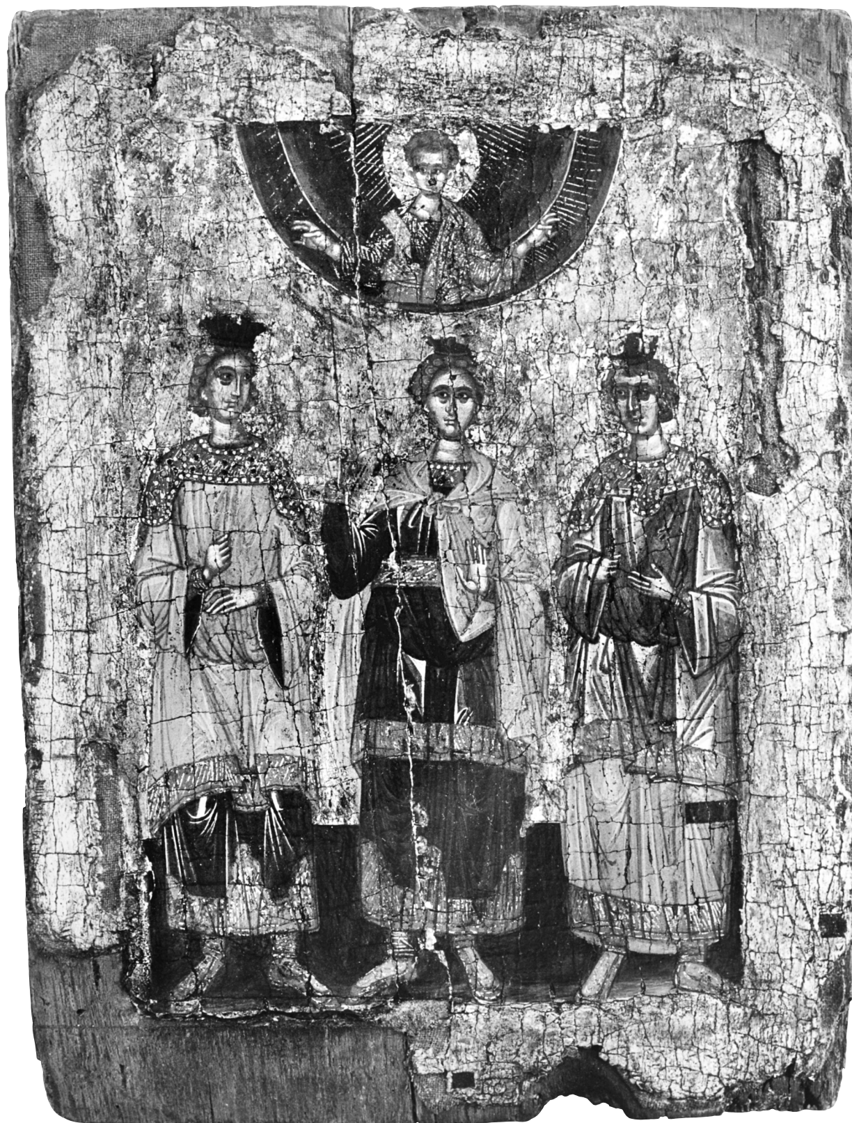
Εικ. 7. Ιωάννινα, ναός Κοιμήσεως της Θεοτόκου. Οι άγιοι Ανανίας, Αζαρίας και Μισαήλ.