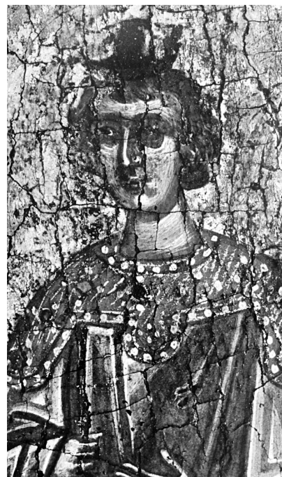
Εικ. 10. Ο Ανανίας (λεπτομέρεια της Εικ. 7). Εικ. 11. Ο Αζαρίας (λεπτομέρεια της Εικ. 7). Εικ. 12. Ο Μισαΐλ (λεπτομέρεια της Εικ. 7).

χιτώνες, που πέφτει με πλατιές, κάθετες πτυχώσεις, ενώ στη δαλματική αποδίδεται με γεωμετρικά φωτεινά επίπεδα, που οριοθετούνται με βαθιές πτυχώσεις. Παράλληλα, διακριτική είναι η υποδήλωση του σωματικού όγκου, που περιορίζεται στα γόνατα και στους μηρούς.