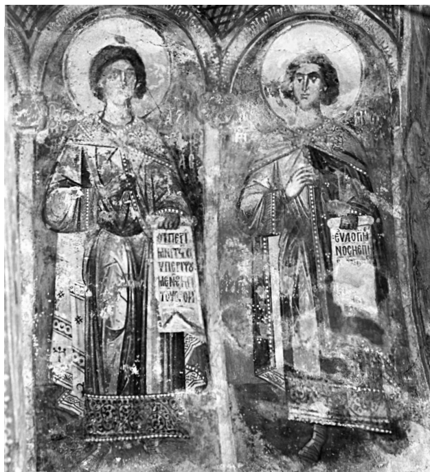
Εικ. 8. Pološko. Οι άγιοι Αζαρίας και Μισαήλ (1343).

μάρτυρες, εικονογραφικός τύπος, ο οποίος κατά τη βυζαντινή περίοδο χρησιμοποιείται παράλληλα με τον τύπο των αγίων, που παριστάνονται ως μάρτυρες ημίσωμοι 29 ή κατ' εξοχήν μέσα σε μετάλλια 30 .