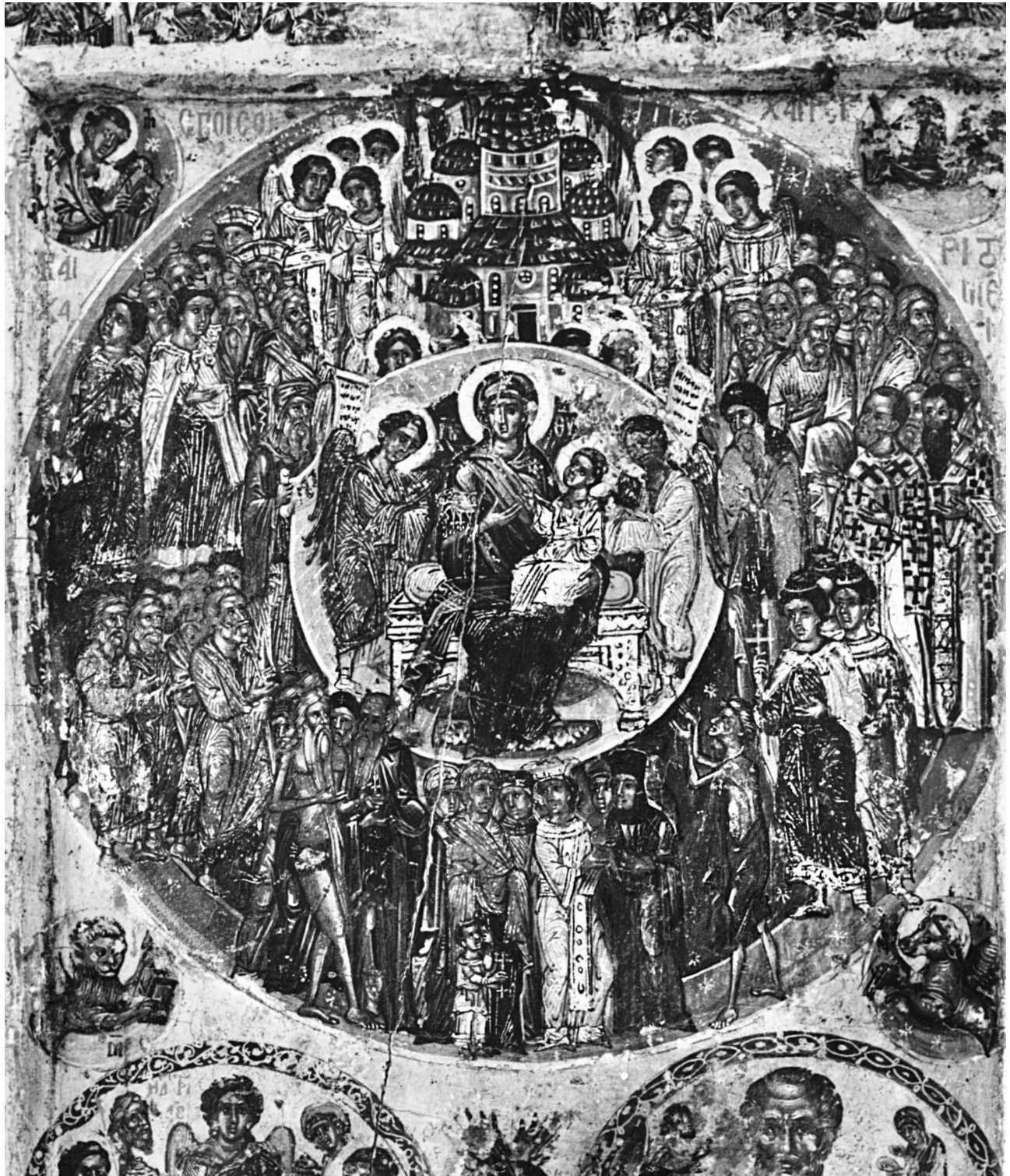
Εικ. 2. Κεντρικό τμήμα, «Ἐπὶ σοὶ χαίρει» (λεπτομέρεια τῆς Εικ. 1).