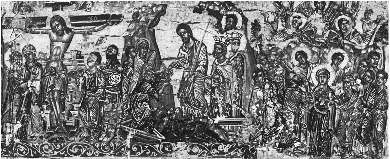
Εικ. 4. Η Σταύρωση, η Ανάσταση και η Ανάληψη (λεπτομέρεια της Εικ. 1).

στο χρυσό κάμπο. Από αριστερά, επάνω εικονίζονται ο Ευαγγελισμός, η Έγερση του Λαζάρου, η Βαϊοφόρος, η Σταύρωση, η Ανάσταση και η Ανάληψη· κάτω, η Πεντηκοστή, η Μεταμόρφωση, η Γέννηση, η Υπαπαντή, η Βάπτιση και η Κοίμηση της Θεοτόκου. Στις κάθετες πλευρές ανιστορούνται αριστερά ο Μυστικός Δείπνος, ο Νιπήρας, η Προσευχή, η Προδοσία και η Κρίση των αρχιερέων· δεξιά, η Άρνηση του Πέτρου, η Μαστίγωση, ο Εμπαιγμός, η Απόνηψη του Πιλάτου και ο Επιτάφιος Θρήνος 6 . Πιο κάτω προστίθενται δύο