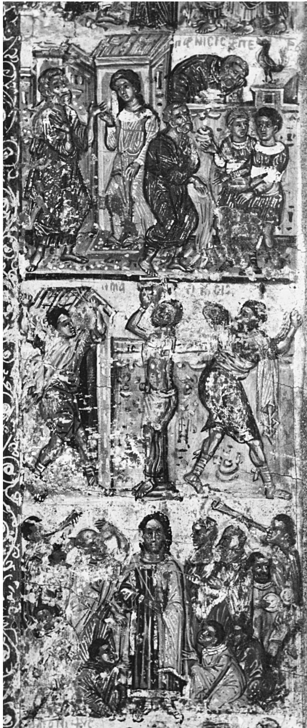
Εικ. 8. Η Άρνηση του Πέτρου, η Μαστίγωση και ο Εμπαυγμός (λεπτομέρεια της Εικ. 1).