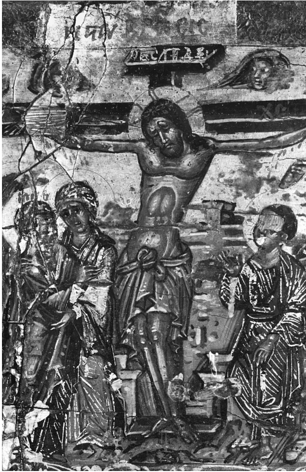
Εικ. 11. Η Σταύρωση (λεπτομέρεια της Εικ. 1).

του Μέρωνα, από τους ύστερους χρόνους του 14ου αιώνα 24 με τον Χριστό, επίσης, να γυρίζει προς το μέρος του Πέτρου, που ακολουθεί πίσω του. Τα ίδια στοιχεία επισημαίνονται κατά το 16ο αιώνα στη Βαΐοφόρο του Αγίου Νικολάου του Αναπαυσά στα Μετέωρα 25 και στην εικόνα από το Δωδεκάορτο της μονής Σταυρονικήτα 26 . Ας παρατηρηθεί, σε λεπτομέρεια, και η χαρακτηριστική δόξα του Χριστού (Εικ. 1) στην ομοίτυπη Μεταμόρφωση της εικόνας του Νικολάου Ρίτζου στο Σεράγεβο 27 . Παραπλήσια στη Σταύρωση (Εικ. 4, 11) με της εικόνας του Σεράγεβο είναι η μορφή του Χριστού και ανάλογη η απόδοση των τειχών της Ιερουσαλήμ, με τις δύο πύλες στο χαμηλότερο μέρος μπροστά 28 . Δόκιμα, εξάλλου, στοιχεία της κρητικής ζωγραφικής από το 14ο και το 15ο αιώνα συνιστούν το σύμπλεγμα της Παναγίας με τη Μυροφόρο που την