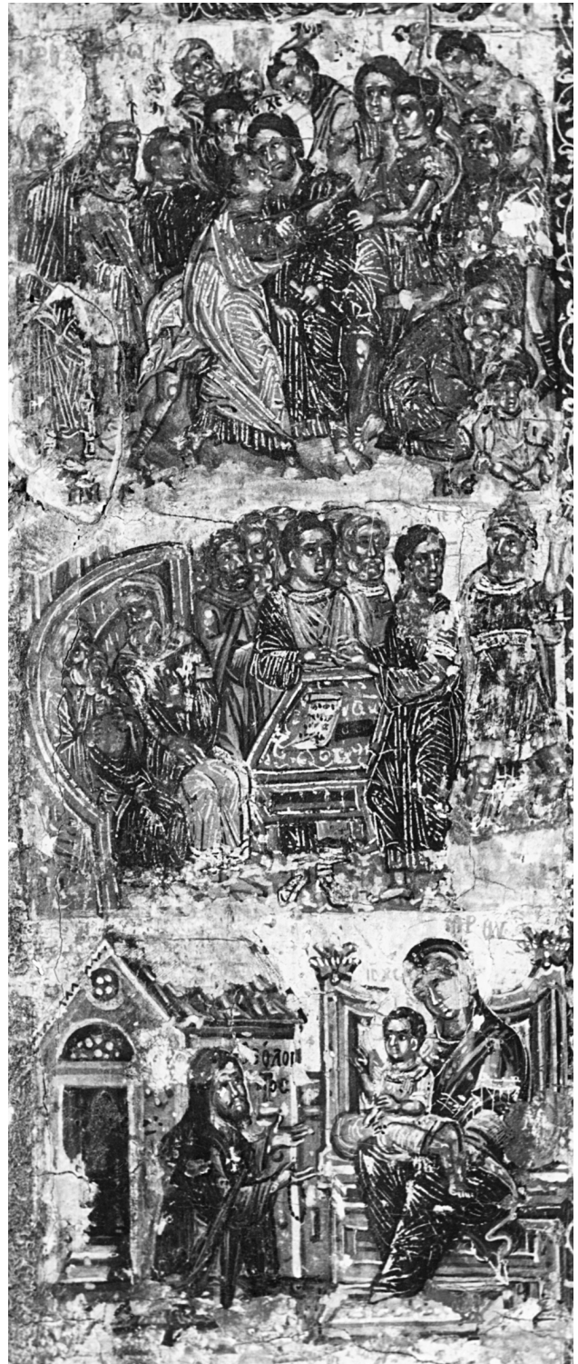
Εικ. 7. Η Προδοσία, η Κρίση των αρχιερέων και ο Θεόληπτος δεόμενος στη Θεοτόκο (λεπτομέρεια της Εικ. 1).