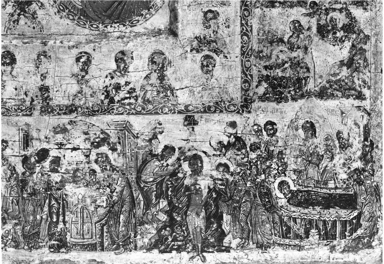
Εικ. 5. Η Υπαπαντή, η Βάπτιση, η Κοίμηση, η Φλεγόμενη Βάτος και οι άγιοι Τεσσαράκοντα (λεπτομέρεια της Εικ. 1).

επεισόδια 7 . Μεγαλογράμματα επιγραφές, κατά κανόνα με κόκκινο χρώμα, συνοδεύουν όλες τις παραστάσεις και τις άγιες μορφές.