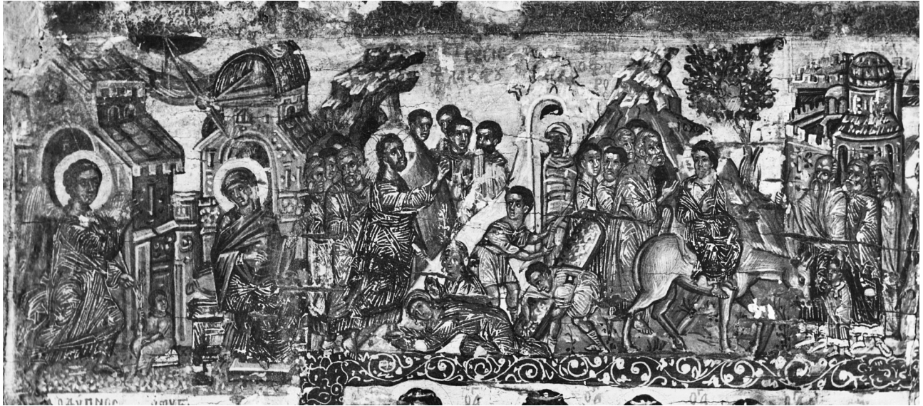
Εικ. 3. Ο Ευαγγελισμός, η Έγερση του Λαζάρου και η Βαϊοφόρος (λεπτομέρεια της Εικ. 1).