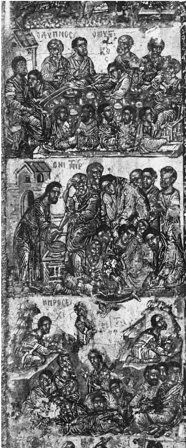
Εικ. 6. Ο Μυστικός Δείπνος, ο Νιπήρας και η Προσευχή (λεπτομέρεια της Εικ. 1).