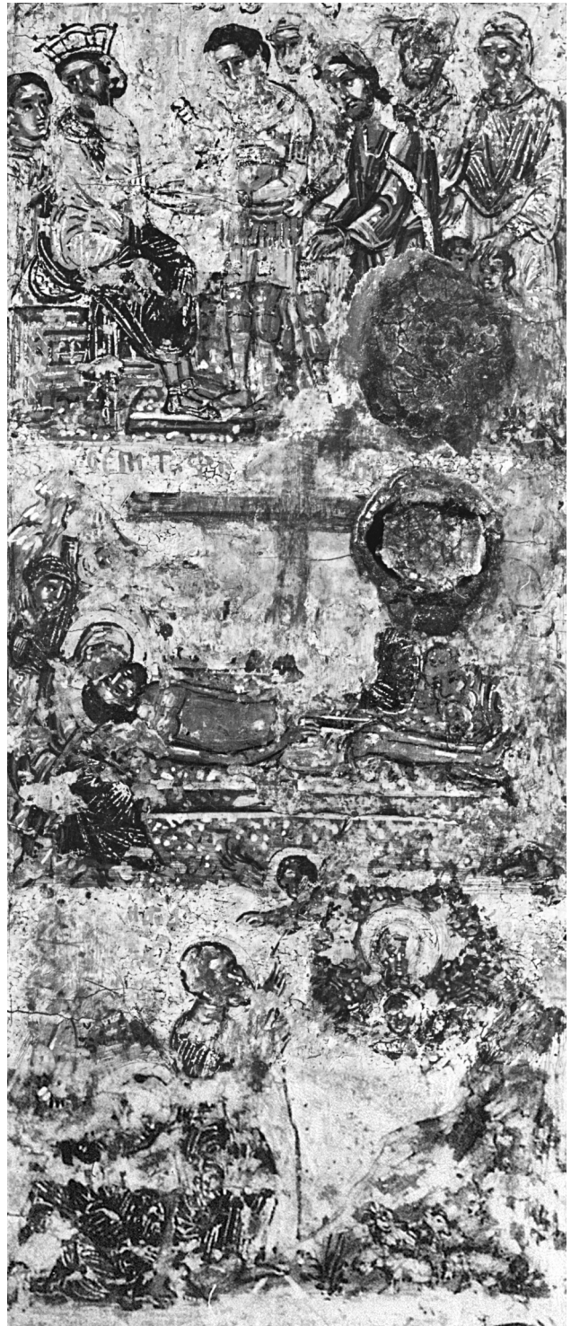
Εικ. 9. Η Απόνιση του Πιλάτου, ο Επιτάφιος Θρήνος και η Βάτος (λεπτομέρεια της Εικ. 1).