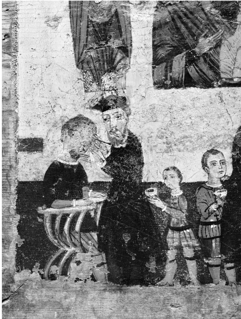
Fig. 3. Enseigne de chirurgien, face b (détail de la Fig. 2).

Aucun espace n'est défini de manière rigide, les personnages saints et les scènes de soins se détachant sur un fond d'or uni. Nonobstant l'absence de séparation, les deux registres sont distincts, tout en permettant aux pieds des saints de toucher à gauche la tête du médecin et à droite la tête de la femme.