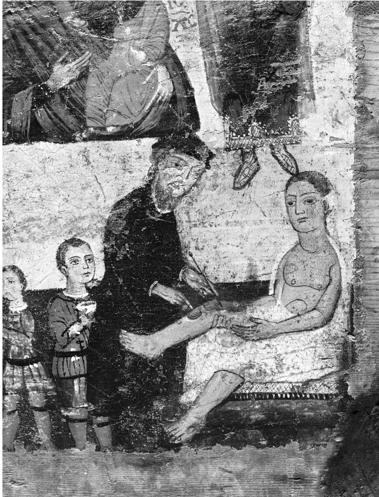
Fig. 4. Enseigne de chirurgien, face b (détail de la Fig. 2).

Dans le contexte de l'étude du vêtement à Chypre au XVI e siècle cette oeuvre tient une place d'exception, car elle montre des soignants en plein exercice de leur art. Peut-on considérer leur habit comme celui d'un corps de métier? Jusqu'à présent aucun autre document n'apporte des informations supplémentaires, nécessaires à une généralisation. Le matériel occidental, plus riche, fournit des exemples contradictoires. Dans certaines villes italiennes les règlements des guildes de médecins donnent les signes distinctifs de l'habit d'un docteur, ayant fait des études universitaires, qui sont interdits aux chirurgiens (p. ex. à Piacenza ou à Milan) 8 . Dans d'autres (p. ex. à Venise), où l'habit noir se généralise au XVI e siècle, rien ne semble caractériser les différents corps de métiers, quoiqu'en dise le dot-tor Gratiano: « ... E chi non cred la mia scientia bona / Guarda la vesta, e po la mia persona » 9 .