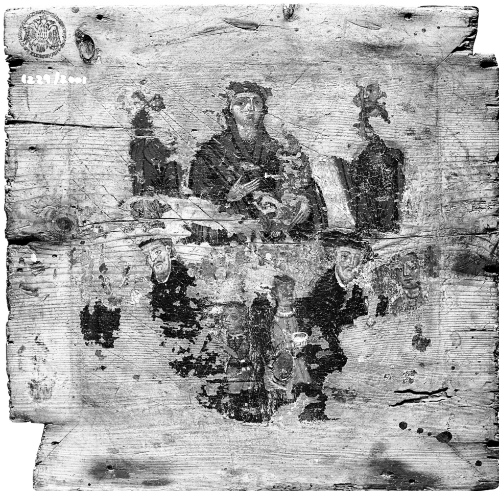
Fig. 1. Klirou, provenant de l'église de Panagia. Enseigne de chirurgien, face a.

Unique jusqu'à présent dans le matériel chypriote, cette oeuvre offre des informations aussi bien du point de vue vestimentaire que du mobilier, mais aussi sur quelques-unes des pratiques de soins chirurgicaux. Intéressante aussi par sa forme carrée et les deux images identiques représentées sur ses deux faces, elle soulève la curiosité concernant son usage.