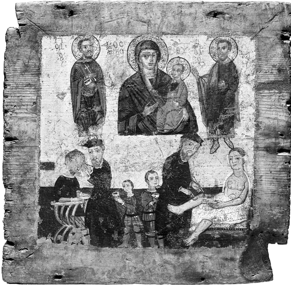
Fig. 2. Enseigne de chirurgien, face b.

de leur art : une boîte à médicaments et une lancette, ou une cuillère. Cette dernière s'allongeant en une croix dans l'oeuvre qu'on étudie.