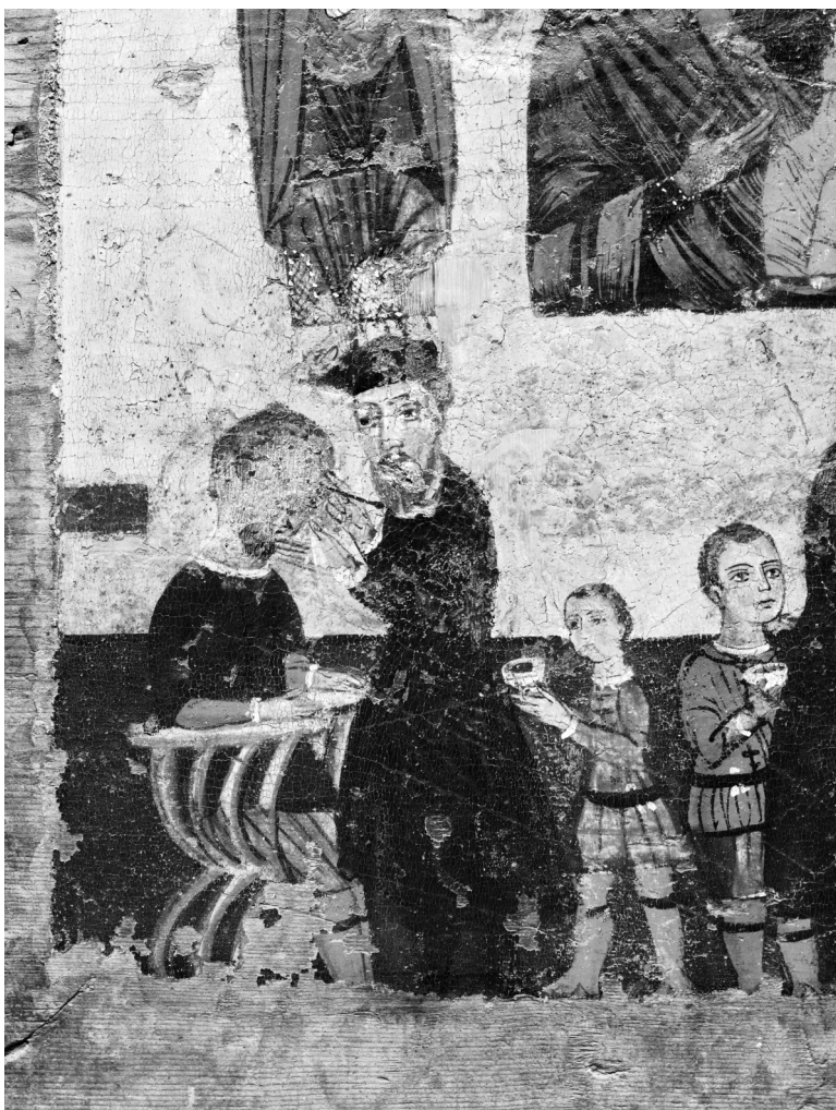
Fig. 3. Enseigne de chirurgien, face b (détail de la Fig. 2).

Aucun espace n'est défini de manière rigide, les personnages saints et les scènes de soins se détachant sur un fond d'or uni. Nonobstant l'absence de séparation, les deux registres sont distincts, tout en permettant aux pieds des saints de toucher à gauche la tête du médecin et à droite la tête de la femme.