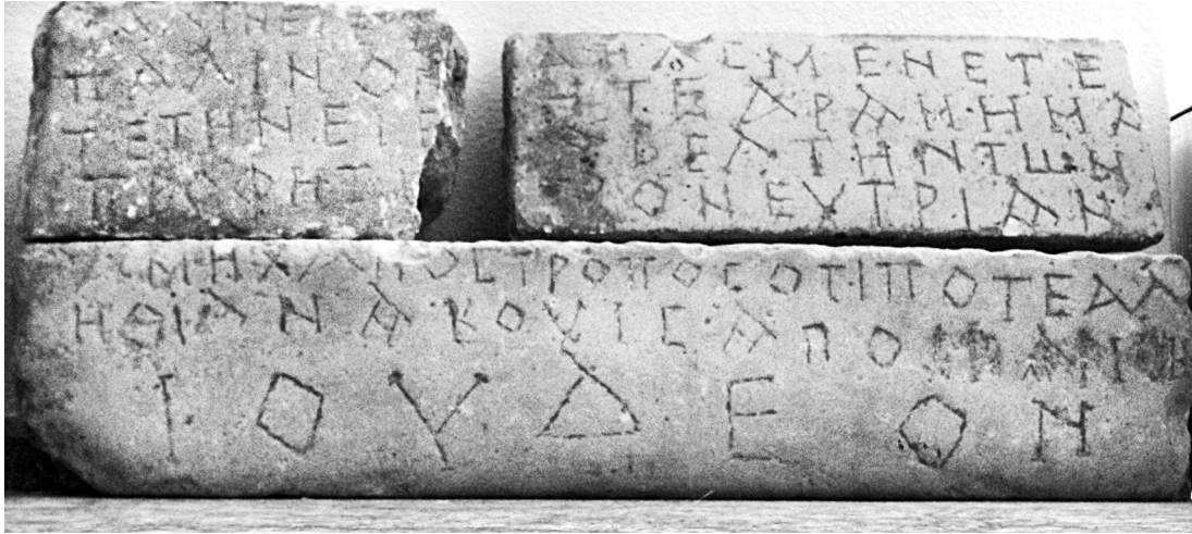
Εικ. 8. Κάμπος. Επιγραφή για τους Ιουδαίους της Ικαρίας (IG 12.6.2.1263).