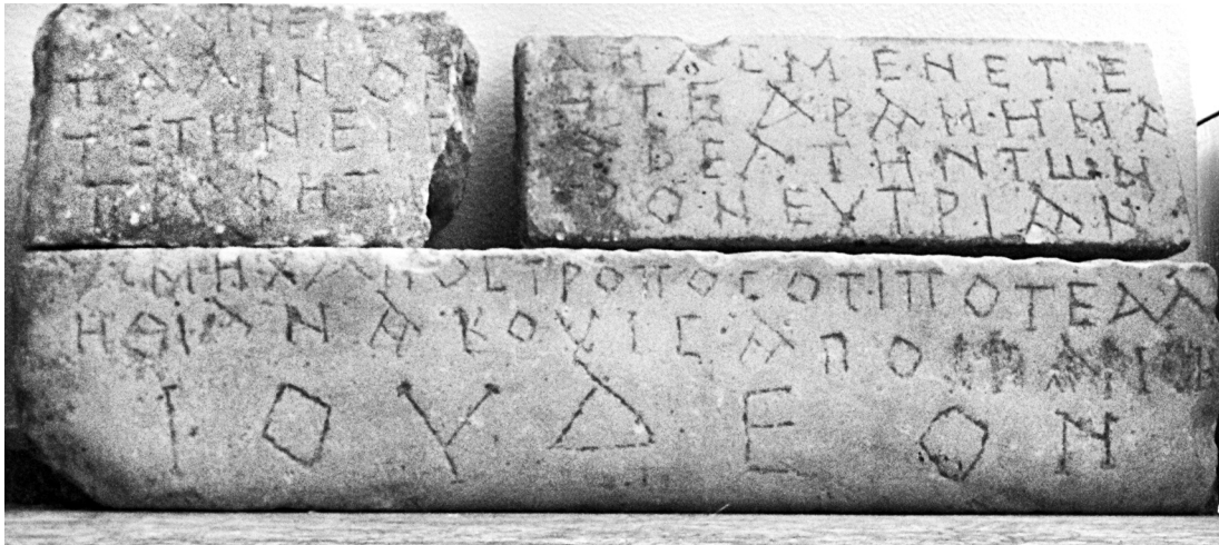
Εικ. 8. Κάμπος. Επιγραφή για τους Ιουδαίους της Ικαρίας (IG 12.6.2.1263).