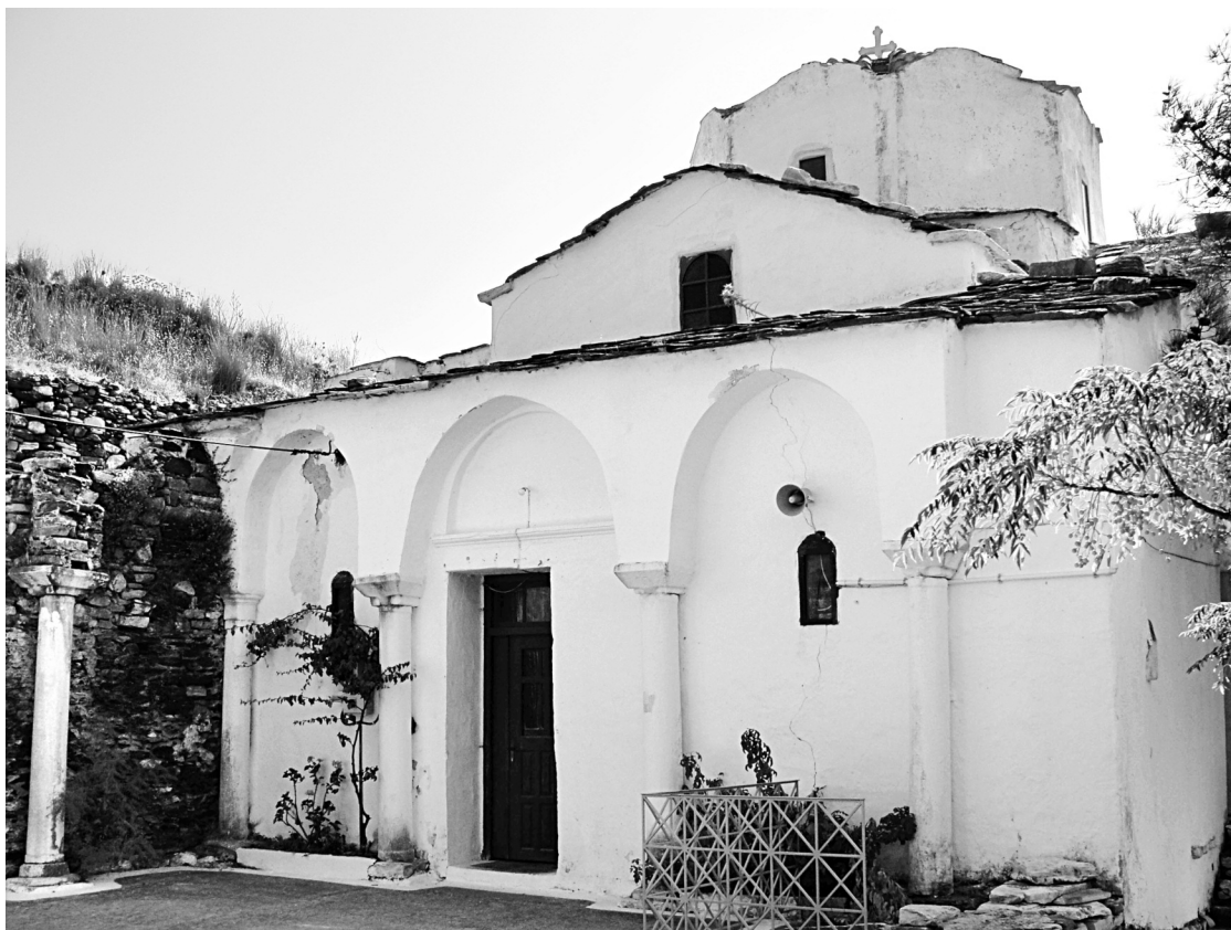
Εικ. 2. Κάμπος, ναός Αγίας Ειρήνης. Διακρίνονται οι κίονες της παλαιοχριστιανικής βασιλικής σε δεύτερη χρήση.