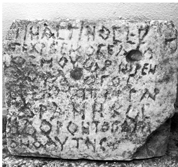
Εικ. 3. Κάμπος, ναός Αγίας Ειρήνης. Τμήμα της επιγραφής με το χρησμό του Απόλλωνα (IG 12.6.2.1265).

Ο χρησμός αυτός με μικρές παραλλαγές συναντάται και αλλού, και συγκεκριμένα σε γραπτές πηγές του ύστερου