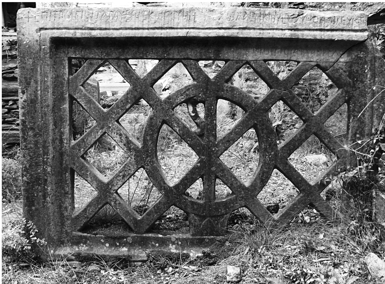
Εικ. 6. Ενεπίγραφο θωράκιο όπου αναφέρεται «το ευκτήριον του Αρχαγγέλου».

αναφορά για την ύπαρξη επισκοπής Ικαρίας. Αν και η επόμενη σχετική μαρτυρία προέρχεται από τον 9ο/10ο αιώνα 15 , κάτι τέτοιο δεν φαίνεται απίθανο, δεδομένου ότι αυτόνομη επισκοπή μαρτυρείται για πρώτη φορά πάλι τον 6ο αιώνα και για τη μικρότερη σε μέγεθος Λέρο 16 . Σε αντίθετη περίπτωση θα υπέθετε κανείς ότι η Ικαρία μαζί με τους Φούρνους (αρχ. Κορασσία) υπαγόταν στην επισκοπή της γειτονικής Σάμου 17 . Στο πρώτο κείμενο βρίσκουμε την, επίσης, σημαντική πληροφορία για την ύπαρξη ναού αφιερωμένου στον Αρχάγγελο. Κατά πάσα πιθανότητα, αναφέρεται στον Αρχάγγελο Μιχαήλ. Η χριστιανική λατρεία των Αρχαγγέλων υπήρξε αρκετά διαδεδομένη στις πόλεις της Μικράς Ασίας και των νησιών, με έντονη παρουσία στην πόλη της Μιλήτου 18 . Εκεί μεταξύ άλλων σχετικών αναφορών, γνωρίζουμε ότι ο παλαιότερος και σημαντικότερος ναός