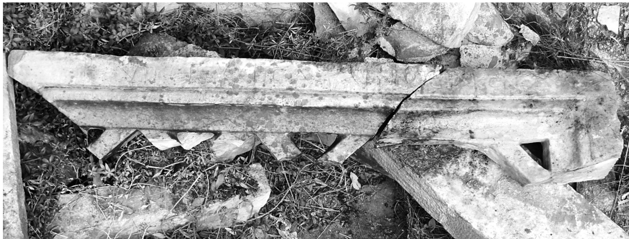
Εικ. 7. Ενεπίγραφο θωράκιο με αφιερωματική επιγραφή.

στο κέντρο της πόλης ήταν αφιερωμένος στον Αρχάγγελο Μιχαήλ. Εκείνη η εκκλησία είχε ανεγερθεί στα ερείπια του ναού του Διονύσου 19 .