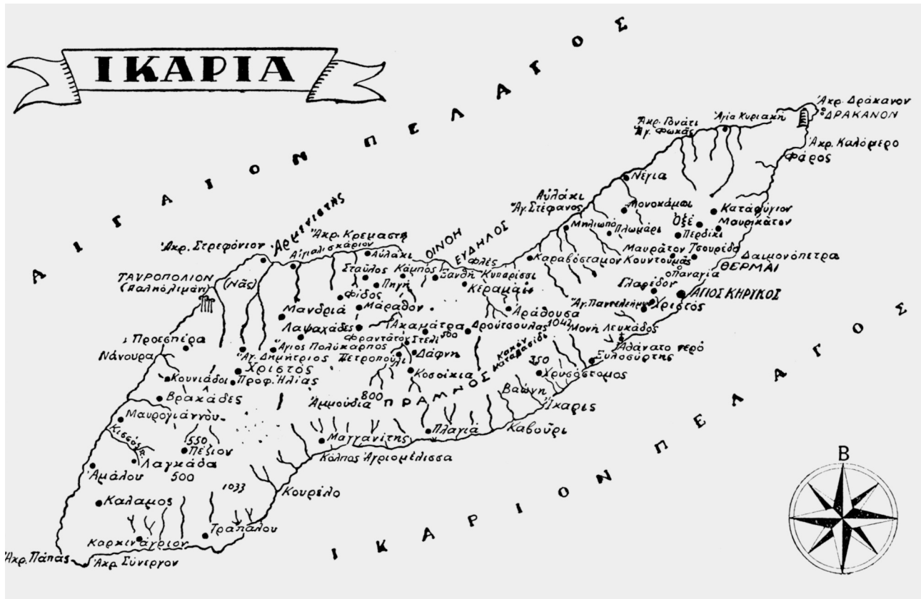
Εικ. 1. Χάρτης της νήσου Ικαρίας.

σταυροειδής μετά τρούλου ναός της Αγίας Ειρήνης στον Κάμπο (αρχαία Οινόη), μας αποκαλύπτουν μια άγνωστη όσο και συναρπαστική πτυχή της ιστορίας του νησιού: μας διηγούνται τη μετάβαση από τη λατρεία της Αρτέμιδος Ταυροπόλου σε εκείνη της Θεοτόκου Μαρίας (Εικ. 1).