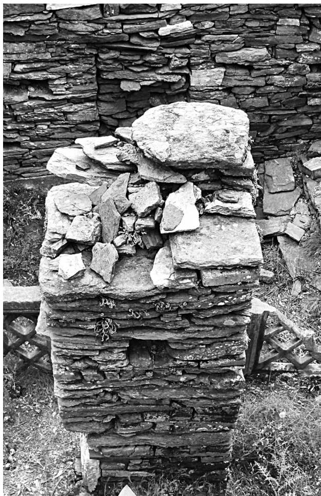
Εικ. 4. Μηλιωπό, εκκλησία στη θέση «Ταξιαρχής». Διακρίνονται χαμηλά τα δύο μαρμάρινα θωράκια.

προσοχή μου στις υπόλοιπες επιγραφές μεταξύ των οποίων και δύο ουσιαστικά αδημοσίευτων κειμένων, τα οποία δεν συμπεριλαμβάνονται στην τελευταία έκδοση των επιγραφών της Ικαρίας. Πρόκειται για δύο αφιερωματικές χριστιανικές επιγραφές που βρέθηκαν στην περιοχή Μηλιωπό Ικαρίας (Εικ. 1, 4). Ήταν χαραγμένες στο πάνω τμήμα δύο παλαιοχριστιανικών διάτρητων δικτυωτών θωρακίων, τα οποία μαζί με άλλα μαρμάρινα αρχιτεκτονικά μέλη συνανήκαν με οικοδομικά κατάλοιπα εκκλησίας στη θέση αυτή (Εικ. 5-7) 12 . Διαβάζουμε: