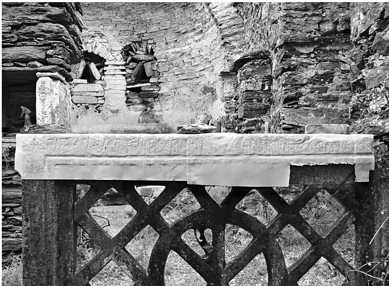
Εικ. 5. Ενεπίγραφο θωράκιο όπου αναφέρεται «το ευκτήριον του Αρχανγέλου» κατά την παραγωγή εκτύπου. Διακρίνεται στο βάθος η αψίδα του ναού.