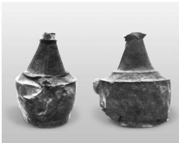
Εικ. 15. Οινοχόες από το «θησαυρό» Ολυμπία/1877.

Πριολίθου τριφυλλόσχημο στόμο χαρακτηρίζει τόσο τη μία οινοχόη της Ολυμπίας 45 όσο και την οινοχόη από την Ανδρίτσα (ΧΑ 3). Η οινοχόη από τον Πριολίθιο διαφοροποιείται από τις προαναφερθείσες μόνον ως προς την απόδοση της βάσης και ως προς την απουσία περαιτέρω διακόσμησης κατά μήκος του λαιμού. Ως προς την έντονη νεύρωση που διακρίνει το πέραςμα από το κυρίως σώμα του αγγείου προς τον ώμο και ως προς το τριφυλλόσχημο στόμό του έχει, επίσης, αναλογίες με μεταλλικές οινοχόες από την Ολυμπία 46 , το σπήλαιο της Ανδρίτσας (αδημοσίευτη οινοχόη ΧΑ 2), τη Σάμο 47 , τη Ζογειριά Σπετσών 48 , την Πέργαμο 49 και τις Σάρδεις 50 , διαφοροποιείται όμως εμφανώς από αυτές ως προς τη διαμόρφωση του σώματος, που έχει λοξά ή κάθετα τοιχώματα, και τον έξεργο δακτύλιο στο μέσον περίπου του λαιμού αυτών των παραδειγμάτων. Κοινή πάντως, σε όλα σχεδόν τα παραδείγματα αυτά, είναι η απουσία λαβής, με εξαίρεση τα παραδείγματα από την Ανδρίτσα (αδημοσίευτη οινοχόη ΧΑ 2) τις Σπέτσες και την Πέργαμο. Όλες οι οινοχόες αυτές διέθεταν προφανώς, αρχικά λαβές οι οποίες συνδέονταν, μέσω ενός κατάλληλου δακτυλίου, με το λαιμό του αγγείου 51 . Το μικρό μέγεθος και το σχήμα των αγγείων αυτών καθιστούσαν δυνατή τη χρήση τους και ως θησαυραρίων, όπως συμβαίνει – εκτός από το αγγείο του Πριολίθου – στις περιπτώσεις αγγείων από τη Ζογειριά Σπετσών και την Ανδρίτσα Αργολίδας.