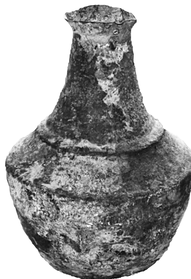
Εικ. 14. Η χάλκινη οينوχόη-θησαυράγιο μέσα στην οποία βρέθηκε ο «θησαυρός» του Πριολίθου/1977.

Η οينوχόη από τον Πριολίθο ανήκει σε μια χαρακτηριστική παραγωγή οينوχών, την τυπολογία των οποίων, τη γεωγραφική κατανομή, τα εργαστήρια κατασκευής τους και τη χρήση τους μελέτησε συνολικά η Brigitte Pitarakis 41 . Βάσει των τριών τύπων που διέκρινε η τελευταία, η οينوχόη του Πριολίθου έχει τις μεγαλύτερες αναλογίες με τον τύπο III ως προς τη διαμόρφωση του σώματος και του λαιμού και ως προς τη χαρακτηριστική νέυρωση στον ώμο 42 . Διαφοροποιείται από αυτόν ως προς τη διαμόρφωση της βάσης και ως προς την ύπαρξη τριφυλλόσχημου στομίου, στοιχείο που τη συσχετίζει με τον τύπο II της ίδιας κατηγοριοποίησης. Αναλυτικότερα, ως προς τη διαμόρφωση του σώματος, της χαρακτηριστικής νέυρωσης στον ώμο και του αναβαθμού στο λαιμό η οينوχόη του Πριολίθου έχει τις μεγαλύτερες ομοιότητες με δύο μεταλλικές οينوχές από την Ολυμπία 43 (Εικ. 15) και με δύο, αδημοσίευτες προς το παρόν, οينوχές από το σπήλαιο της Ανδρίτσας στην Αργολίδα 44 . Αξίζει να σημειωθεί ότι ανάλογο με του