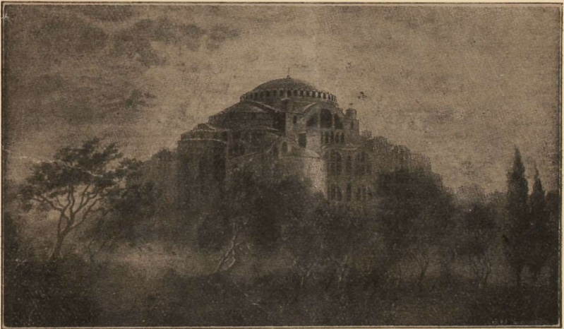
Ὁ ναός τῆς Ἁγίας Σοφίας ἐν Κωνσταντινουπόλει.

ΤΥΠΟΓΡΑΦΕΙΟΝ Ι. ΧΑΤΖΗΓΙΑΝΝΟΥ - ΚΟΛΟΚΥΝΘΟΥΣ 2