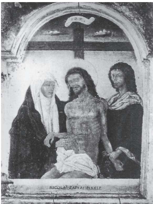
Εικ. 3. Νικόλαος Τζαφούρης, «Άκρα Ταπείνωση»/Pieta, Έρμιτάζ (Τριανταφυλλόπουλος, Μελέτες, εικ. 65).

ματα και την «ξύλινη» γλώσσα τους και τὸ μέσον νὰ μετατραπεί σὲ αὐτοσκοπὸ, ἢ εἰκονικὴ πραγματικότητα ( virtual reality ) νὰ ἐξουδετερώσει τὴν οὐσιαστικὴ μετοχὴ στὸ νόημα τοῦ συγκεκριμένου πολιτισμοῦ. Παινεύουμε τὴν ἐπανεκθέση τοῦ Κωνσταντίου, ὅπως καὶ τοῦ Μουσείου Βυζαντινοῦ Πολιτισμοῦ Θεσσαλονίκης, γιατί ἰσορροπῆσαν ἀνάμεσα σὲ ἀπαιτήσεις τῆς ἐπιστήμης καὶ σὲ εὐρύτερα αἰτήματα τῶν καιρῶν μας.