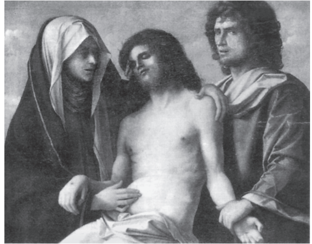
Εικ. 4. Giovanni Bellini (ἢ ἐργαστήριό του), πίνακας Θρήνου/Pietà, Βερολίνο (Τριανταφυλλόπουλος, Μελέτες, εικ. 66).

ἀλληγορίας, μάλιστα ἀπὸ ἄνθρωπο ποὺ ἔμαθε ὀδυνηρὰ τι σημαίνει ὑπέρβαση τῶν ὁρίων τοῦ δικαίου, κάνει τὴν ἀποφασιστικὴ τομῆ: