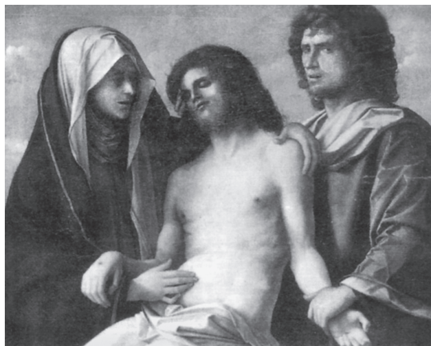
Εικ. 4. Giovanni Bellini (ἢ ἐργαστήριό του), πίνακας Θρήνου/Pietà, Βερολίνο (Τριανταφυλλόπουλος, Μελέτες, εικ. 66).

ἀλληγορίας, μάλιστα ἀπὸ ἄνθρωπο ποὺ ἔμαθε ὀδυνηρὰ τι σημαίνει ὑπέρβαση τῶν ὁρίων τοῦ δικαίου, κάνει τὴν ἀποφασιστικὴ τομῆ: