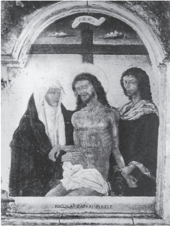
Εικ. 3. Νικόλαος Τζαφούρης, «Άκρα Ταπείνωση»/Pieta, Έρμιτάζ (Τριανταφυλλόπουλος, Μελέτες, εικ. 65).

ματα και την «ξύλινη» γλώσσα τους και τὸ μέσον νὰ μετατραπεί σὲ αὐτοσκοπὸ, ἢ εἰκονικὴ πραγματικότητα ( virtual reality ) νὰ ἐξουδετερώσει τὴν οὐσιαστικὴ μετοχὴ στὸ νόημα τοῦ συγκεκριμένου πολιτισμοῦ. Παινεύουμε τὴν ἐπανεκθέση τοῦ Κωνσταντίνου, ὅπως καὶ τοῦ Μουσείου Βυζαντινοῦ Πολιτισμοῦ Θεσσαλονίκης, γιατί ἰσορροπῆσαν ἀνάμεσα σὲ ἀπαιτήσεις τῆς ἐπιστήμης καὶ σὲ εὐρύτερα αἰτήματα τῶν καιρῶν μας.