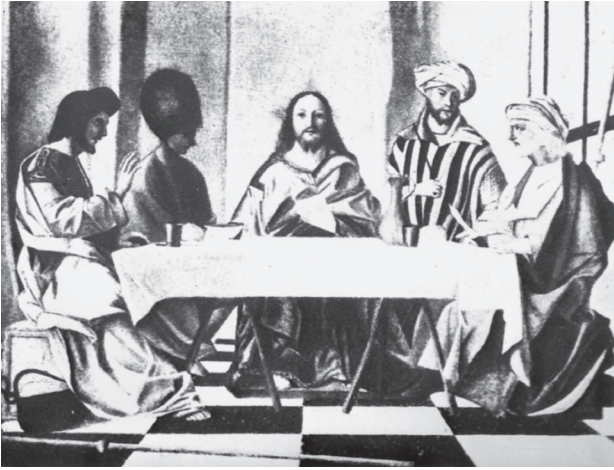
Εἰκ. 2. Giovanni Bellini, πίνακας Δείπνου εἰς Ἐμμαούς, τέως στο Βερολίνο (M. Chatzidakis, Etudes, V, εἰκ. 107).

λογικῆς σύνθεσης 13 εἰσάγεται ἐδῶ μία παραλλαγή τῆς δυτικῆς Pietà, ἓνα μὴ ὀρθόδοξο Andachtsbild ( devotional icon , εἰκόνα ἰδιωτικῆς εὐλάβειας), ὅπως ἔχουμε ἐπισημάνει ἐδῶ καὶ δεκαετίες 14 . Ἡ ἀνεπάρκεια στὴ χρῆση μελετῶν-πλαισίων εἶναι συχνότατα ἐμφανῆς, κυρίως ὅσον ἀφορᾷ τὸ εἰκονολογικὸ ὑπόβαθρο τῶν ἔργων τέχνης· τὸ γεγονός συνδέεται ἄμεσα, πιστεύουμε, μὲ τὴ