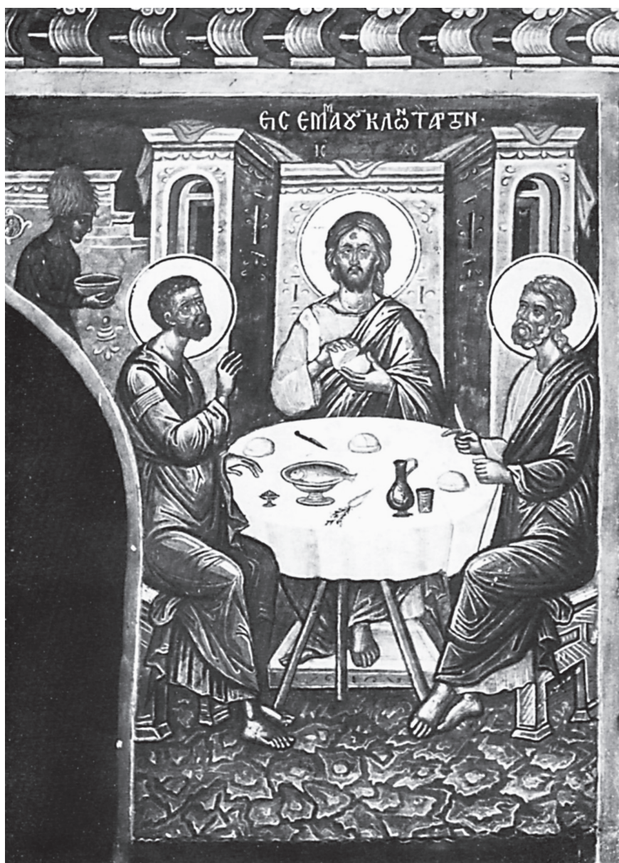
Εικ. 1. Θεοφάνης ὁ Κρής, τοιχ. Δείπνου εἰς Ἐμμαούς, καθολικὸ Μονῆς Σταυρονικήτα Ἁγ. Ὁρους (M. Chatzidakis, Etudes , V, εἰκ. 106).

ιστορικό-εὐχαριστιακὸ νόημα τῆς σύνθεσης 11 . Τὸ ἀντίθετο συμβαίνει μὲ τὴν «εἰκόνα» τῆς Ἄκρας Ταπεινώσεως