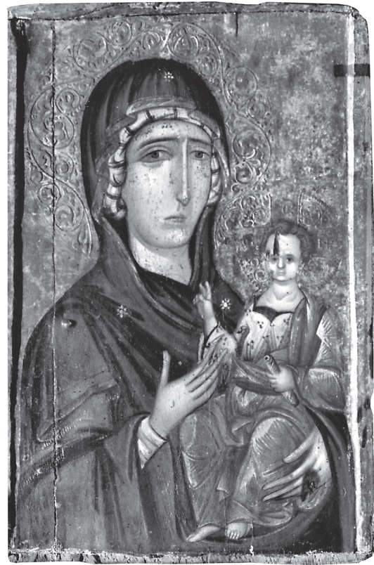
Εικ. 2. Βυζαντινό Μουσείο Καστοριάς. Παναγία Οδηγήτρια.

Το περίγραμμα του σώματος και του φωτοστεφάνου αποδίδονται με την τεχνική της εγχάραξης. Το φωτοστέφανό του πρέπει να ήταν ένσταυρο, αφημένο πάνω στο κατεστραμμένο σήμερα ασημένιο βάθος της εικόνας, όπου διακρίνονται ίχνη των κόκκινων γραμμών που όριζαν τις κεραίες του σταυρού. Το πρόσωπό του είναι ωσειδές, με έντονα ζυγωματικά, ανασηκωμένα φρύδια, καλογραμμένα μάτια, λεπτή μύτη, αχνή, κοντή γενειάδα, με πλάγιο, σχεδόν ανστηρό βλέμμα. Στην απόδοσή του επικρατεί ο ανοιχτοκαστανός προπλασμός, που συμφύρεται μαλακά με την σταρένια σάρκα, φωτίζοντας αγνά το πρόσωπο. Ο φυσιογνωμικός αυτός τύπος του Χριστού με την συγκεκριμένη τεχνική συνδέει άμεσα την εικόνα της Καστοριάς με έργα της ομώνυμης «σχολής», όπως είναι ο Χριστός της Δείσεως του Παλαιού καθολικού στην μονή του Μεγάλου Μετέωρου Θεσσαλίας (1483) 4 και της μονής του Αγίου Γεωργίου του Kremikovski, έξω από την Σόφια, στην Βουλγαρία (1493) 5 . Επίσης ο τύπος των γραμμάτων στην επιγραφή του κώδικα εντάσσεται στην καθιερωμένη γρα-