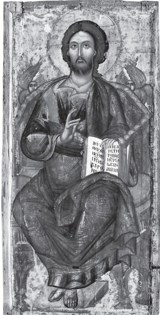
Εικ. 4. Βυζαντινό Μουσείο Καστοριάς. Χριστός Ένθρονος.

Στην επόμενη εικόνα παριστάνεται ο αρχάγγελος Γαβριήλ (164×72 εκ.) 12 ολόσωμος και μετωπικός (Εικ. 5).