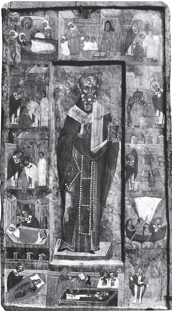
Εικ. 6. Βυζαντινό Μουσείο Καστοριάς. Άγιος Νικόλαος με σκηνές του βίου του.