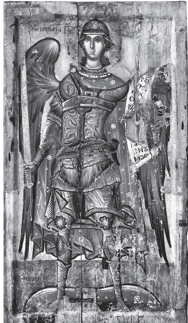
Εικ. 7. Βυζαντινό Μουσείο Καστοριάς. Αρχάγγελος Μιχαήλ.

κρίνεται σε φυσιογνωμικούς τύπους και καλλιτεχνικούς τρόπους έργων της «σχολής» της Καστοριάς, όπως είναι η τοιχογραφία του αγίου Νικολάου, στον Άγιο Νικήτα στο Cucer, έξω από τα Σκόπια και κυρίως του αγίου Νικολάου στον Άγιο Νικόλαο της μοναχής Ευπραξίας στην Καστοριά (1485/6) 17 .