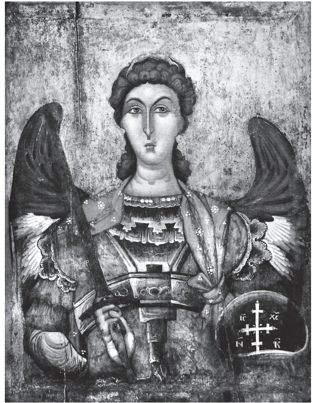
Εικ. 9. Εθνικό Μουσείο Μεσαιωνικής Τέχνης Κορυτσάς. Αρχάγγελος Μιχαήλ.

Από θεματική άποψη οι εικόνες παριστάνουν στην πλειοψηφία τους μεμονωμένα πρόσωπα, όπως του Χριστού, της Παναγίας, του αγίου Νικολάου, των αρχαγγέλων ή άλλων αγίων.