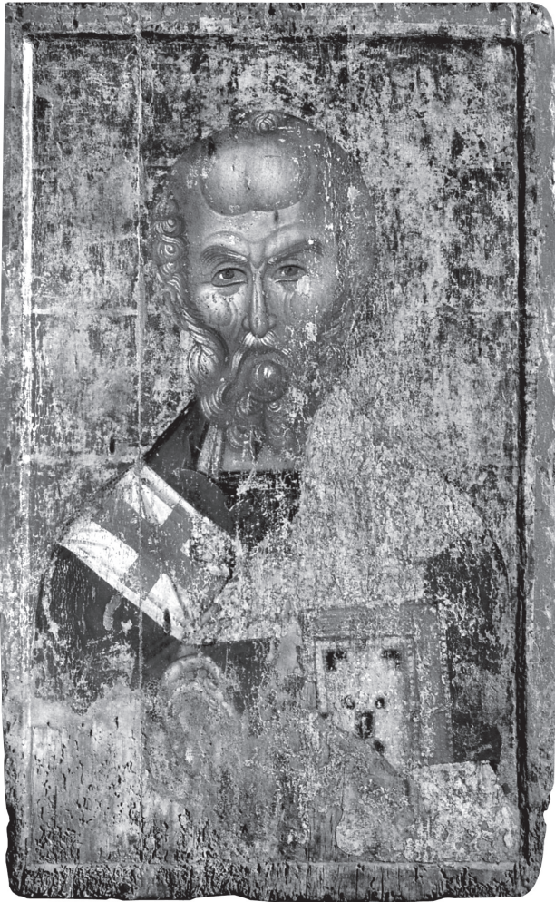
Εικ. 3. Βυζαντινό Μουσείο Καστοριάς, Άγιος Νικόλαος.

Ο Χριστός, ο οποίος έχει ασυνήθιστα μεγάλο σώμα με στενούς ώμους και μικρό κεφάλι κάθεται αναπαυτικά στην αγκαλιά της Παναγίας. Το πρόσωπό του είναι εύσαρκο, με ψηλό μέτωπο, μεγάλα μάτια και χοντρή μύτη. Φοράει λαδοπράσινο χιτώνα, διακοσμημένο με γεωμετρικά μοτίβα, και ανοιχτοκάστανο ιμάτιο, που ξανοίγεται με άφθονες χρυσοκοντηλιές και χρυσές ανταύγειες. Τα περιγράμματα των σωμάτων και των φωτοστεφάνων αποδίδονται, όπως και στην προηγούμενη εικόνα,