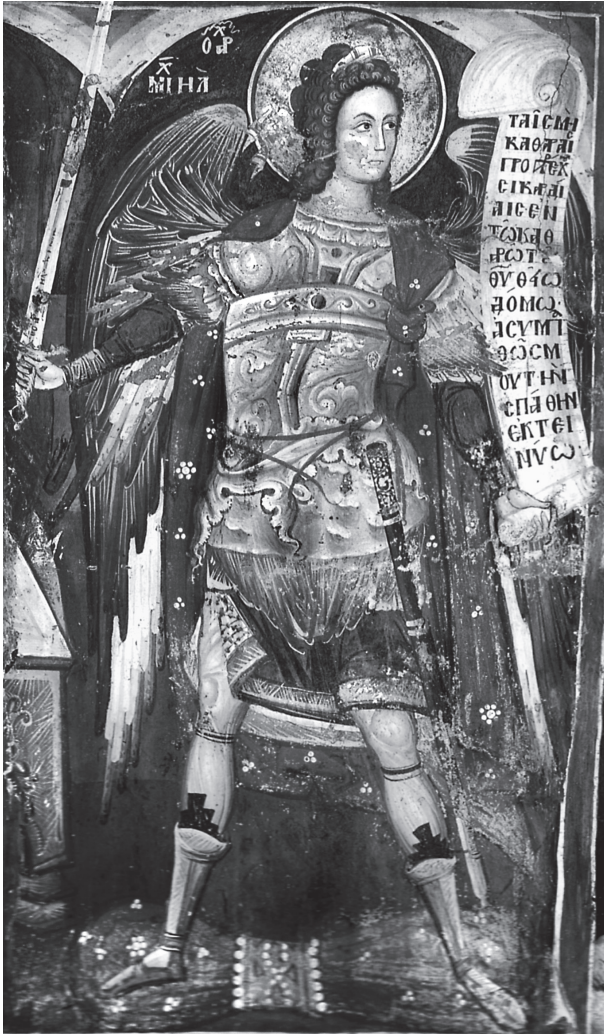
Εικ. 8. Παλαιό καθολικό της μονής του Μεγάλου Μετέωρου. Αρχάγγελος Μιχαήλ.

επιγραφή: Δέησ(ις) τοῦ δού(λου) τοῦ Θε(ο)ῦ Δίμου ἱερέ(ως) 18 .