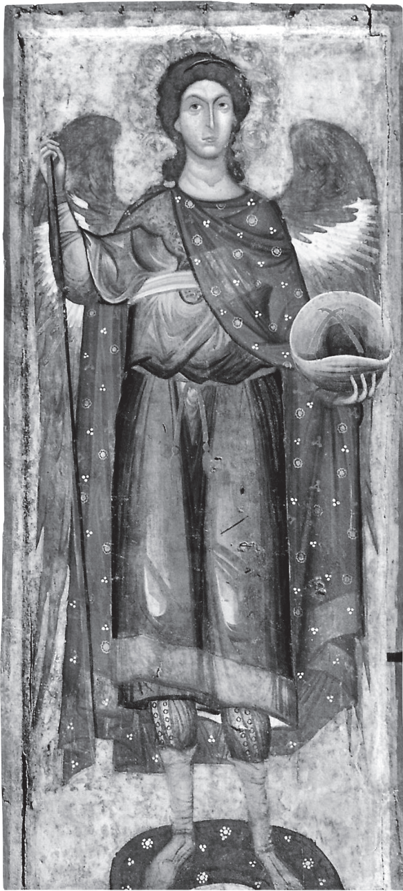
Εικ. 5. Βυζαντινό Μουσείο Καστοριάς. Αρχάγγελος Γαβριήλ.

εκτελεστεί με την τεχνική του χαμηλού αναγλύφου. Από το ασημένιο βάθος της εικόνας διατηρούνται ελάχιστα λείψανα, ενώ δεν σώζεται κανένα ίχνος της επιγραφής. Στην πίσω όψη της εικόνας αναπτύσσεται μεγάλος, πορφυρού χρώματος σταυρός Αναστάσεως που συνοδεύεται με κρυπτογράμματα.