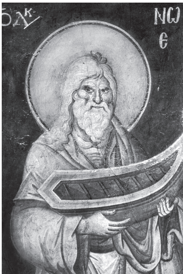
Εικ. 3. Ναός Πρωτάτου. Τοιχογραφία του Δίκαιου Νώε, περ. 1290, λεπτομέρεια.