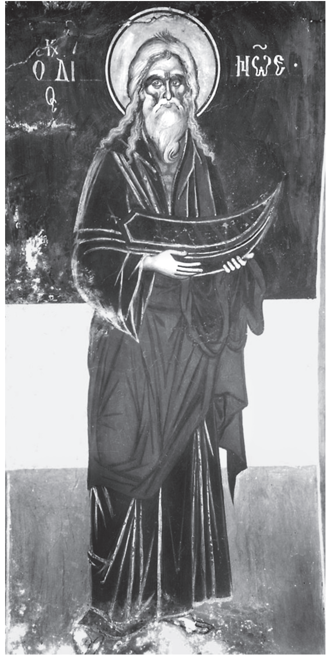
Εικ. 4. Παρεκκλήσι Προδρομού. Τοιχογραφία του Δίκαιου Νάε, 1711.

ται ότι δεν άργησε να δημιουργήσει προβλήματα. Ο Θεοφάνης στον Βίο του Διονυσίου αφήνει να διαφανεί ο φθόνος που η μεγάλη προσέλευση μαθητών στο εργαστήριο του είχε δημιουργήσει, και παραθέτει δυο ανεκδοτολογικού χαρακτήρα ιστορίες. Στην πρώτη ο προηγούμενος της μονής Καρακάλλου, Χριστόφορος, τον εράβδισε δημοσίως στα πόδια ντροπιάζοντάς τον, με το