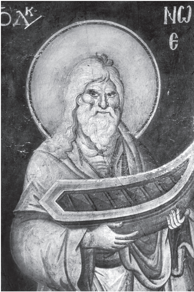
Εικ. 3. Ναός Πρωτάτου. Τοιχογραφία του Δίκαιου Νάε, περ. 1290, λεπτομέρεια.