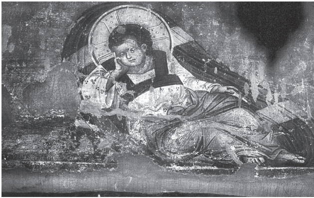
Εικ. 5. Ναός Πρωτάτου. Ο Χριστός Αναπεσών, τοιχογραφία, περ. 1290.