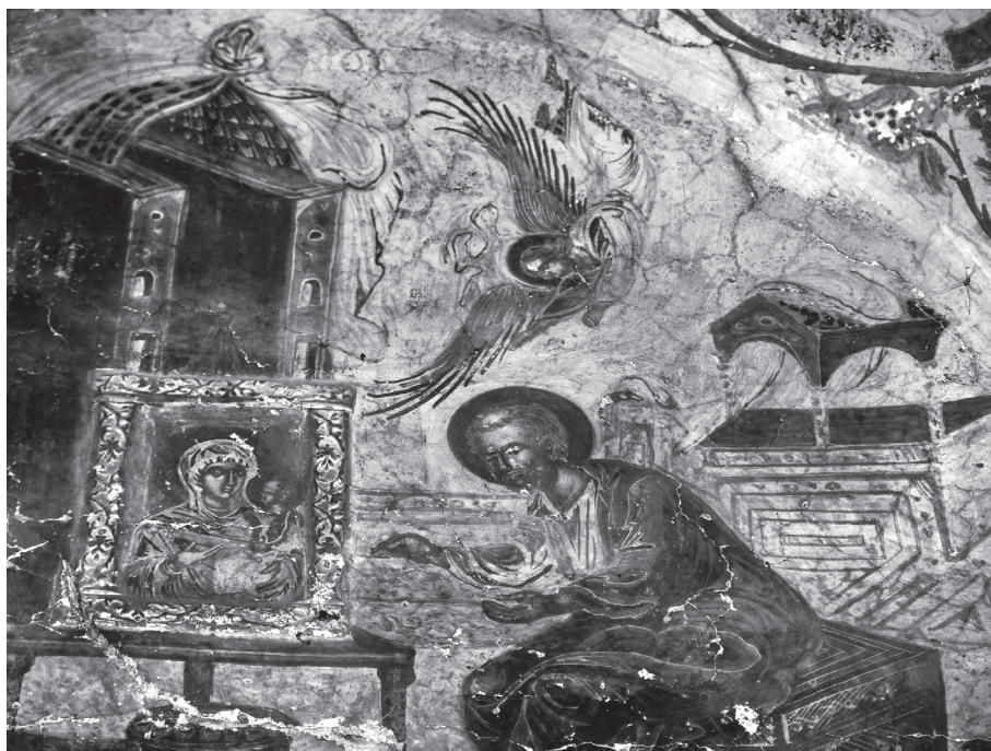
Εικ. 5. Άγιος Δημήτριος στο Γρεβενίτι, 17ος αιώνας.