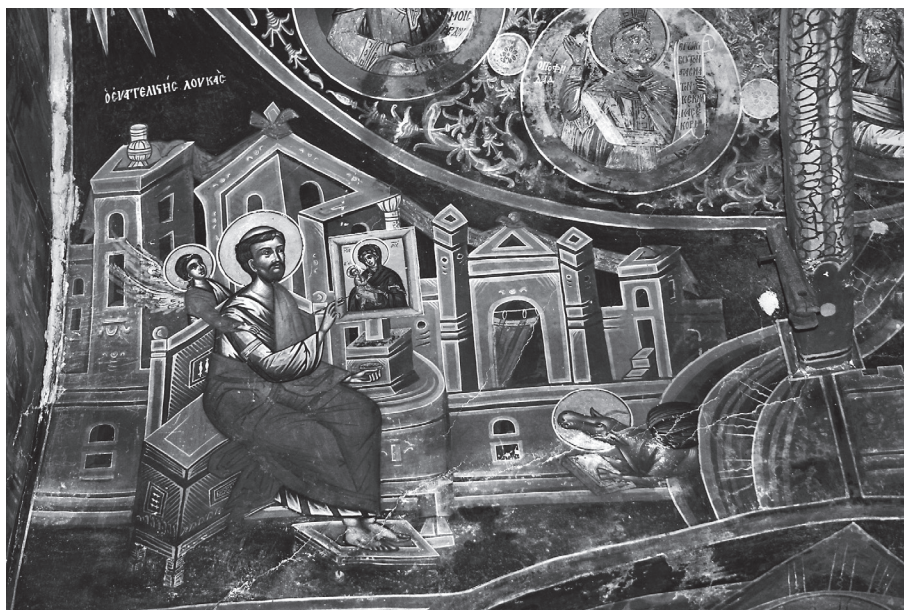
Εικ. 6. Μονή Γενεσίου Θεοτόκου (Σπηλαίου), Σαρακίνιστα, 17ος αιώνας (φωτογραφία Ι. Χουλιαράς).

καθώς και στη Μονή Μεταμορφώσεως στο Δρυόβουνο 1652 39 . Ανάλογη είναι η απόδοση του ευαγγελιστή στη Μονή Γενεσίου της Θεοτόκου (Σπηλαίου), στη Σαρακίνιστα, έργο του έτους 1658/9, που αποδίδεται στον ζωγράφο Ιωάννη από τη Γράμμοστα, ο οποίος ακολουθεί τα πρότυπα των λινοτοπιτών (Εικ. 6) 40 . Ο ευαγγελιστής καθισμένος σε θρόνο, μπροστά από μια πολιτεία, καθοδηγούμενος από έναν μικρό άγγελο ζωγραφίζει την εικόνα της Οδηγήτριας η οποία είναι στερεωμένη σε συμπαγή βάση.