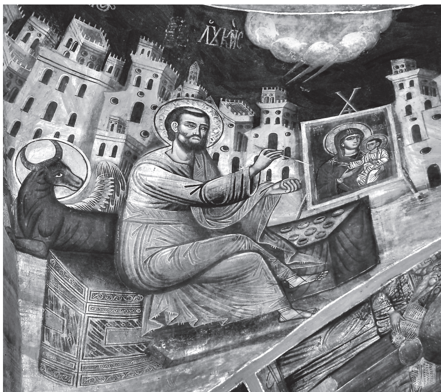
Εικ. 8. Γενέσιο Θεοτόκου, Θεσπρωτικό, 18ος αιώνας.

ακρίβεια και ευρηματικότητα την αξία της ζωγραφικής πράξης. Στη Μονή Σέλτσου, στις Πηγές της Αρτας 46 , έργο του ιερέα Νικολάου στα 1697, σε μια λαϊκότροπη εκδοχή, η εικόνα της Παναγίας προβάλλεται εντυπωσιακά, σε μεγαλύτερο μέγεθος από τον ευαγγελιστή, ενώ προβάλλει επίσης σε μεγάλο μέγεθος, μακρόστενη κασετίνα με θήκες για τα χρώματα. Στο Γενέσιο της Θεοτόκου στο Θεσπρωτικό 1797 47 (Εικ. 8), σε μια σύνθεση με πλούσια χρώματα, μπροστά από μια μεγάλη πολιτεία, ο Λουκάς είναι καθισμένος σε ιδιαίτερα χαλαρή στάση, έχοντας το ένα πόδι επάνω στο άλλο, ενώ ζωγραφίζει με το δεξί την εικόνα της Οδηγήτριας, κρατώντας σφικτά στο αριστερό του ένα όστρακο με το κόκκινο χρώμα. Μπροστά του, επάνω στο τραπέζι, στρωμένο με κόκκινο ύφασμα, είναι τακτοποιημένα άλλα εννέα όστρακα