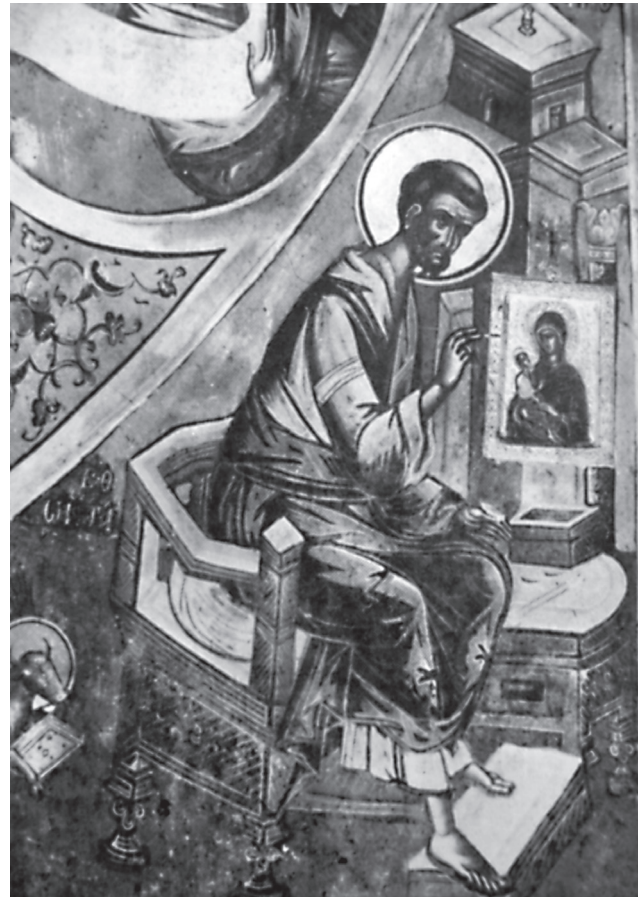
Εικ. 2. Μεταμόρφωση της Βελτσιόστας, Γεώργιος και Φράγκος Κονταρής, 1568.

έτους 1672/3 23 , όπου ο ευαγγελιστής περιβάλλεται από σκηνές του βίου του, ενώ με ακρίβεια αποδίδονται λεπτομέρειες από τα εργαλεία της τέχνης του, με ευταξία τοποθετημένα μπροστά του.