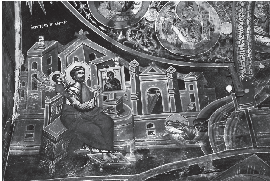
Εικ. 6. Μονή Γενεσίου Θεοτόκου (Σπηλαίου), Σαρακίνιστα, 17ος αιώνας.

καθώς και στη Μονή Μεταμορφώσεως στο Δρυόβουνο 1652 39 . Ανάλογη είναι η απόδοση του ευαγγελιστή στη Μονή Γενεσίου της Θεοτόκου (Σπηλαίου), στη Σαρακίνιστα, έργο του έτους 1658/9, που αποδίδεται στον ζωγράφο Ιωάννη από τη Γράμμοστα, ο οποίος ακολουθεί τα πρότυπα των λινοτοπιτών (Εικ. 6) 40 . Ο ευαγγελιστής καθισμένος σε θρόνο, μπροστά από μια πολιτεία, καθοδηγούμενος από έναν μικρό άγγελο ζωγραφίζει την εικόνα της Οδηγήτριας η οποία είναι στερεωμένη σε συμπαγή βάση.