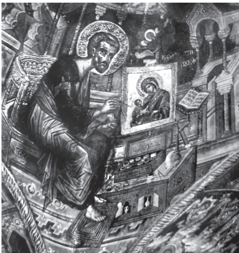
Εικ. 4. Μονή Βαρλαάμ, Φράγκος Κατελάνος, 1548.

ζωγράφου είναι ελάχιστα, στις τοιχογραφίες των θηβαίων ζωγράφων στην ηπειρωτική Ελλάδα το θέμα είναι ιδιαίτερα αγαπητό και μάλιστα από την τέταρτη δεκαετία του 16ου αιώνα, δηλαδή αρκετά ενωρίτερα από την περίοδο δράσης του Δομήνικου Θεοτοκόπουλου στο Ηράκλειο. Αυτό το ξεχωριστό ενδιαφέρον για να τιμηθεί το επάγγελμα του ζωγράφου από τον Φράγκο Κατελάνο, διαπιστώνεται με διαφορετικό τρόπο στις τοιχογραφίες του εξωνάρθηκα της Μονής Φιλανθρωπηνών (1560) 29 καθώς και του παρεκκλησίου του Αγίου Νικολάου της Λαύρας (1560), όπου ο θηβαίος ζωγράφος περιλαμβάνει μεταξύ άλλων αγίων, τον σπάνια απεικονιζόμενο άγιο Λάζαρο 30 , τον ζωγράφο, όπως επιδεικτικά αναγράφεται σε επιγραφή που συνοδεύει τη μορφή του. Στην παράσταση αυτή μάλιστα ο άγιος μοναχός, κρατεί