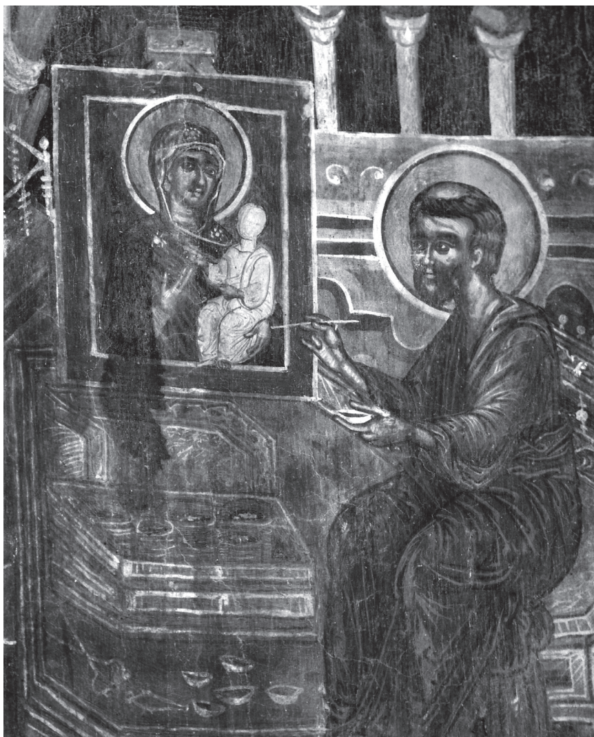
Εικ. 7. Παναγία, Πύθιο, Λάρισα, 17ος αιώνας.

λής. Μπροστά του, βρίσκεται ένα μεγάλο ανοιγμένο κιβώτιο με τα χρώματα και από κάτω οι αχιβάδες, ένας διαβήτης και άλλα χρήσιμα εργαλεία για την άσκηση της τέχνης του. Παραστάσεις με παρόμοια ημιτελή απόδοση της εικόνας της Παναγίας εμφανίζονται και νωρίτερα, όπως στον Άγιο Νικόλαο της Καρίτσας, (1565) 44 και στο ναό της Παναγίας στη Μονή της Κοίμησης της Θεοτόκου