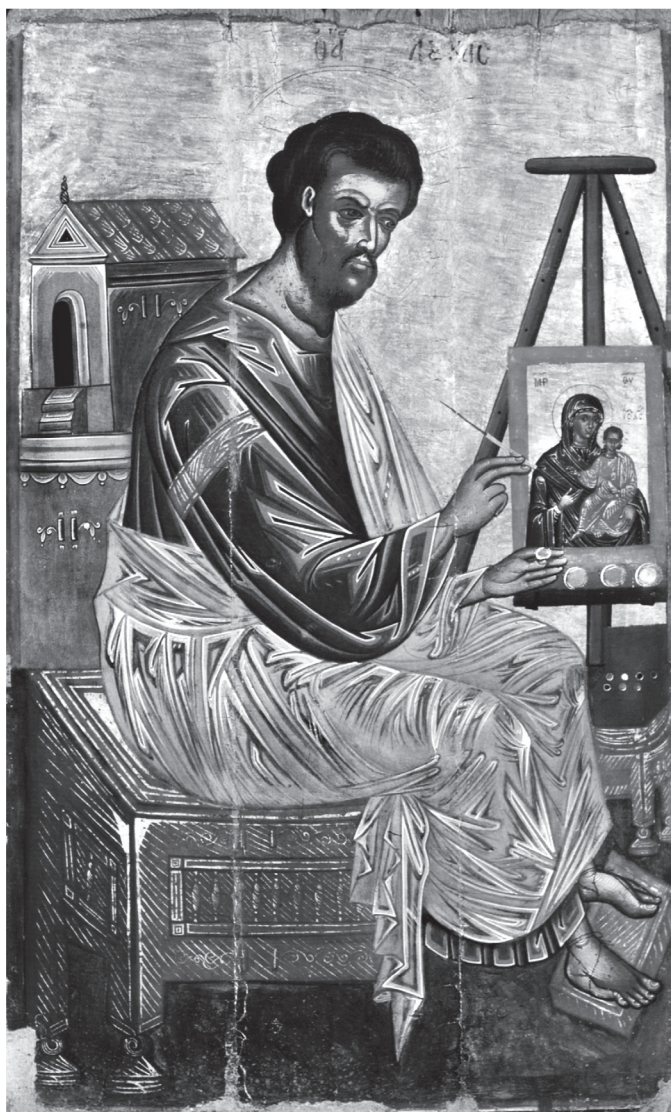
Εικ. 3. Εικόνα, Εθνική Πινακοθήκη, Αθήνα, εργαστήριο Γεωργίου και Φράγκου Κονταρή, μέσα 16ου αιώνα.

επίσης να παρατηρήσουμε ότι ο Κατελάνος επιλέγει τον ίδιο εικονογραφικό τύπο για την απόδοση του Λουκά ως ζωγράφου στη διακόσμηση του παρεκκλησίου του Αγίου Νικολάου στη Μονή της Λαύρας 26 , αρκετά χρόνια αργότερα, το 1560. Στην παράσταση αυτή ο μικρός άγγελος κρατεί ξεδιπλωμένο ειλητάριο με επιγραφή,