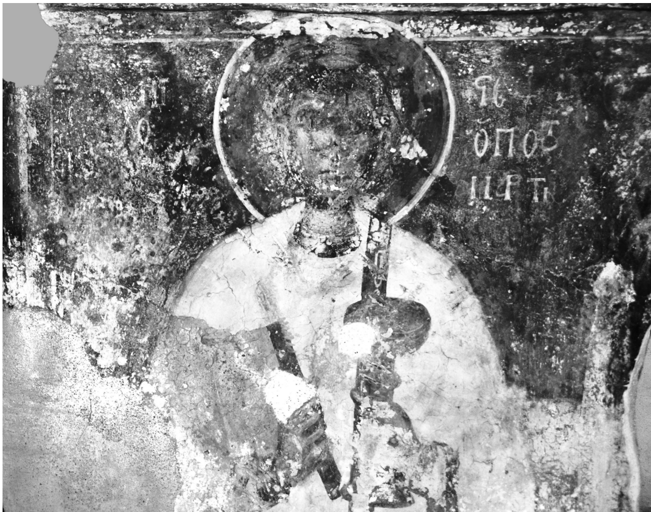
Εικ. 4. Ρόδος, Πεύκοι (Λίνδος), ναός του Αγίου Ιωάννη του Μερογλίτη. Ο άγιος Στέφανος.

ζονται στα αδιόρατα, λεπτά φωτίσματα του διακόνου. Στην τοιχογραφία του έφιππου στρατιωτικού αγίου Νικήτα, από το αρκοσόλιο του βόρειου τοίχου της Παναγίας της Καθολικής στη Λάρδο 14 (Εικ. 5), των μέσων περίπου του 15ου αιώνα, ακολουθείται η ίδια εικονογραφία με την εικόνα μας. Οι θερμοί χρωματικοί τόνοι εδώ κυριαρχούν, με τη χρήση του ερυθρού, εκτός από το άλογο και την ιπποσκευή, στον μανδύα και την ασπίδα. Στην όμοια στάση και αντίληψη της όλης σύνθεσης, με μικρές επιμέρους διαφοροποιήσεις ως προς την πολυτελέστερη εξάρτηση του αγίου Νικήτα,