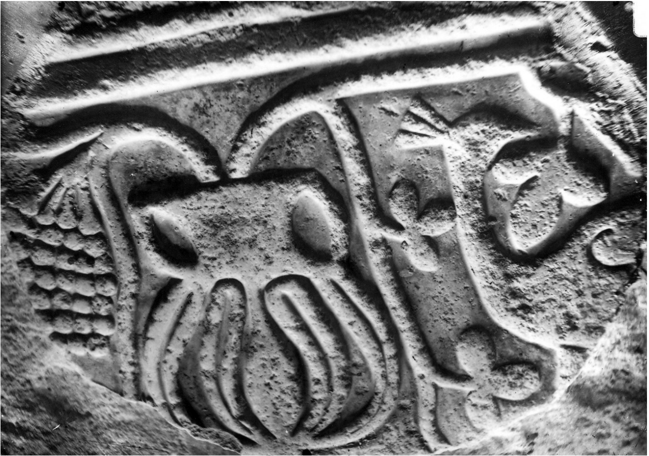
Εικ. 4. Σπάραγμα αναγλύφου του 7ου αιώνα, άλλοτε στον ναό του Αγίου Μηνά στη Λαμία. Για το συμβολικό περιεχόμενο της παράστασης ο Λαμπάκης έδωσε διάλεξη στην πόλη το 1904.

Γραφείον τοῦ Συλλόγου αὔριον 10ην π.μ. καὶ ἐκθέση- τε τὰ ὑπὸ τοῦ Μωάμεθ τοῦ Β.΄ χορηγηθέντα προνόμια τοῦ Γένους καὶ διατηρηθέντα μέχρι τῆς ἐκπτώσεως τοῦ Ἄβδουλ Χαμίντ-Χάν τοῦ Β.΄», αναφέρεται στη σχετι- κὴ ἐπιστολὴ του σωματείου με ἡμερομηνία 10 Ἰουλίου 1910, ἡ ὁποία σώζεται στο Ἀρχεῖο τῆς Οἰκογένειας Λαμπάκη. Επρόκειτο για τὴν περίοδο τῆς ἐπικράτη- σης των Νεοτούρκων στὴν οθωμανικὴ αυτοκρατορία, που εἶχε ως συνέπεια τὴν ἀσκησιμὴ πίεσεων καὶ διώξε- ων σε βάρος των αλύτρωτων ἐλληνικῶν πληθυσμῶν καὶ προκαλοῦσε μεγάλη ἐνταση στὴν κοινὴ γνώμη του ἐλεύθερου βασιλείου. Ο Σύλλογος ἀνακήρυξε ἕνα χρόνο ἀργότερα τὸν Λαμπάκη ως ἐπίτιμο μέλος του 70 .