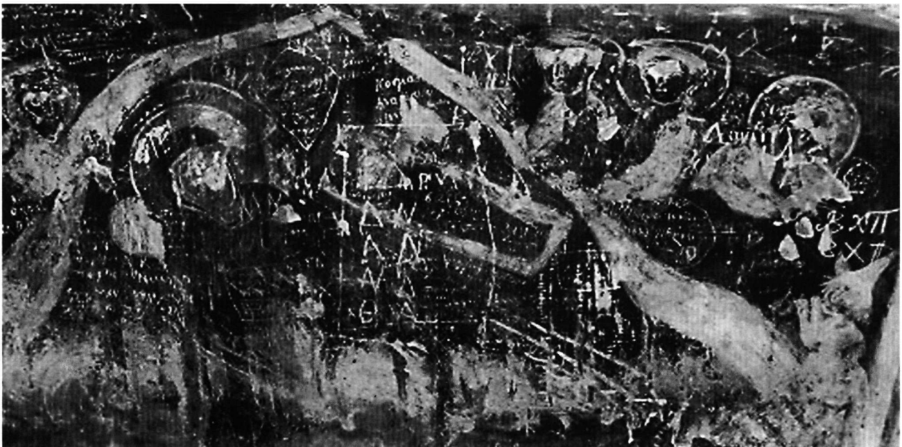
Fig. 7. Église de la Panagia : Nativité (détail).