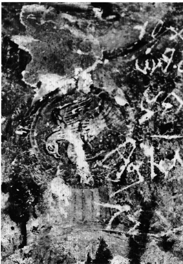
Fig. 5. Église de la Panagia : détail du Baptême.

tion de saint Georges à cheval portant en croupe le jeune garçon de Mitylène, qui tient encore à la main le verre qu'il s'apprêtait à offrir à l'émir de Crète 19 . Quelques figures isolées – certaines non identifiables – sont dispersées dans la nef de l'église, parmi lesquelles, près de la Nativité, sur le pilastre (face ouest), saint Onuphre, mentionné par Jerphanion. Deux saints médecins étaient représentés sur l'arc doubleau qui divise la voûte en deux parties – Damien (au nord), Cosme (au sud) – et l'archange Gabriel, en loros, sur