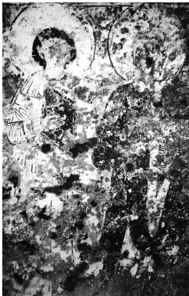
Fig. 9. Saint-Michel : saints (voûte de la nef, versant nord).