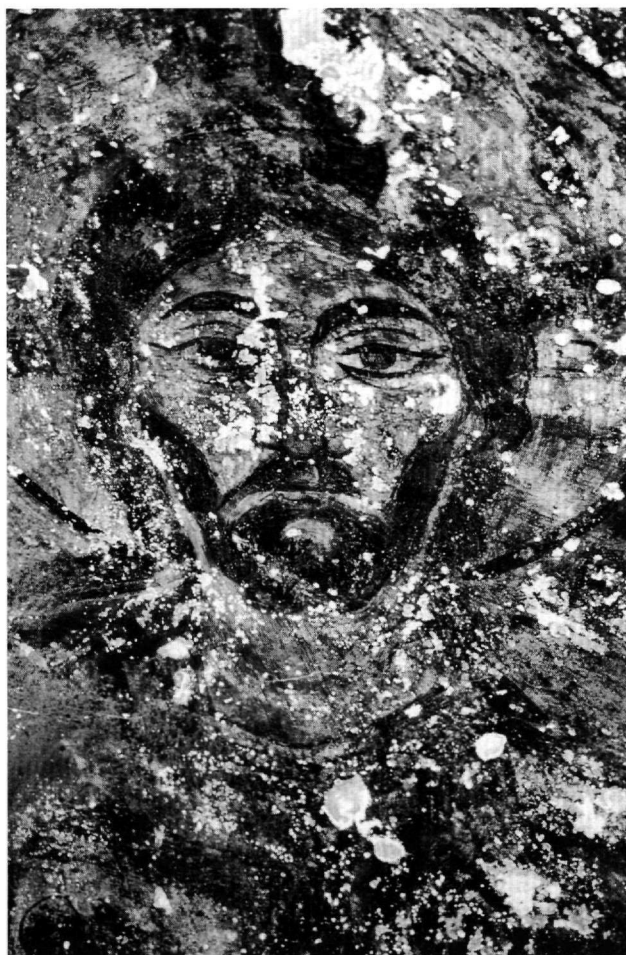
Fig. 4. Église de la Panagia : Christ de la Déisis.

dessus se trouve la crèche ; trois anges apparaissent à droite, dont l'un s'adresse au jeune berger musicien, coiffé d'un chapeau pointu ; à gauche, on distingue la tête nimbee de Joseph et hors de la grotte, les mages (Fig. 6 et 7). Les compositions peintes dans la partie occidentale de la nef sont détruites ou illisibles, à l'exception de celles qui décoraient le mur ouest. Sur la partie inférieure de la paroi, se déployait la Dormition de la Vierge, dont ne subsistent que des fragments. Au-dessus, dans le tympan, on distingue avec peine, sous l'épaisse couche de suie qui la recouvre, la représenta-