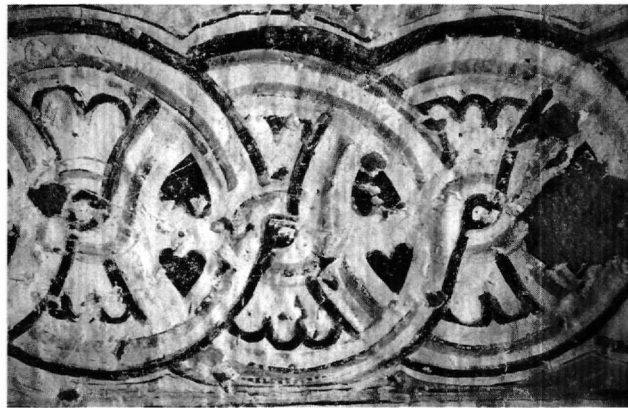
Fig. 11. Uçhisar, Çatal kaya kilisesi : ornement au sommet de la voûte de la nef.

du compas, dans l'église cruciforme (n° 6) de Mavruçan / Güzelöz : Jerphanion l'avait remarqué 38 , s'étonnant de la complication savante du motif dans un décor aussi fruste ; les peintures de Saint-Michel de Başköy pourraient bien en avoir fourni le modèle 39 . Il apparaît aussi, mais traité de façon plus schématique, à Çömlekçi kilisesi (l'« église du potier »), près de Güzelyurt (Gelveri, anc. Karbala) 40 , et nous l'avons retrouvé, étonnamment comparable à celui de Başköy, dans une église inédite des environs d'Uçhisar (Çatal kaya kilisesi) : décorant le sommet de la voûte de la nef, soigneusement tracé, il présente, en particulier, les mêmes motifs cordiformes opposés deux à deux à l'intersection des cercles 41 (Fig. 11). D'autres analogies rapprochent les deux églises de Başköy et d'Uçhisar, concernant l'architecture – la voûte en berceau très surbaissée qui couvre la nef – la palette du peintre, dominée par les couleurs claires (jaune, rose,