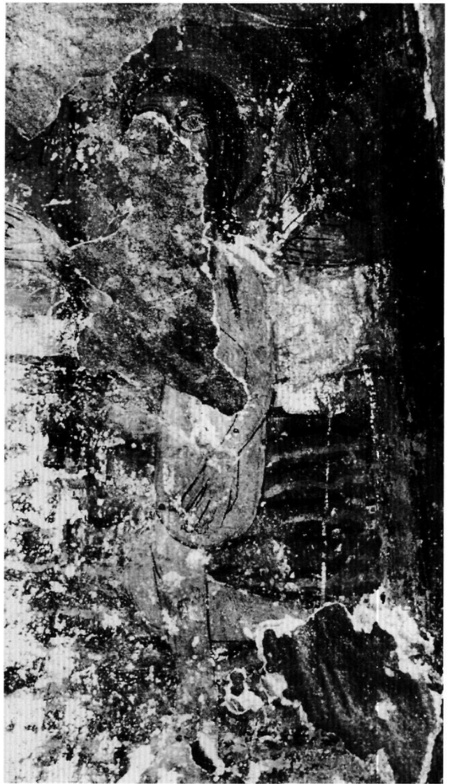
Fig. 1. Saint Basile : détail de la Nativité (bain de l'Enfant).

morphe, d'un séraphin et d'une figure nimbée (?). Ces éléments permettent de restituer une image du Christ en gloire entre chérubins et séraphins, avec peut-être les prophètes