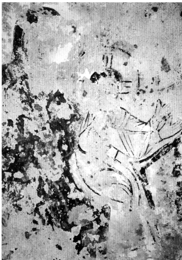
Fig. 8. Saint-Michel : Adoration des Mages, détail.

houettes rapprochées de Marie, à gauche, plus grande, en maphorion rouge, et d'Élisabeth, à droite, dont sont conservés les yeux ronds et la main posée sur le ventre de sa cousine. La composition de la Nativité terminait le registre. Il res-