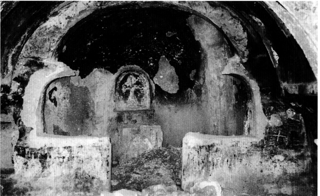
Fig. 3. Église de la Panagia : vue générale vers l'abside sud.

un renforcement rectangulaire à plafond, au décor ornemental (damiers enfermant des rosaces reliées par des diagonales aux angles des carrés), espace dont on ne peut actuellement dire s'il accueillait jadis une tombe. L'abside était fermée par un templeon élevé, dont il reste les chancels et le départ des ouvertures cintrées de la partie haute. L'église était entièrement peinte mais Jerphanion n'avait pu identifier aucun sujet. Dans la conque de l'abside, le trône, dont on distingue les traces, était vraisemblablement celui du Christ, la Théotokos étant présente au registre inférieur, à gauche de la niche médiane que décore une croix. Elle était en pied, tenant l'Enfant devant elle. À droite de la niche est conservé saint Jean Baptiste, vêtu de la mélote et désigné comme le Prodrome. De part et d'autre était alignée une série de saints : deux figures à barbe brune (apôtres ou martyrs?) et deux évêques du côté nord, un saint (apôtre ou martyr?) et trois évêques du côté sud. À l'intrados de l'arc absidal, fragments de deux personnages en pied, qui paraissent avoir été richement vêtus, trop détruits pour être identifiés. Dans la nef, on peut proposer de reconnaître, sous toute réserve, deux archanges en costume impérial, se faisant face à l'extrémité orientale de la voûte, puis, sur le versant