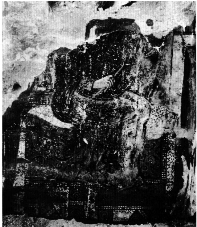
Fig. 2. Église inédite : Vierge de l'Annonciation.

Après une église à nef unique, ensablée jusqu'au haut des parois, dont l'abside est décorée, à la base de la conque, d'une succession de médaillons en méplat, sans peintures conservées, on parvient à Saint-Charalambos (Güzelöz n° 11), qui, également dépourvue de décor peint, à l'exception