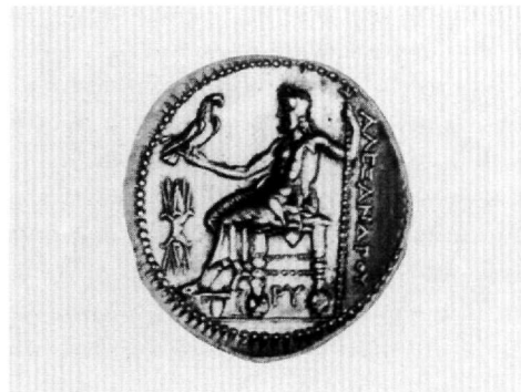
Εικ. 8. Τετράδραχμον Πτολεμαίου Α'. Νομισματικό Μουσείο Αθηνών.

scirio χρονολογείται κατά τον Hahn 23 τον Δεκέμβριο του 583 και κατά τον Grierson σε μία από τις δύο υπατείες 24 , ενώ τα νομίσματα 25 χρονολογούνται το 601/602. Ο Φωκάς αναδείχθηκε ύπατος στις 25 Δεκεμβρίου του 603 και τα νομίσματα 26 με την απεικόνιση του scirio χρονολογούνται τον Δεκέμβριο του 603/604.