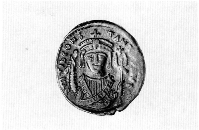
Εικ. 4. Φόλλης Τιβερίου Β΄ Κωνσταντίνου. Νομισματικό Μουσείο Αθηνών.

Είναι γνωστό ότι ο Μαυρίκιος αναδείχθηκε δύο φορές ύπατος: από 25 έως 31 Δεκεμβρίου του 583 και από 6 Ιουλίου έως 23 Νοεμβρίου του 602. Η δεύτερη υπατεία συνδέεται με την προσπάθειά του να ανακτήσει τη χαμένη δημοτικότητα του, που του στοίχισε το θρόνο και την ίδια του τη ζωή μερικούς μήνες αργότερα 22 . Το επετειακό μετάλλιο του Μαυρικίου με την παράσταση του