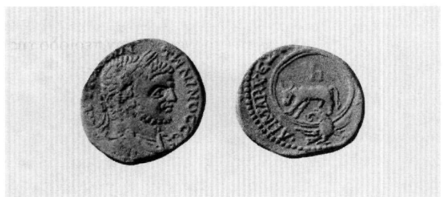
Εικ. 3. Τετράδραχμον Καρακάλλα.

άμεση σχέση με τον τίτλο του υπάτου: α) Σε σπάνια αργυρά τετράδραχμα των ρωμαίων αυτοκρατόρων Καρακάλλα και Μακρίνου, εκδόσεις νομισματοκοπέων Νεαπόλεως Σαμαρείας, Καισαρείας Μαριτίμας Συρίας και Γάζης 6 . Το πτηνό απεικονίζεται στον οπισθότυπο με ανοιγμένες τις μεγάλες φτερούγες του υποβαστάζοντας διάδημα ή στέφανο (Εικ. 2 και 3) 7 . Η παράσταση περιβάλλεται από κυκλική επιγραφή, η οποία δηλώνει το έτος βασιλείας, καθώς και την υπατική και δημαρχική εξουσία. Τα νομίσματα χρονολογούνται μεταξύ 215-218 μ.Χ., περίοδο κατά την οποία το υπατικό αξίωμα είναι εφάμιλλο της αυτοκρατορικής εξουσίας. β) Σε υπατικά δίπτυχα του βου αιώνα 8 , όπου ο εικονιζόμενος υπάτος κρατεί στο δεξί χέρι σκήπτρο, το οποίο απολήγει σε αετό με απλωμένα φτερά. Η εικόνα παρουσιάζει εκπληκτική ομοιότητα με αυτή των μολυβδοβούλλων της ίδιας περιόδου. Το συγκεκριμένο σκήπτρο ονομάζόταν sciprio και χρησιμοποιετο κυρίως σε στρατιωτικές παρελάσεις θριαμβικού χαρακτήρα 9 . Σκήπτρα ή ράβδους παρόμοιου τύπου, τα οποία ο Κωνσταντίνος Πορφυρογέννητος ονομάζει «ρωμαϊκά σκήπτρα», έφεραν και οι