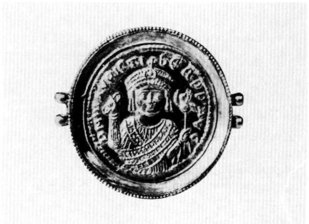
Εικ. 5. Μετάλλιο Μαυρικίου (Grierson, Kyrenia, πίν. VI, αριθ. 1).