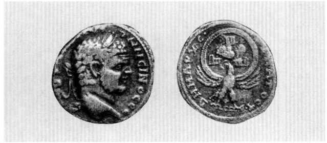
Εικ. 2. Τετράδραχμον Καρακάλλα. Ανάμεσα στις φτερούγες του αετού απεικονίζεται καιών βωμός.

άμεση σχέση με τον τίτλο του υπάτου: α) Σε σπάνια αργυρά τετράδραχμα των ρωμαίων αυτοκρατόρων Καρακάλλα και Μακρίνου, εκδόσεις νομισματοκοπέων Νεαπόλεως Σαμαρείας, Καισαρείας Μαριτίμας Συρίας και Γάζης 6 . Το πτηνό απεικονίζεται στον οπισθότυπο με ανοιγμένες τις μεγάλες φτερούγες του υποβαστάζοντας διάδημα ή στέφανο (Εικ. 2 και 3) 7 . Η παράσταση περιβάλλεται από κυκλική επιγραφή, η οποία δηλώνει το έτος βασιλείας, καθώς και την υπατική και δημαρχική εξουσία. Τα νομίσματα χρονολογούνται μεταξύ 215-218 μ.Χ., περίοδο κατά την οποία το υπατικό αξίωμα είναι εφάμιλλο της αυτοκρατορικής εξουσίας. β) Σε υπατικά δίπτυχα του βου αιώνα 8 , όπου ο εικονιζόμενος υπάτος κρατεί στο δεξί χέρι σκήπτρο, το οποίο απολήγει σε αετό με απλωμένα φτερά. Η εικόνα παρουσιάζει εκπληκτική ομοιότητα με αυτή των μολυβδοβούλλων της ίδιας περιόδου. Το συγκεκριμένο σκήπτρο ονομάζόταν sciprio και χρησιμοποιετο κυρίως σε στρατιωτικές παρελάσεις θριαμβικού χαρακτήρα 9 . Σκήπτρα ή ράβδους παρόμοιου τύπου, τα οποία ο Κωνσταντίνος Πορφυρογέννητος ονομάζει «ρωμαϊκά σκήπτρα», έφεραν και οι